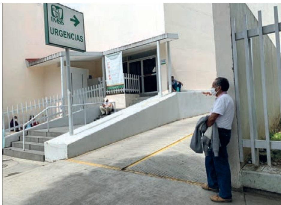
▲ La Organización Mundial de la Salud advierte que algunos países han desatendido programas vitales por darle prioridad a la pandemia.

“El impacto de la pandemia de COVID-19 en los servicios de salud esenciales es una fuente de gran preocupación”, dijo el organismo un informe sobre el estudio publicado el lunes. “Los principales avances en salud logrados en las últimas dos décadas pueden desaparecer en un corto período de tiempo (...)”.