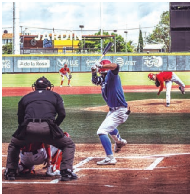
▲ Varios de los prospectos de los Leones en la LPM tienen oportunidad de firmar más adelante con clubes de las Mayores.