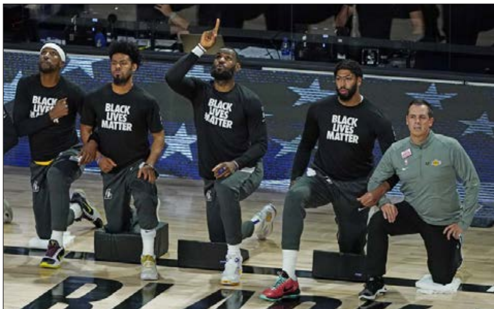
▲ LeBron James apunta hacia el cielo después de tocarse el himno nacional durante un partido de los playoffs de la NBA entre sus Lakers y Portland, en Lake Buena Vista.

Pero no fue necesario. En un gesto loable de un equipo con buenas posibilidades de ganar su primer título en casi medio siglo, Orlando no aceptó el regalo y desistió de jugar también en una muestra de solidaridad.