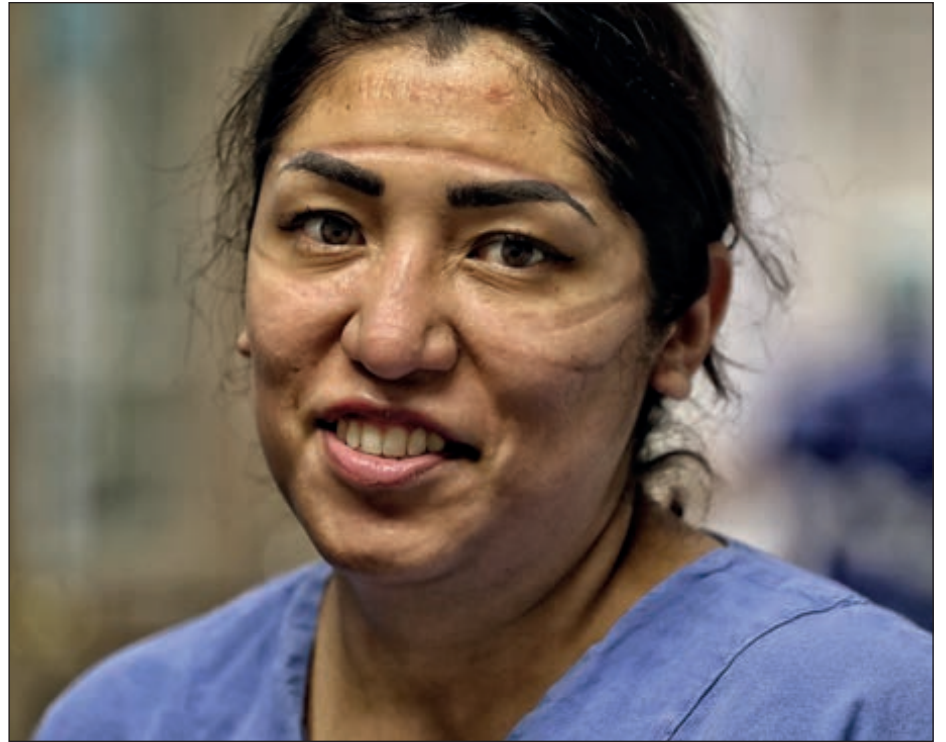
▲ Mascarillas y equipo de protección dejan huellas en el rostro de las enfermeras.

Bicho de oro al héroe anónimo que, aunque nadie lo vea, su hacer las cosas bien, nos mantienen a flote. ¡Gracias!