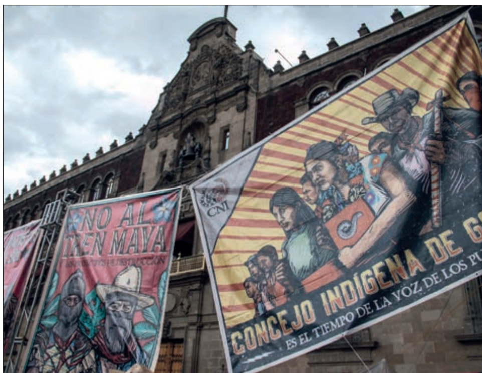
▲ Las asociaciones civiles aclararon que los defensores de indígenas y campesinos han existido desde hace muchos años sin dinero extranjero.

Aclaró que los financiamientos de varias de las asociaciones que se oponen al Tren Maya son nacionales e internacionales, así como públicos y legales. También dijo que ese dinero no está etiquetado para oponerse a ese megaproyecto, sino para cumplir con la misión y visión de las organizaciones.