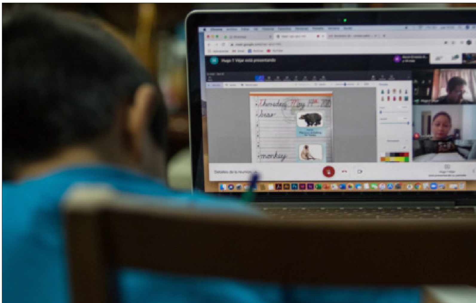
▲ En estos momentos de la pandemia, los nuevos héroes son los maestros, maestras, madres, padres y hermanos que dan lo mejor de sí para que los estudiantes tengan una buena preparación.