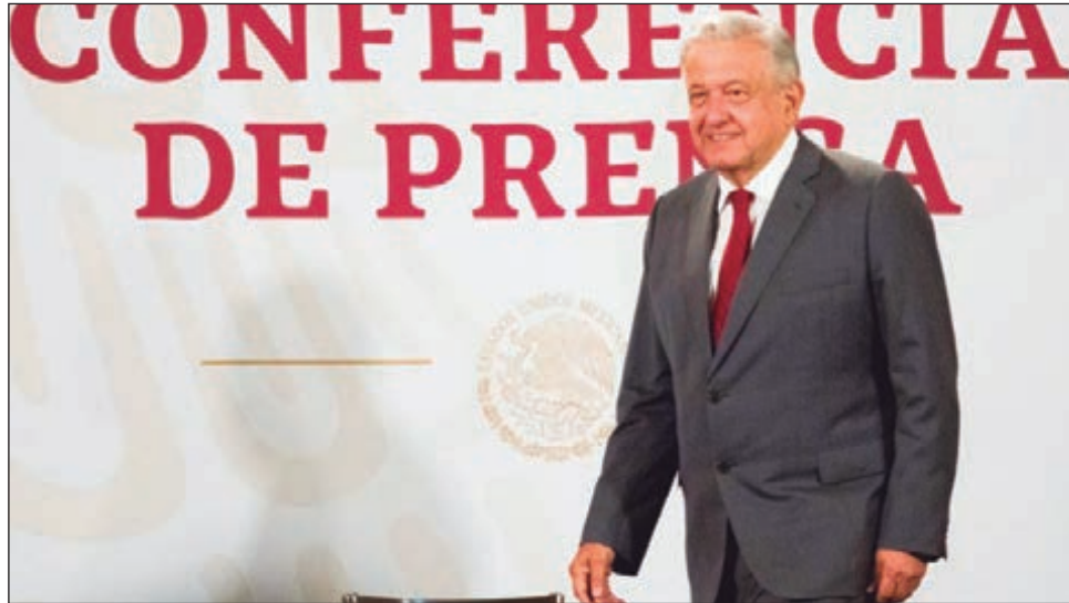
▲ El tema de la corrupción es muy importante para este gobierno y por eso estará en el primer párrafo del informe, adelantó el Presidente.

Previo al informe que presentará este martes, el presidente Andrés Manuel López Obrador sostuvo que se eliminó por completo la corrupción en los niveles más altos del gobierno federal, pero en otros escalafones sigue presente.