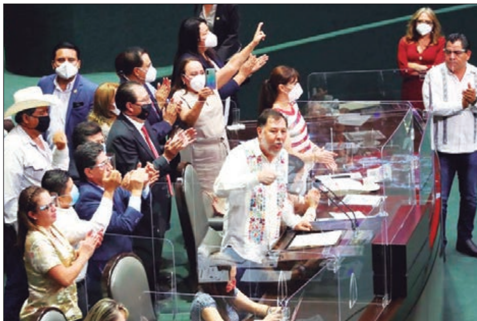
▲ El diputado Gerardo Fernández Noroña (c,izq) durante la sesión preparatoria de la Cámara de Diputados.

De esta manera, cuando el tablero cerró, los votos en favor se redujeron a 278, Morena sumó 64 abstenciones y otros 73 de la misma