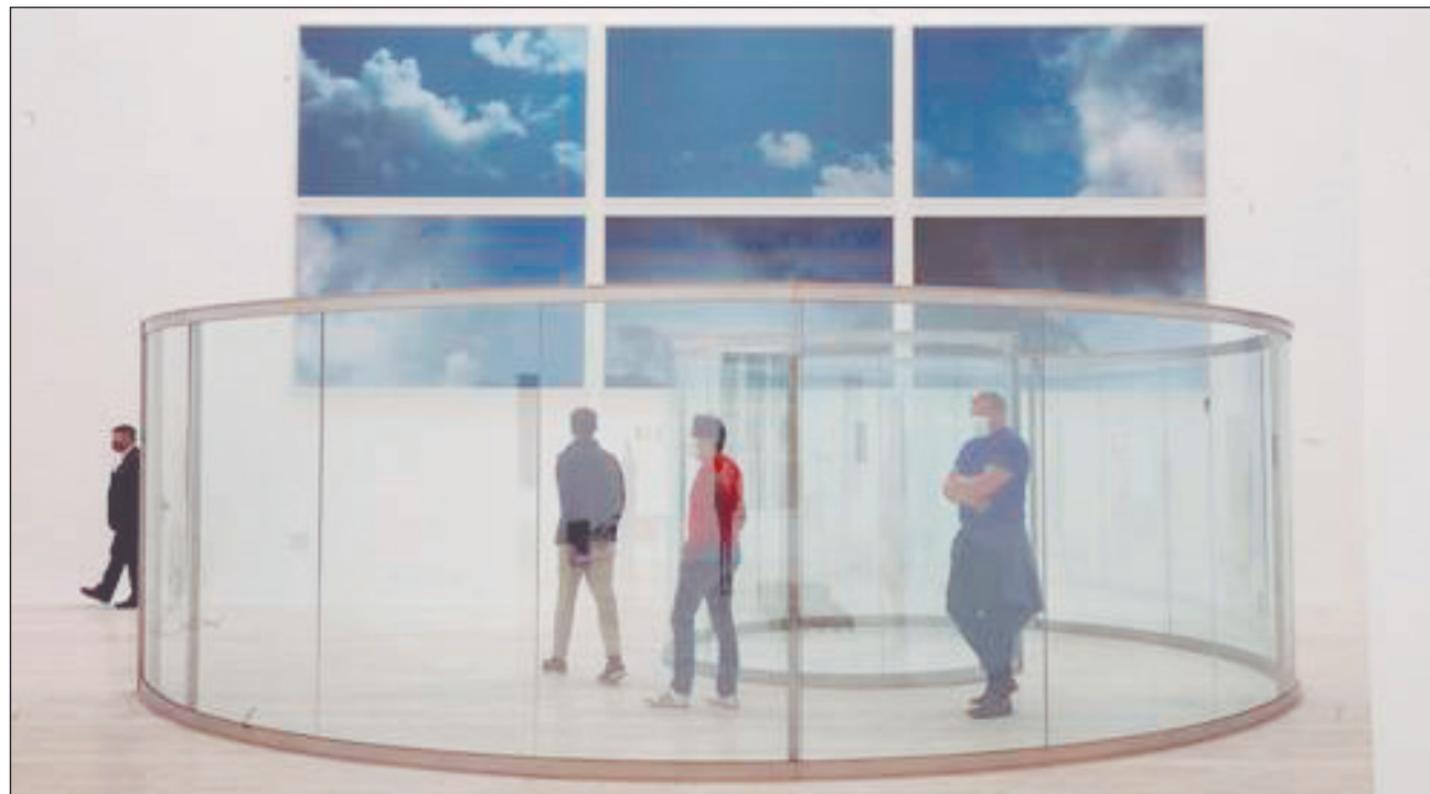
▲ Entre otras muestras, el Museo Jumex aloja Colección Jumex , topología salvaje , y Al filo de la navaja . La entrada al recinto es gratuita y así permanecerá hasta febrero.

Se presenta, entre otras, la exposición Colección Ju-