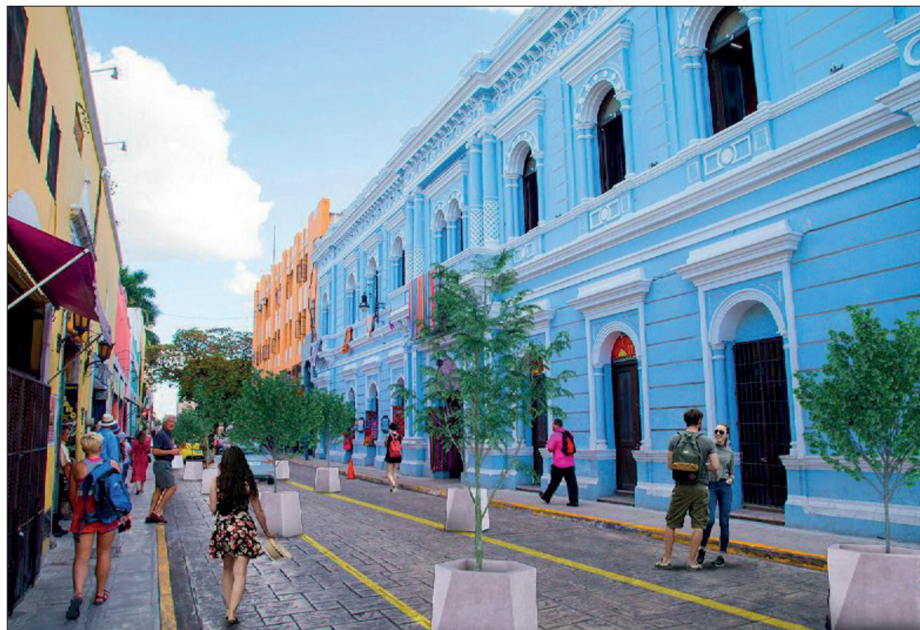
▲ La transformación del espacio urbano del centro de Mérida será para saldar una deuda histórica con los usuarios del transporte público, según indicó el gobernador Mauricio Vila.