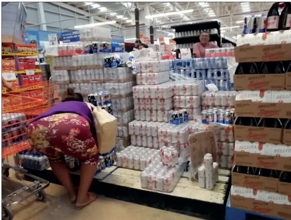
▲ Es increíble que tanta gente pagó hasta mil 200 pesos por una plancha de Tecate y aduce no tener para cambiar sus placas.

Veo al personal sin instrucciones precisas, sin menú, ahora ofrecen sólo huevos motuleños y si quiere algo más "aquí le dejo el código de barras para que lo escanee y decida, frutas se las debemos por que..." y así una lista de inconvenientes por culpa de la pandemia, ¡todo es culpa de la maldición veinte-veinte, señores! Y, ¿nosotros, nuestra actitud, nuestra alegría por servir? En cada restaurante hay un sombría sensación de acudir a una funeraria: cabeza gacha, hombros hundidos, no hay música, no cantan las tazas al roce de los cucharas. Pienso que cinco o seis meses de retiro en casa nos hicieron mucho daño, entiendo la desesperación