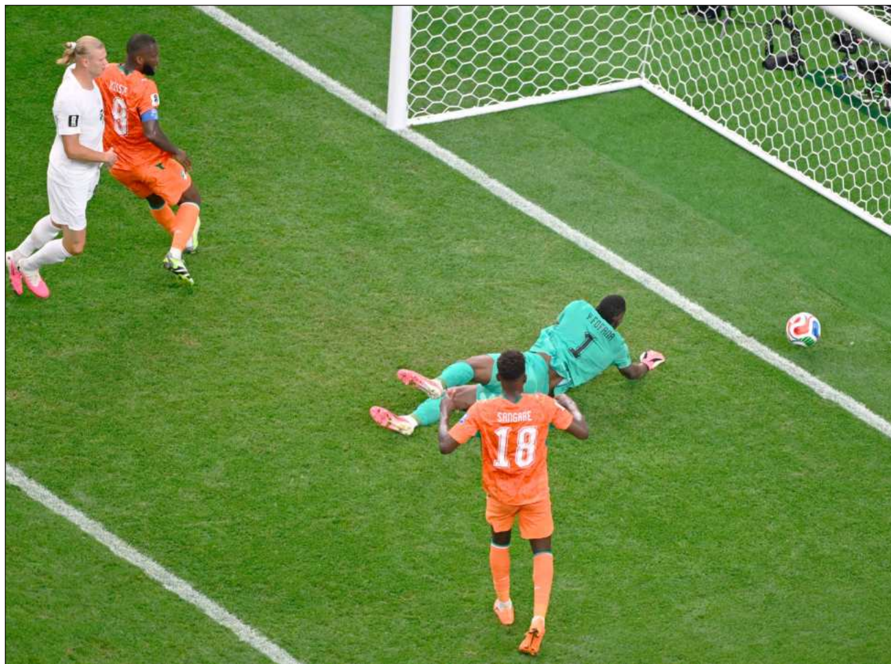
▲ “Esto es increíble. Esto es historia”, aseguró el delantero noruego Erling Haaland, quien anotó el gol del triunfo.

“Hoy es el día más importante de nuestra historia”, destacó Nusa. “Todo lo que venga de ahora en adelante será todavía más grande”. “Ahora queremos disfrutar esta victoria y en los próximos días