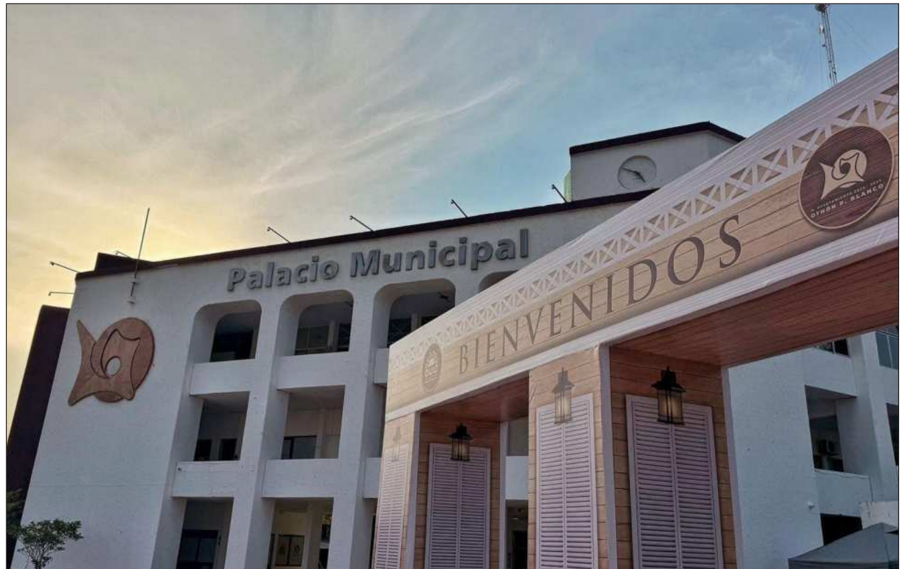
▲ Los financiamientos pueden llegar a los 120 mil pesos, diseñados específicamente para el fortalecimiento de micro-negocios, permitiendo la compra de herramientas o la remodelación de locales comerciales.

Los esfuerzos buscan que las empresas hallen un entorno favorable para establecerse de manera permanente