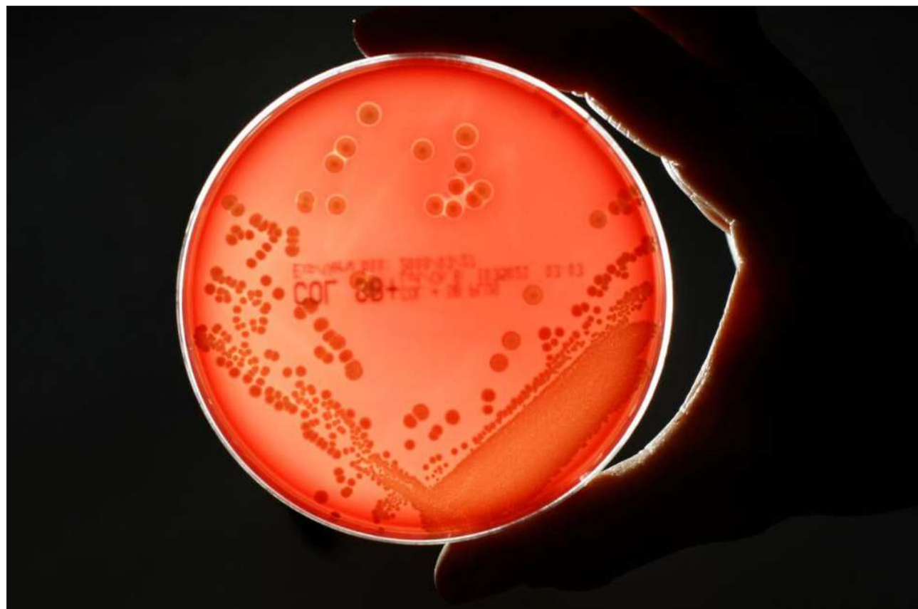
▲ El antibiótico se adhiere a una zona del ribosoma, maquinaria que fabrica las proteínas que necesita la bacteria para vivir.

Así lo reveló un estudio publicado en la revista Nature , en el que se detalla que el nuevo antibiótico, llamado manikomicina, se adhiere a una zona del ribosoma -la maquinaria que fabrica las proteínas que necesita la bacteria para vivir-, y bloquea ese proceso, de tal forma que los microorganismos dejan de producir proteínas esenciales para crecer y sobrevivir.