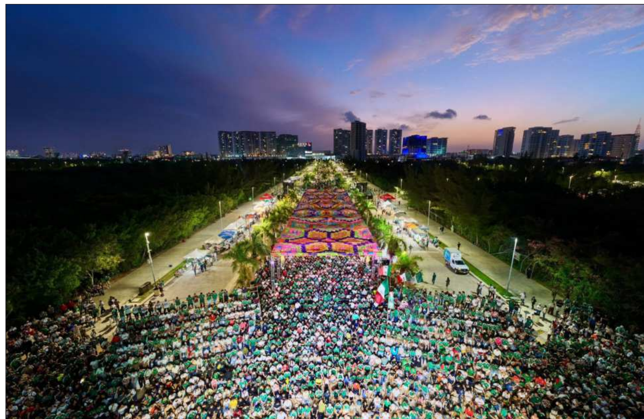
▲ La gran afluencia de asistentes al Fut Fest en Malecón Tajamar ha beneficiado a los comercios locales, impulsando una economía circular que apoya a las familias benitojuarenses en un ambiente de sana convivencia.

“Es un poco difícil contabilizarlo, también por el tema de los partidos, pero sí ha llegado alrededor de como el 15 o el 20 por ciento de turistas. Más que turistas, lo mencionaba mucho, que