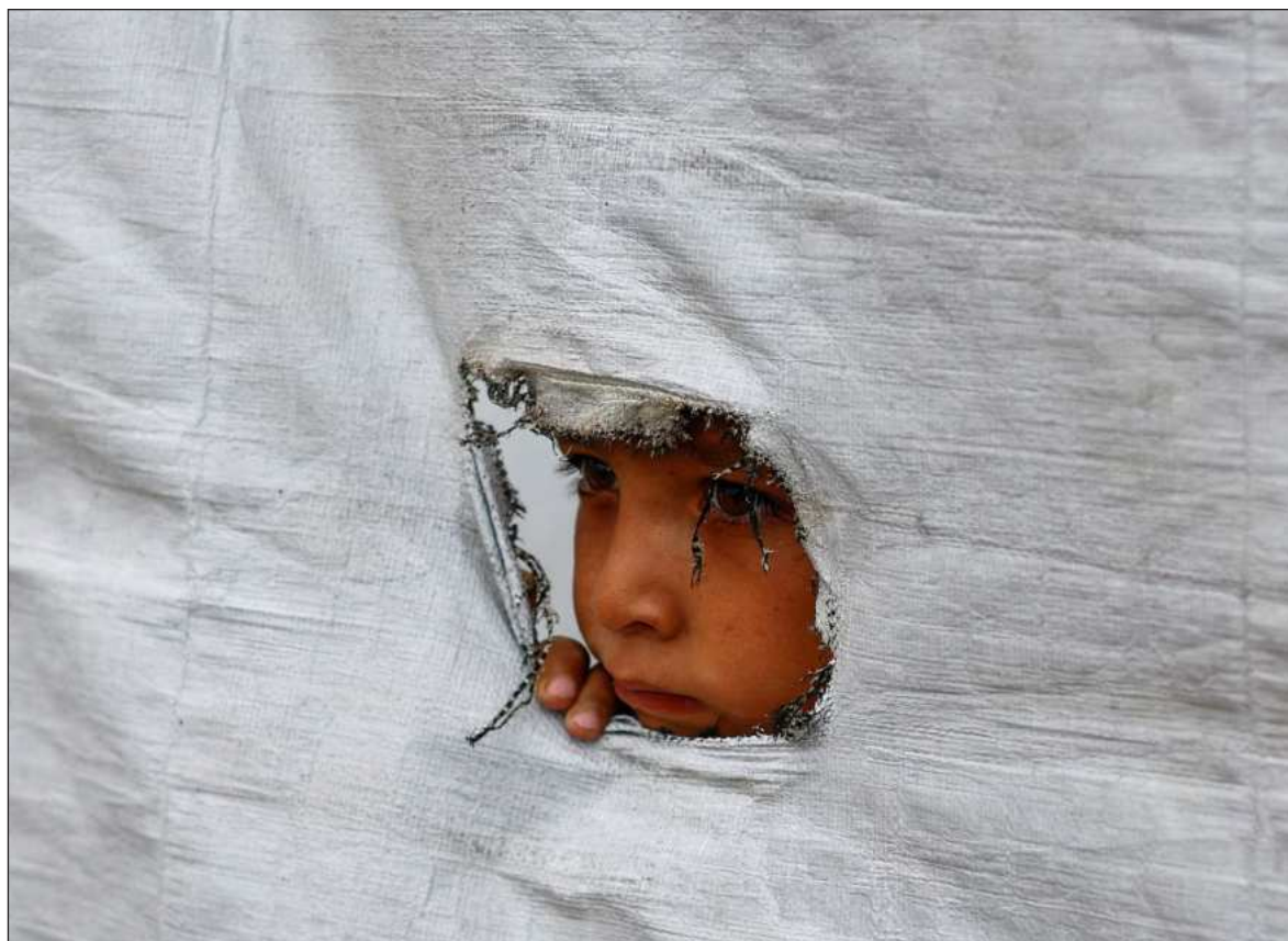
▲ “Al menos, 20 mil 179 infantes palestinos murieron y 44 mil 143 resultaron heridos de 2023 a 2025”.