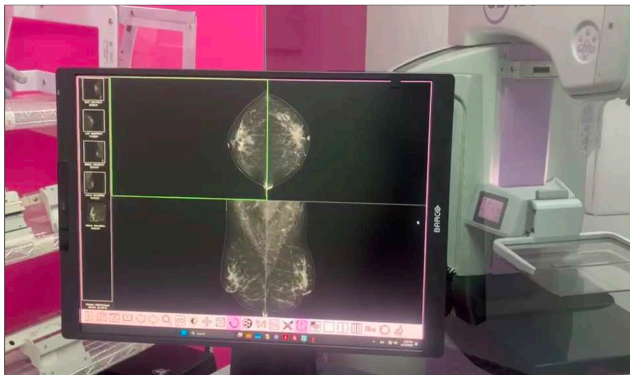
▲ El mastógrafo permitirá obtener imágenes de mayor calidad en menos tiempo y brindar una atención más ágil.

El equipo incorpora un sistema avanzado para la realización de biopsias de mama