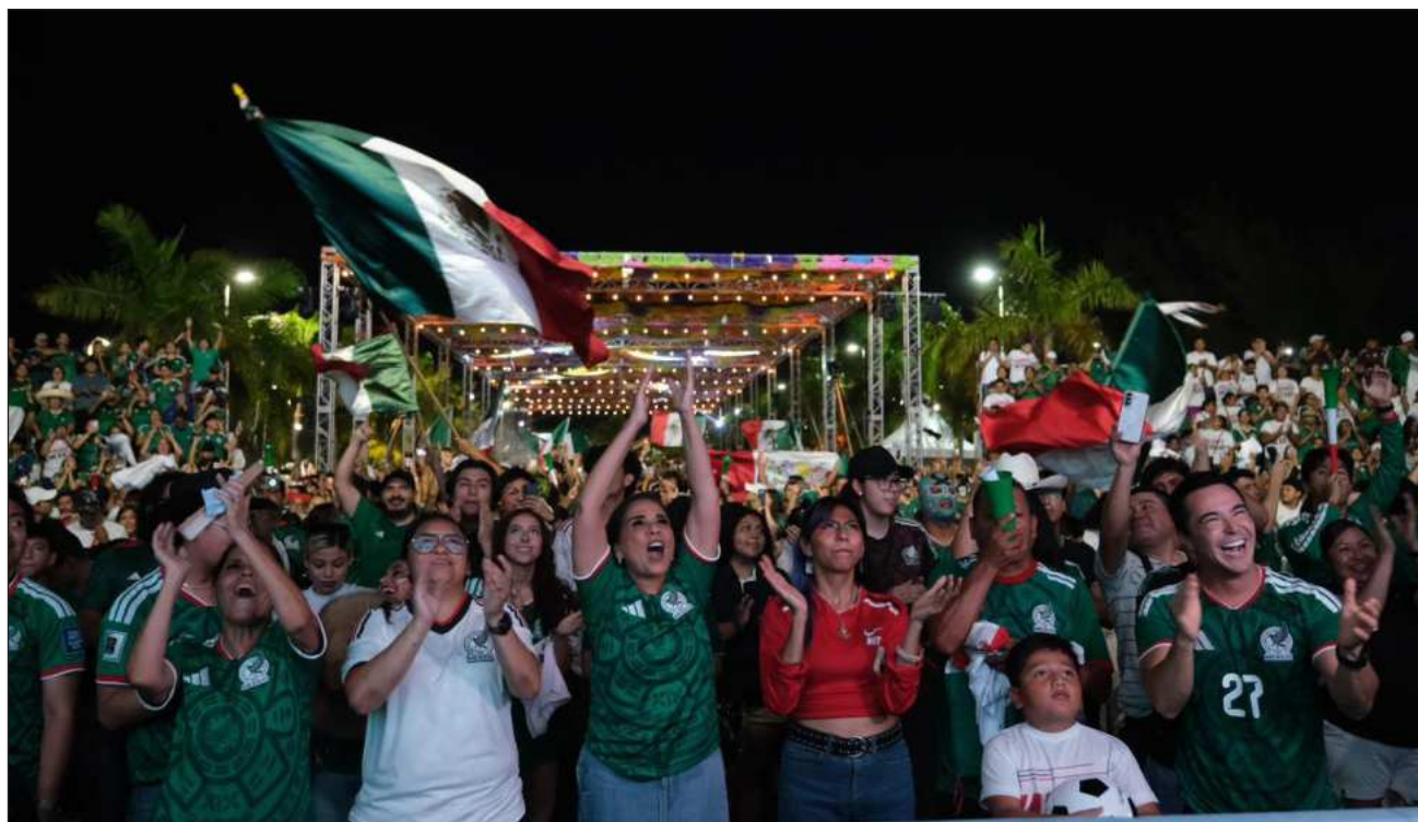
▲ Con este resultado, México avanzó a la siguiente fase, donde podría enfrentar a la selección de la República Democrática del Congo o a Inglaterra. El próximo partido se disputará en el estadio Azteca este 5 de julio.

Aunque el silbatazo inicial se retrasó cerca de una hora debido a las condiciones climatológicas, los asistentes permanecieron en los Fut Fest instalados en diferentes puntos de la entidad con el ánimo intacto, esperando el arranque del encuentro para apoyar al representativo nacional.