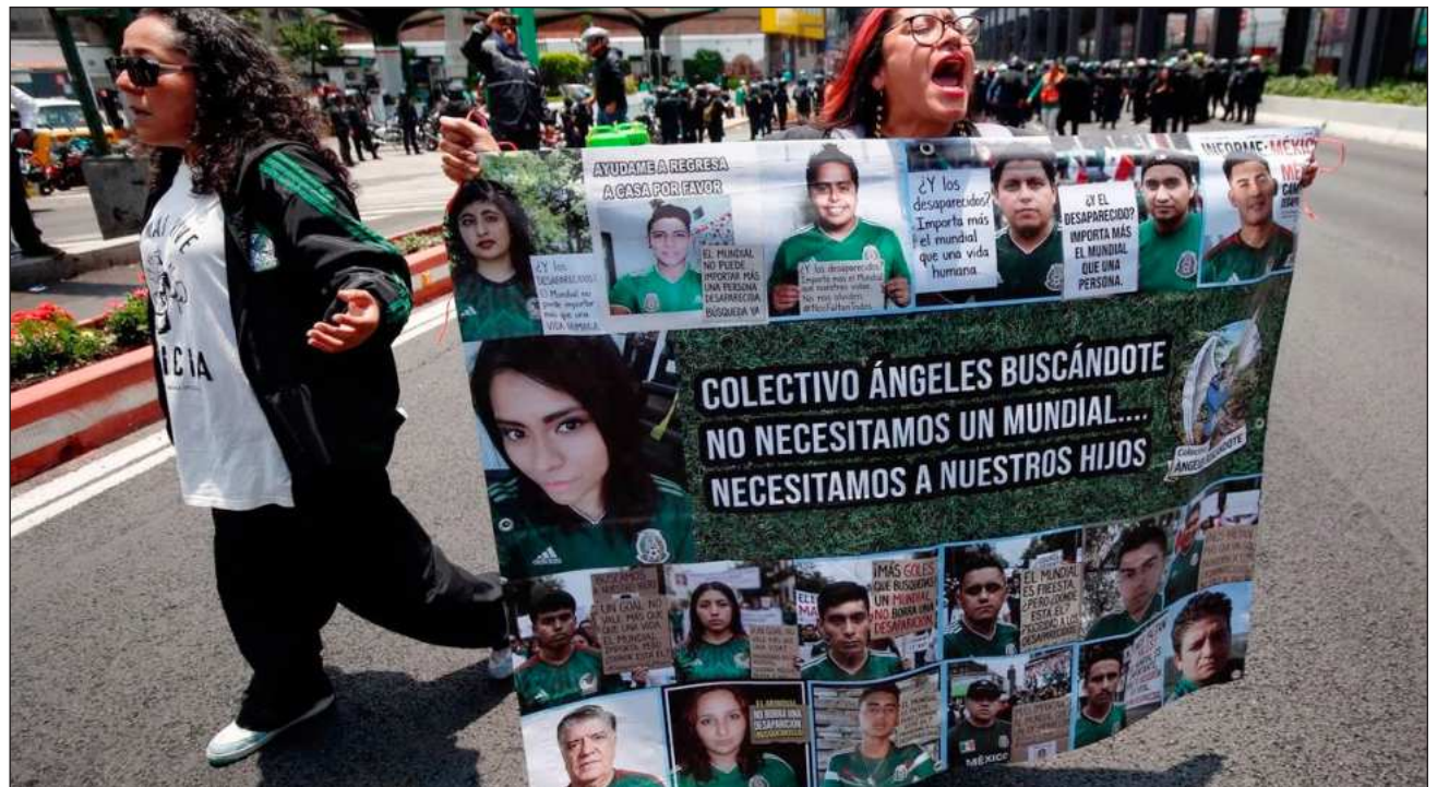
▲ Durante la protesta en Tlalpan, entre cumbias, algunos de los activistas bailaron y realizaron una cascarita.

Algunos manifestantes se retiraron rumbo a la Glorieta del Ahuehuete, en Paseo de la Reforma, donde más tarde realizarían una conferencia de prensa para denunciar “las agresiones” durante los intentos de repliegue por parte de elementos de la policía capitalina. Se prevé igualmente que organicen la tradicional cascarita futbolera.