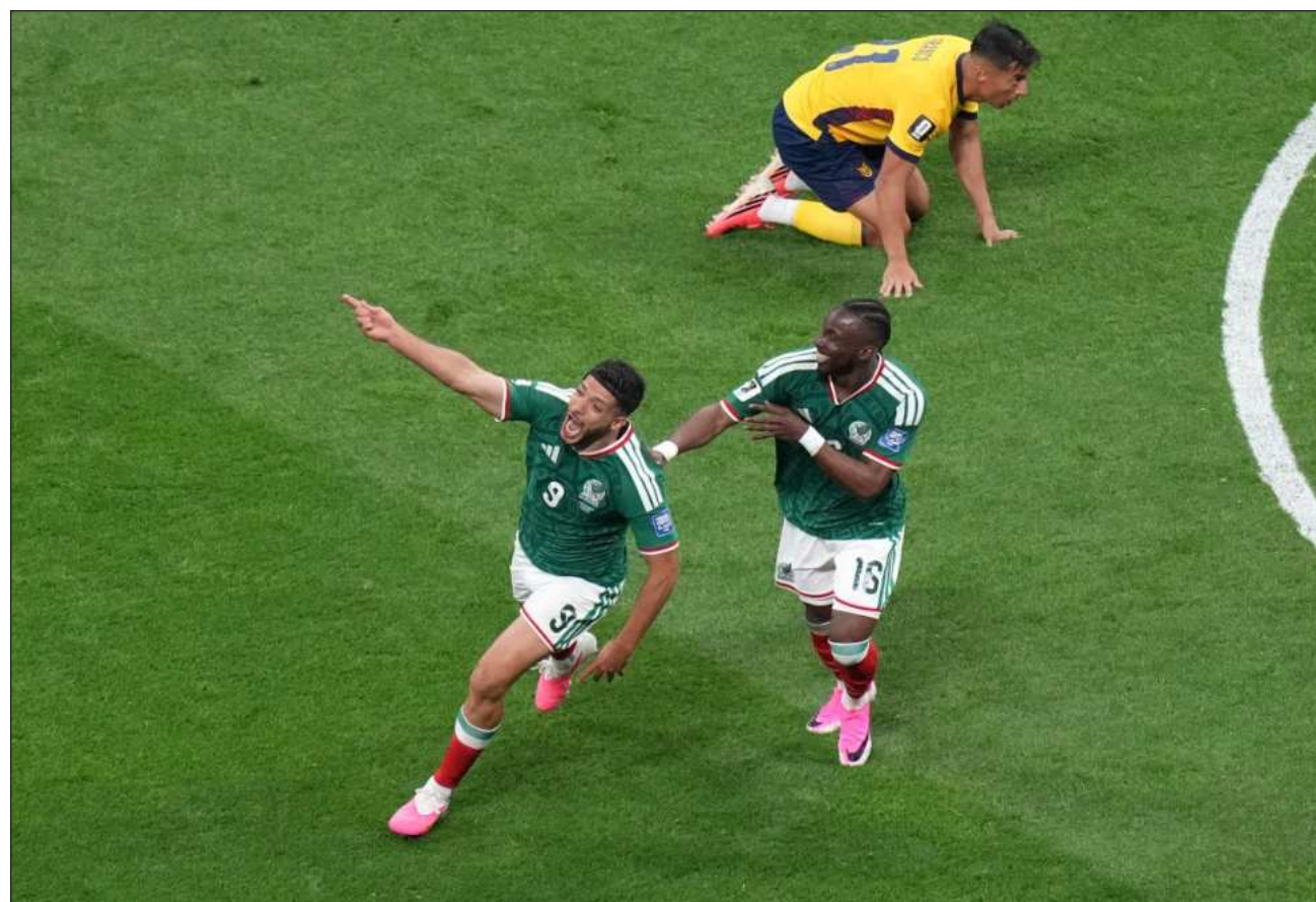
▲ En la segunda mitad, los mexicanos lograron controlar el resultado hasta el silbatazo final y administrar la tensión.

México se enfrentará en los octavos de final al ganador del cruce entre Inglaterra y Congo, que se medirán el miércoles en Atlanta.