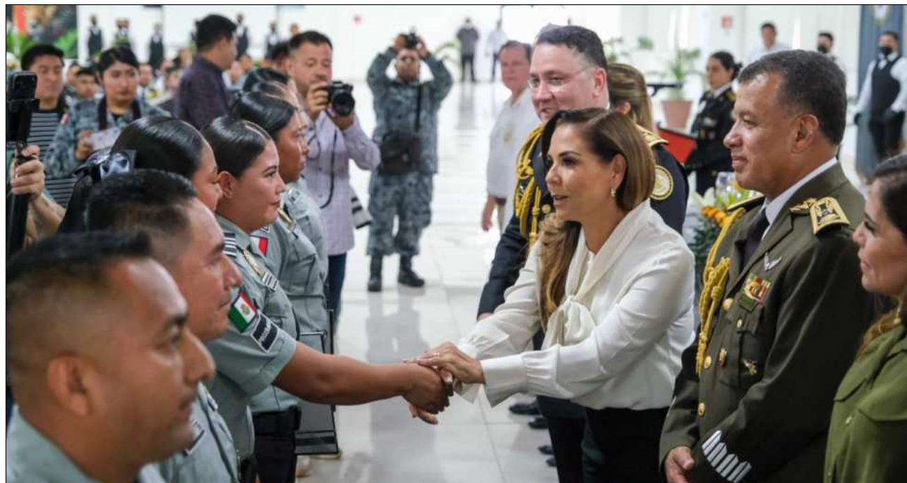
▲ La gobernadora Mara Lezama participó en la entrega de reconocimientos a 20 integrantes de la Guardia Nacional por su labor ejemplar al servicio de México, al tiempo que agradeció el compromiso que mantienen con la ciudadanía.

“Conmemoramos siete años de una institución que nació para responder a una de las mayores demandas del pueblo: vivir en paz. A cada mujer y a cada hombre de la Guardia Nacional, gracias por su entrega, por las horas lejos de sus familias y por proteger la vida, el patrimonio y la tranquilidad de millones de personas”, expresó.