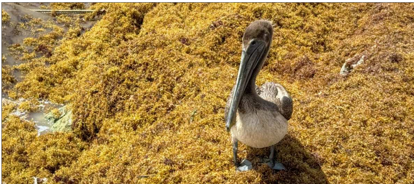
▲ “El sargazo no es un fenómeno local encarnado en una suerte de maldición contra el monstruoso desarrollo caribeño”.