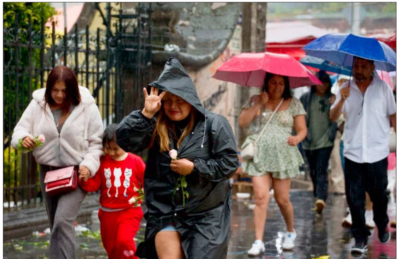
▲ Exhortan a la población a atender los avisos y seguir las recomendaciones de Protección Civil.

En su reporte también alertó que las precipitaciones podrían generar deslaves, incremento en niveles de ríos y arroyos, así como desbordamientos e inundaciones en zonas bajas de los estados mencionados, por lo que exhortó a la población a atender los avisos y