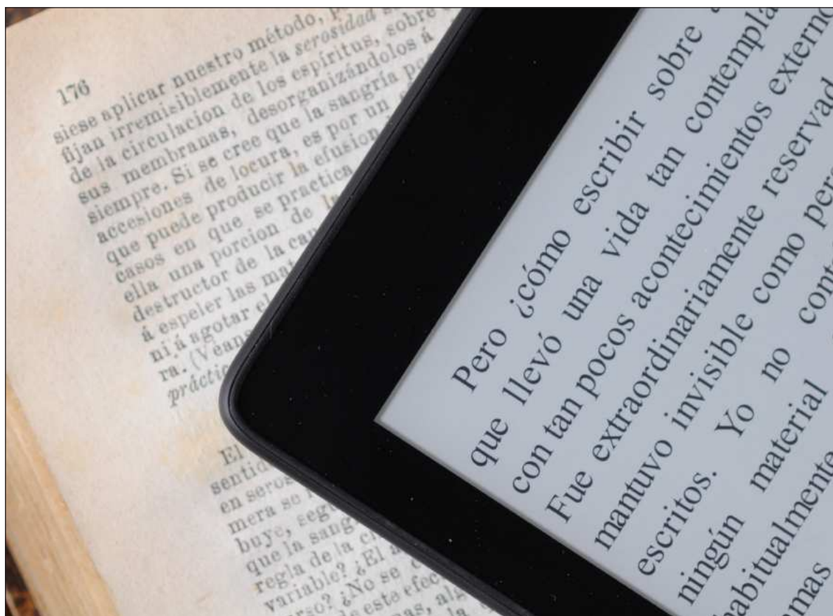
▲ “Escribir bien ha sido la vara básica con la que se ha medido el valor de un libro literario, al menos en ciertos círculos. Escribir bien, como concepto, le ha servido a esos círculos para denostar formas alternativas de articulación verbal, especialmente aquellas que exceden o retan directamente sus formas de expresión autorizadas o predilectas”.

LAS COSAS, ESO sí, se pondrán interesantes.