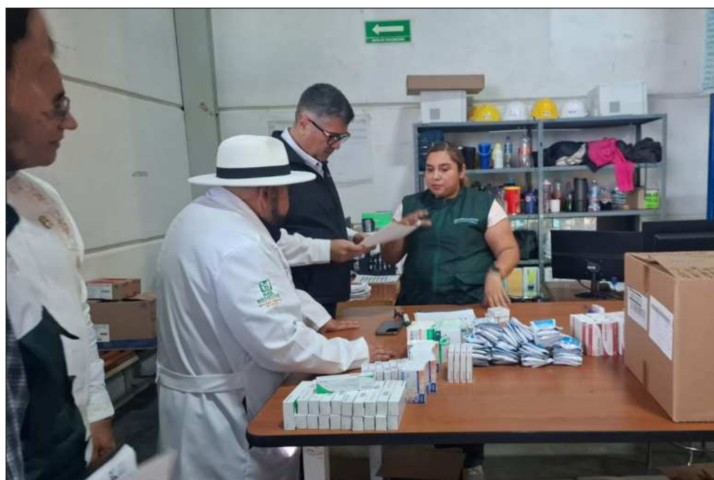
▲ La lista incluye medicamentos oncológicos y uno de los temas sensibles antes de la pandemia, que la oposición pretendió politizar, fue el de la falta de tratamientos para niños con cáncer.

Esto es jugar con la salud de los mexicanos, pues el hallazgo de millones de piezas de medicamentos en un solo nosocomio lleva a pensar inmediatamente en qué ocurre en todo el sistema público de salud. El hallazgo en el Hospital Infantil de México Federico Gómez debe llevar a una revisión tanto en el ISSSTE como en el sistema IMSS -Bienestar. Porque lo que queda demostrado es que el presupuesto de adquisiciones se ejerce, pero si existe dolo para que los fármacos no lleguen a quienes lo necesitan, es hasta una apuesta macabra que arriesga innecesariamente a la población. La Secretaría Anticorrupción y Buen Gobierno tiene la palabra.