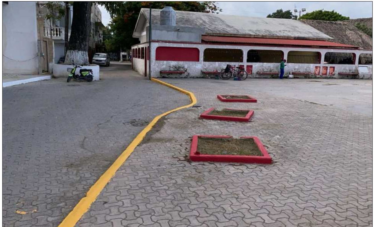
▲ El colectivo surgió como respuesta a la situación que enfrenta actualmente Tulum y tiene como objetivo exigir un gobierno transparente, eficiente y comprometido con el bienestar de la población.

Los integrantes señalaron que el movimiento reúne a diversos sectores de la sociedad, incluyendo representantes del movimiento Playas Libres, propietarios de negocios y vecinos de distintas zonas del municipio, con la finalidad de trabajar de manera pacífica y propositiva en favor de un Tulum "justo, transparente, sostenible y próspero para todos".