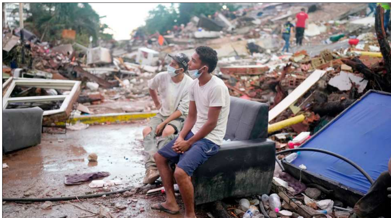
▲ De acuerdo con Carlotta Wolf, portavoz de la agencia de ONU para refugiados, los venezolanos que quedaron sin hogar de forma repentina están durmiendo en autos, parques y otros lugares sin que haya refugios de emergencia adecuados disponibles.

Funcionarios venezolanos afirman que más de 15 mil personas se han visto afectadas por los terremotos —una cifra que refleja el número oficial de desplazados—, se-