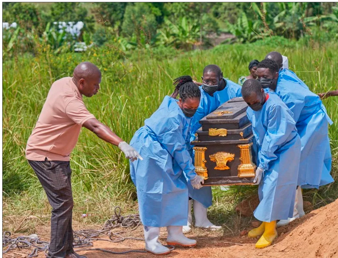
▲ RDC instó a la población a seguir aplicando las medidas de prevención y, limitar los contactos de riesgo y basarse sólo en la información difundida por las autoridades sanitarias, al destacar que “los rumores ponen en peligro vidas”.

El gobierno instó a la población a seguir “aplicando las medidas de prevención: