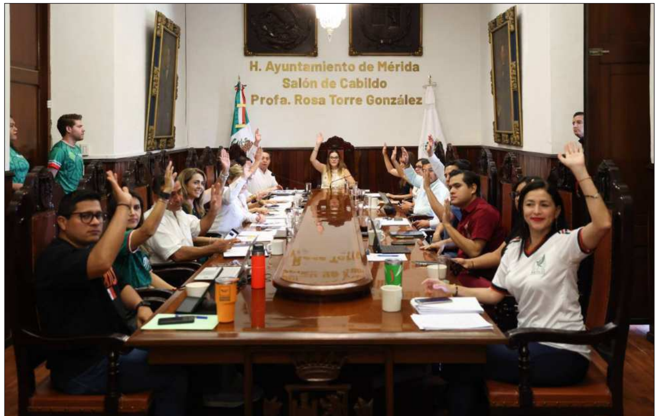
▲ Dentro de la misma aprobación de licitaciones se contemplan los parques de Las Américas Internet, Lindavista II y Juan Pablo II, así como la rehabilitación y construcción de calles, drenajes pluviales y acciones de vivienda.

Entre las acciones aprobadas también se realizarán trabajos en el área de pescados del Mercado Lucas de Gálvez