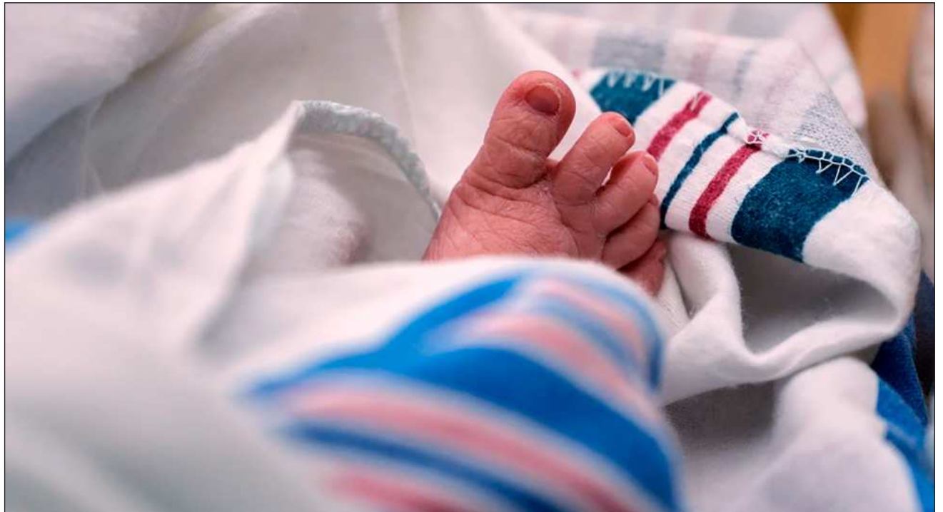
▲ El fallo ratifica más de un siglo de precedentes legales, incluido el caso histórico de 1898 Estados Unidos contra Wong Kim Ark, que estableció que la 14ª Enmienda otorga la ciudadanía a prácticamente todos los nacidos en el país.

La Suprema Corte de Estados Unidos rechazó la orden ejecutiva del presidente Donald Trump que intentaba redefinir la cláusula de ciudadanía por derecho de nacimiento de la 14 Enmienda, la cual habría negado la ciudadanía a los niños nacidos en Estados Unidos de padres que se encontraban en el país de forma ilegal o temporal.