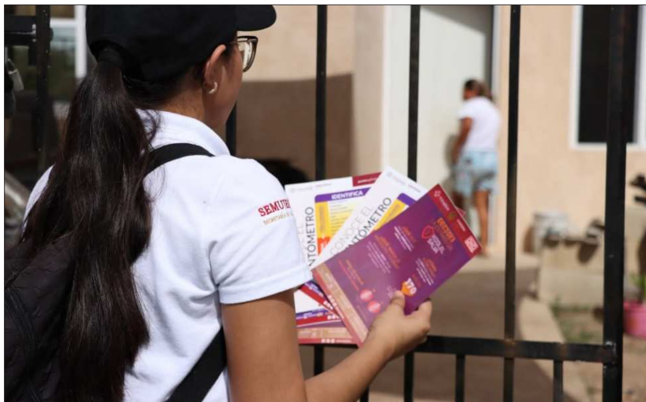
▲ Para acceder a este apoyo, las mujeres deberán ser mayores de edad, acreditar una situación de violencia extrema y no contar con ingresos o percibir hasta un salario mínimo diario. El programa podrá beneficiar a quienes no cuenten con una vivienda segura.

La Secretaría dará a conocer la convocatoria para acceder a este programa a través de sus cuentas oficiales, en la página mujeres.yucatan.gob.mx/ y redes sociales.