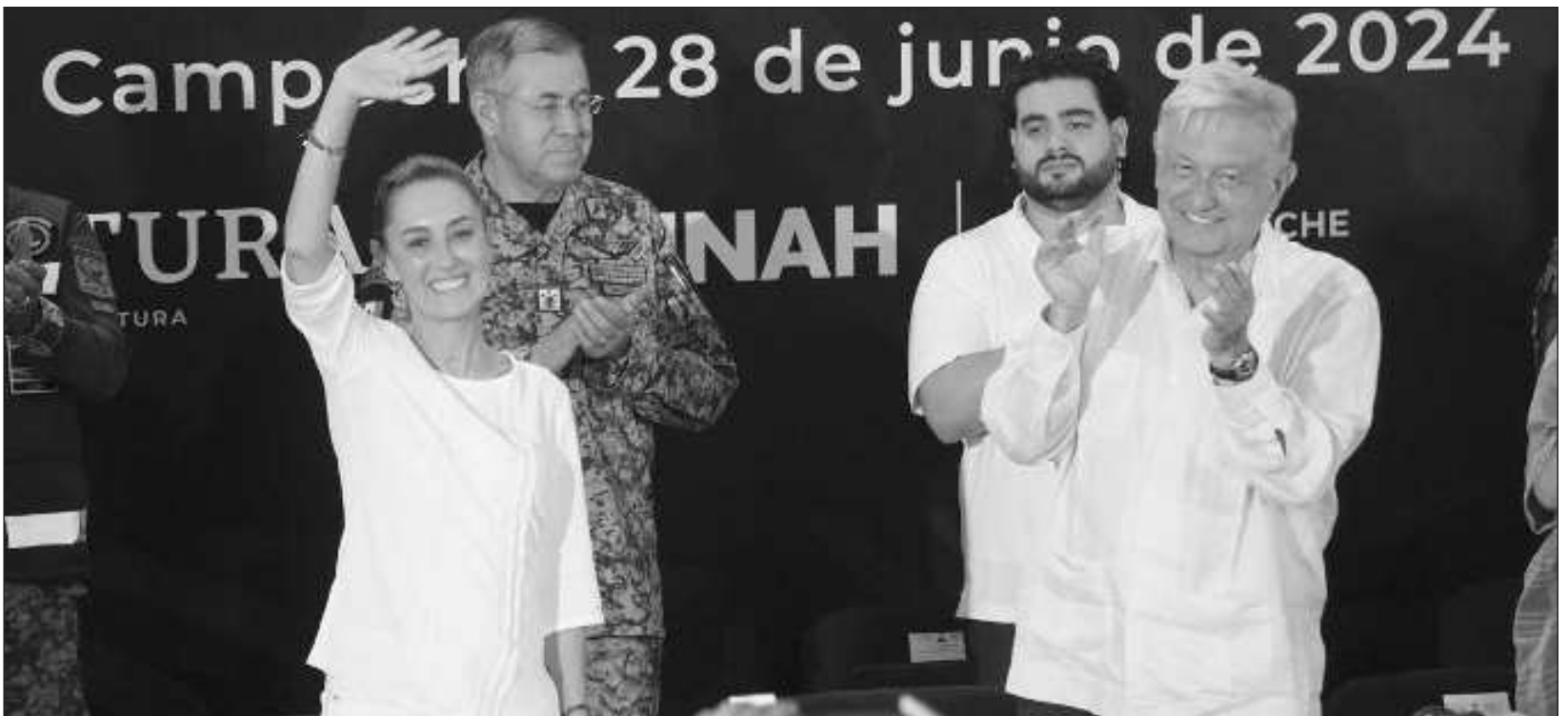
▲ La virtual presidenta electa informó sobre las actividades para constatar los avances, y definió al Tren Maya como una obra que representa “una hazaña histórica”.