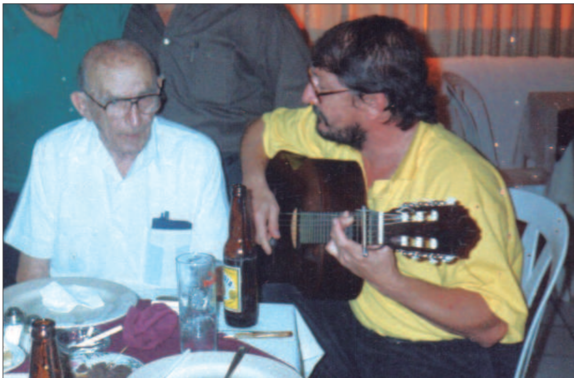
▲ La amistad que unió y sigue uniendo a estos dos grandes de la música yucateca que han aportado tanto a las culturas, trasciende el tiempo. En la imagen, departen y comparten en algún bar de Mérida.

Ya con café en mano me preguntó: “¿Y qué vamos a hacer?”; “pues, lo que tú quieras” - le respondí. “¡Pues, vamos! ¡Pues sí, vamos!”. La verdad que eso de andar tocando para políticos a mi compadre no le gustaba y a mi menos; pero, bueno, era chamba. Embriagados del aroma del café y la entretenida plática, de la nada salía a la luz otro de nuestros rituales: “Compadre, sabes que lindo está sonando la Pocaropa . ¿En serio? pregunté. “Deja la traigo para que la oigas”. Con su arrastradito andar fue a buscar una de sus guitarras, este instrumento era muy peculiar porque era excesivamente ligero, casi no pesaba, de madera muy delgadita, por eso el nombre de Pocaropa . De regreso me entregó la guitarra y sentenció: “Oíla, siéntela, ¡está divina!”. Toco algunos acordes y la siguiente parte del ritual era la pregunta: ¿Te acuerdas de aquella canción? Esa de: (y cantaba) “Dime que ya eres libre como es el viento” y le brillaban los ojitos de niño travieso que siempre tuvo. “¿Te acuerdas?” “Claro que me acuerdo, cántala” ¿Me haces segunda? (le decía, a sabiendas de que se enojaría): “¿Qué?, mira hijueputa compadre, yo no hago segunda, yo hago dúo, que te quede claro: cántale... Y nos arrancába-