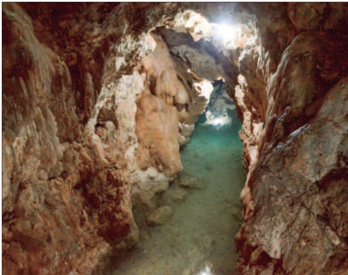
▲ “La gobernanza del agua fomenta la cooperación entre organizaciones involucradas con los servicios hídricos entre distintas esferas para abordar la complejidad del sector, superando los obstáculos”.

EN DICHO SENTIDO, la gobernanza del agua fomenta la cooperación entre organizaciones involucradas con los servicios hídricos entre distintas esferas para abordar la complejidad del sector, superando los obstáculos mediante la aplicación de reformas, políticas del agua efectivas y otras acciones no estatales que aseguren el derecho humano al agua y al saneamiento. En efecto, la Organización para la Cooperación y el Desarrollo Económicos (OCDE) ha desarrollado un marco metodológico para analizar la gobernanza del agua mediante la incorporación de tres pilares: efectividad, eficacia, y confianza y participación,