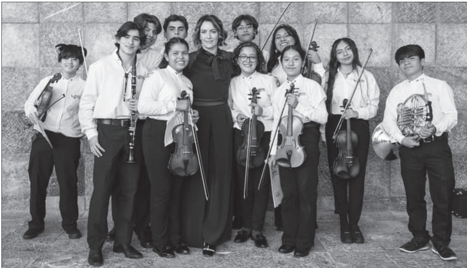
▲ “Con la misión de promover y difundir las obras de jóvenes compositores y solistas del continente. Siempre estuvo muy vinculada con la educación y con la orquesta emprendió un importante programa educativo para las escuelas públicas del Bronx en Nueva York, así como con orquestas infantiles durante sus giras por México”.