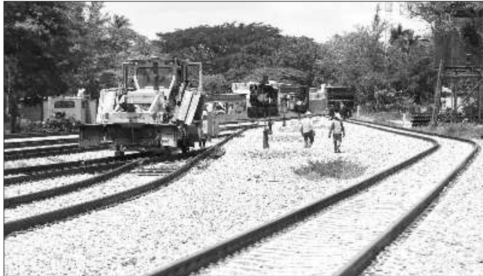
▲ La franja industrial que pretende crearse, recibirá en un punto materia prima y a su paso por el estrecho continental se transformará en otro producto “con mayor valor agregado”.

Pensar en el CIIT como una competencia al Canal de Panamá resulta reduccionista, explican funcionarios durante un recorrido por algunas obras que lo componen. Su objetivo no se ciñe a ser un paso de mercancías desde Asia hacia la costa este de Estados Unidos, sino de ubicar, a lo largo de una franja de más de 3 mil hec-