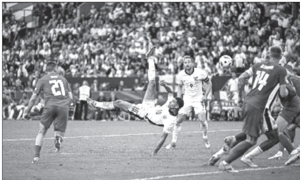
▲ Jude Bellingham marca el gol que le dio vida a Inglaterra en Gelsenkirchen.

Ivan Schranz marcó en la primera mitad para darle a Eslovaquia el gol que parecía sería suficiente para eliminar a los ingleses, que llegaron al torneo como favoritos tras disputar la final en la última edición.