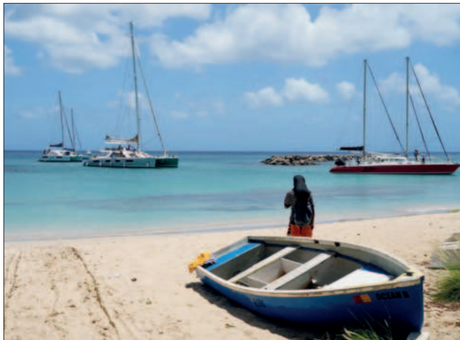
▲ El huracán Beryl "por el momento no representa peligro para el territorio mexicano", señaló más temprano el Servicio Meteorológico Nacional.

En Bridgetown, la capital de Barbados, autos hacían fila en las gasolineras, mientras que los supermercados y tiendas de comesti-