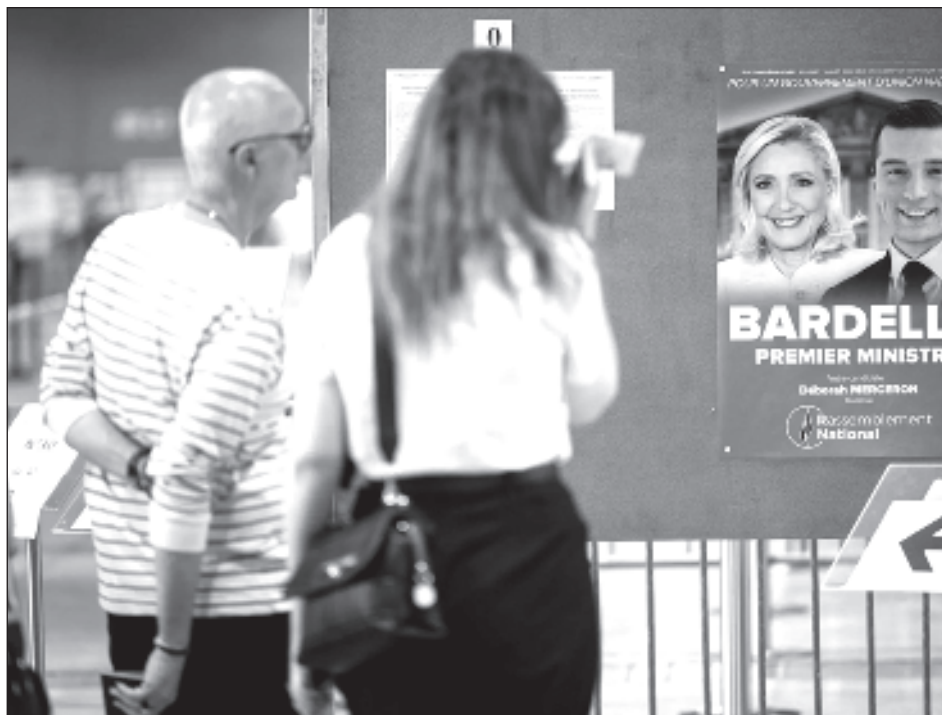
▲ Agrupación Nacional y sus aliados lograrían alrededor de 33% de votos, pero deberán esperar a la segunda vuelta del 7 de julio para saber si alcanzan la mayoría absoluta.

La llegada al poder de la extrema derecha, por primera vez desde la Liberación de Francia de la ocupación de la Alemania nazi en 1945, sumaría un nuevo país en la Unión Europea (UE) gobernado por