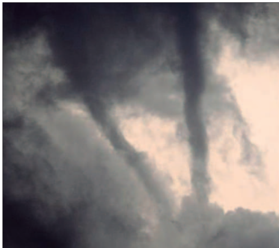
▲ Según su origen, los tornados se pueden clasificar en dos tipos: superceldas, que se crean de una tormenta severa de larga duración; y los no superceldas que son menos fuertes.

Explicó: "Un tornado se define como una columna de aire que rota violentamente en contacto con la superficie de la Tierra, por debajo de una nube cumuliiforme (nube aislada de base horizontal con desarrollo vertical y que adopta formas de montañas de algodón), y a menudo (pero no siempre) visible como un embudo".