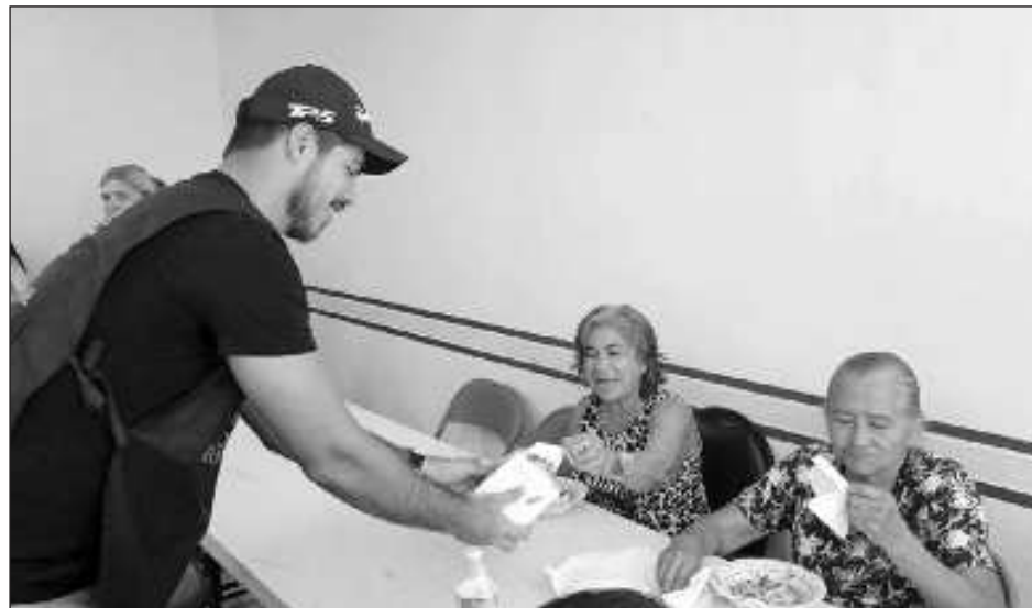
▲ El Club Rotary consiguió la donación de un terreno de 2 mil metros para construir una hacienda en la que puedan vivir estas 150 personas.

Lo que sigue ahora, dijo, es la limpieza del terreno, la nivelación de curvas y empezar con la campaña de compilación de materiales, para beneficiar a 150 abuelitos que viven en la comunidad de Leona Vicario, perteneciente al municipio Puerto Morelos.