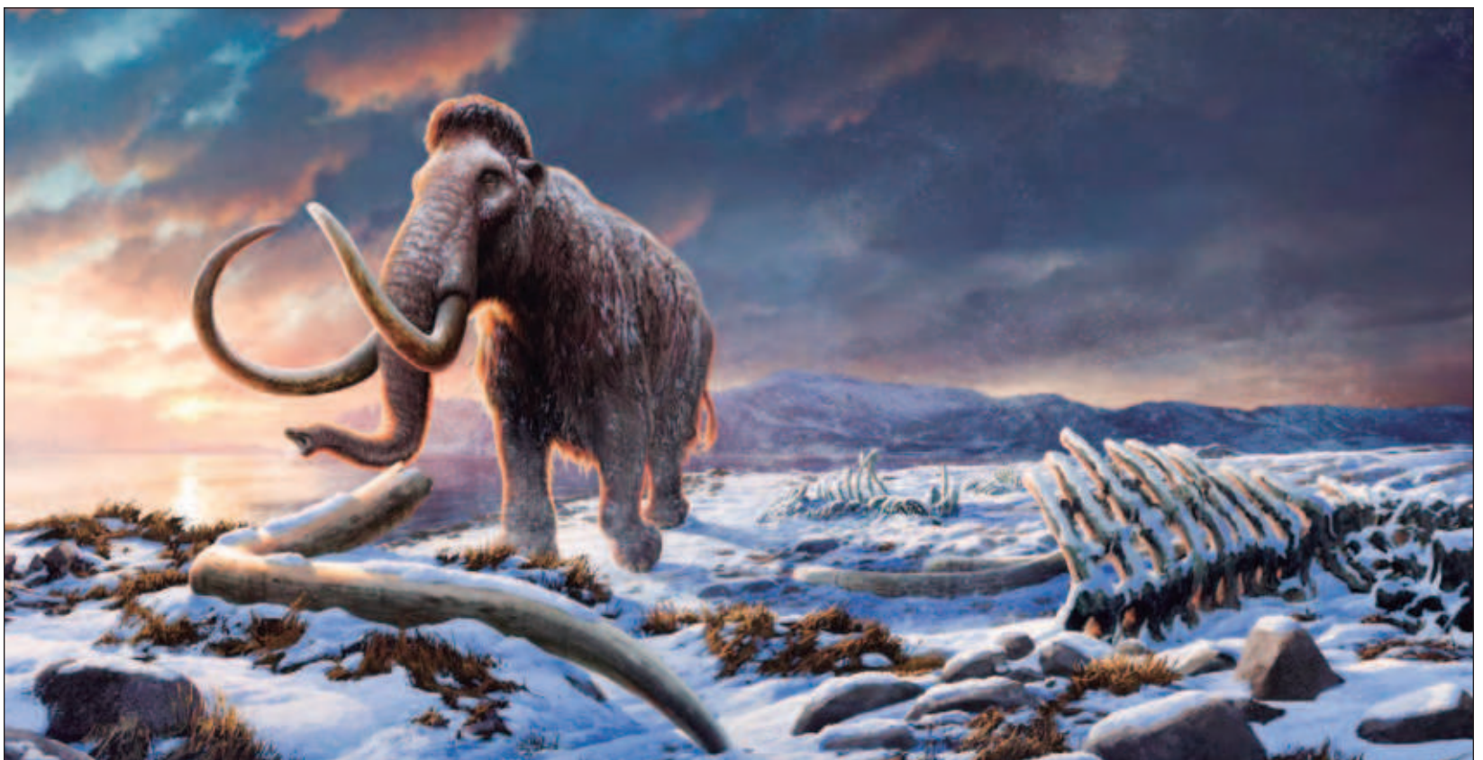
▲ Un nuevo análisis genómico revela que los mamuts aislados, que vivieron en la isla Wrangel, frente a la costa de Siberia, durante los siguientes 6 mil años se originaron a partir de un máximo de ocho individuos, pero crecieron hasta entre 200 y 300 durante 20 generaciones.

Los genomas de mamut analizados abarcan un largo periodo; sin embargo, no incluyen los últimos 300 años de existencia de la especie. “Lo que ocurrió al final sigue siendo un misterio: no sabemos por qué se extinguieron después de haber estado más o menos bien durante 6 mil años, pero creemos que fue algo repentino”, subraya Dalén.