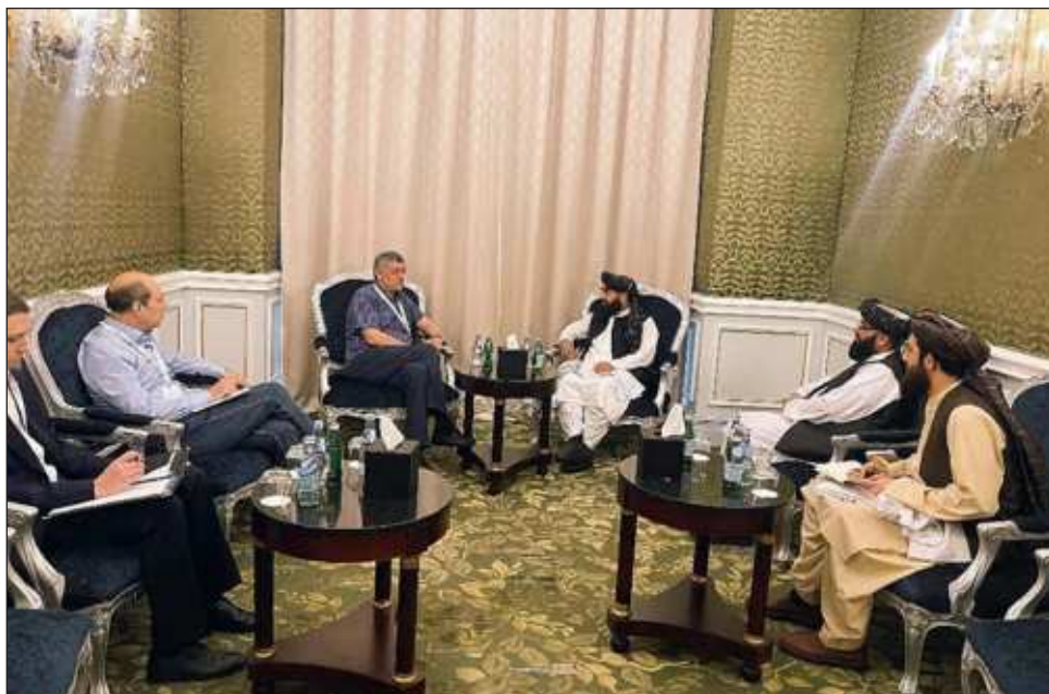
▲ Uno de los portavoces puntualizó a la prensa que ya se "han comenzado las conversaciones preparatorias, y la ONU se ha reunido por separado con muchos de los enviados especiales presentes y con representantes talibanes".

La condición se cumplió en esta ronda y los representantes de la sociedad civil fueron excluidos. Estos participarán en otras reu-