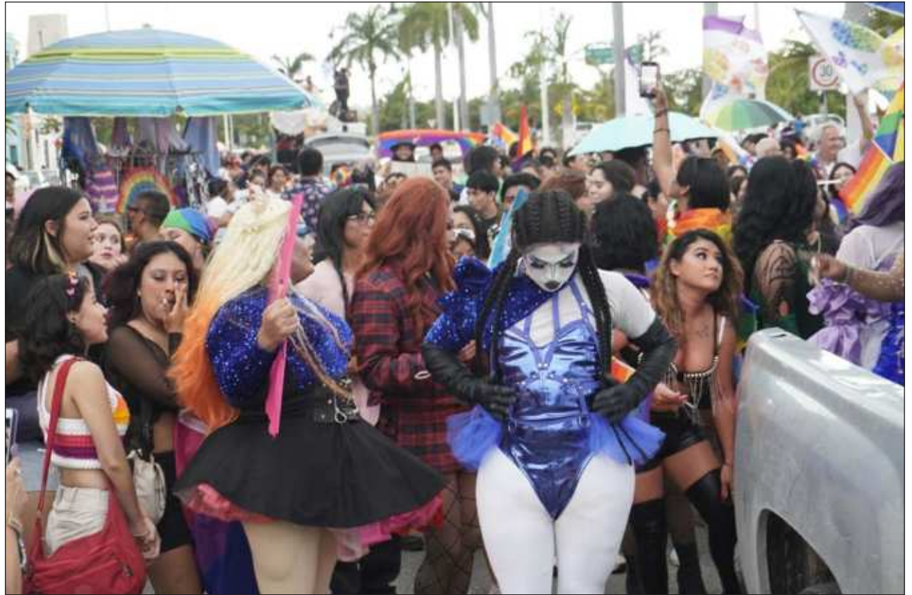
▲ Algunos de los participantes en la marcha del orgullo LGBTTTIQ+ que se realizó este fin de semana en el estado de Campeche, lamentaron que aún hay gente que los ve como si fueran parte de un carnaval.

Por condiciones de salud no participaron de los personajes más irónicos de la comunidad, otros no quisieron caminar bajo la lluvia pues había un pronóstico desfavorable e este sentido,