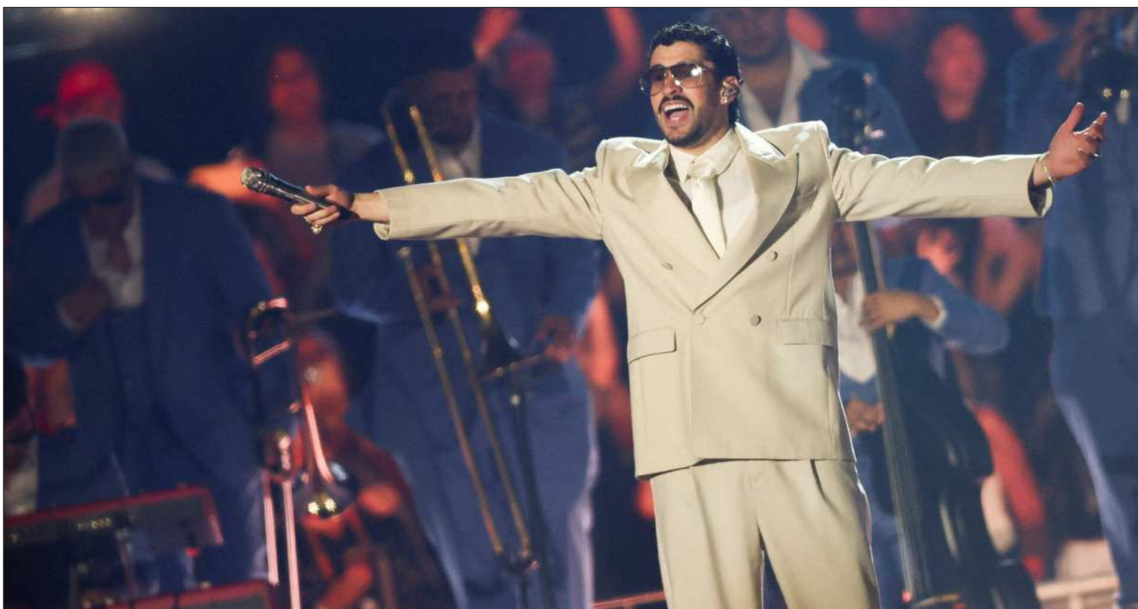
▲ La investigación califica a Bad Bunny como “embajador imperfecto” del español: no difunde la lengua porque se lo proponga de modo explícito.

Sin embargo, no todos los oyentes de Bad Bunny son hispanohablantes. Aunque 77.9 por ciento de su audiencia se concentra en Latinoamérica y España, y 20.4 por ciento en Estados Unidos, canciones como DtMF (íntegramente en español) se registran en 34 países, incluyendo Alemania, Francia, Italia, India, Japón, Corea del Sur, China, Reino Unido y Canadá, lo que demuestra una circulación global autónoma sin necesidad de un “puente anglosajón”.