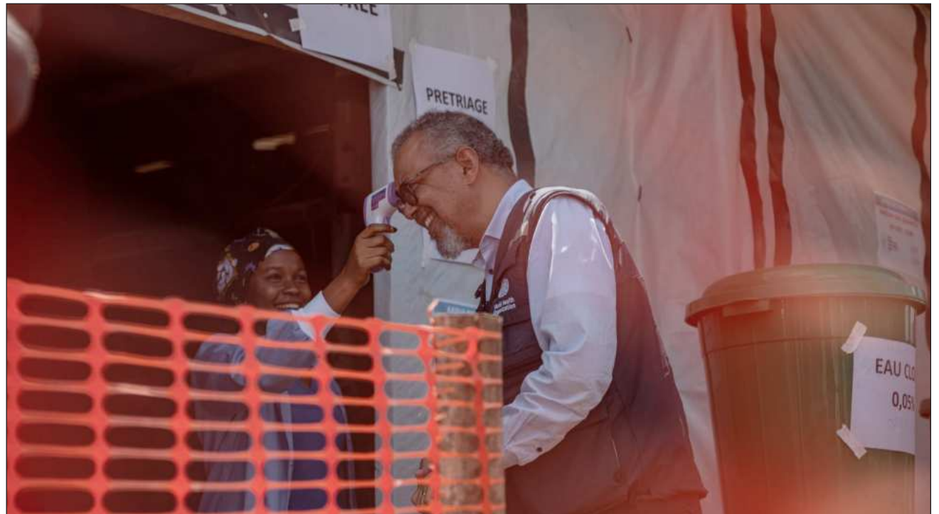
▲ La organización sanitaria indicó que las cifras oficiales más recientes mostraban 906 casos sospechosos y 223 muertes sospechosas.

La OMS informó el viernes que un paciente se ha