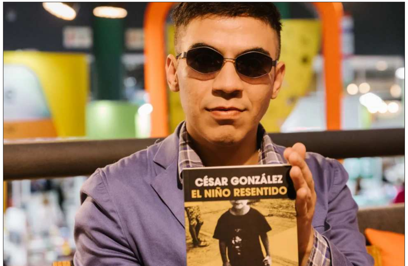
▲ La preocupación a la hora de retratar la marginalidad era intentar emular un lenguaje ajeno en la literatura.

La preocupación principal a la hora de retratar la marginalidad en Argentina pasó muchas veces por intentar emular un lenguaje que le es ajeno en la literatura y en las pantallas; en ocasiones, los guionistas y escritores compensaron su desconocimiento por el mundo popular exagerando sus usos y costumbres.