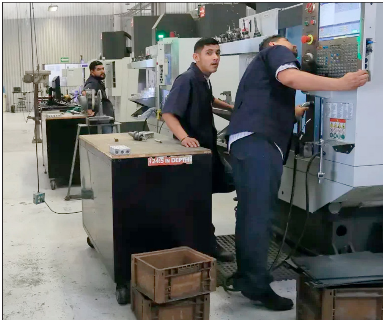
▲ Vertical Kits y Grupo Moyel usaron a sus guardias de seguridad para notificar la baja del personal.