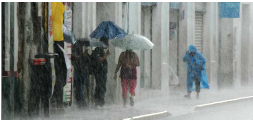
▲ Lo preocupante de las lluvias del pasado viernes y ayer domingo no es que supere las marcas históricas, sino que los encharcamientos ponen en riesgo la salud y vida de los habitantes, y de esto sí existen responsables.

La pregunta que queda es si Mérida pasará a ser un municipio incapaz de realizar acciones preventivas ante una tormenta, ni de aprovechar el agua que caiga, o si tanto autoridades municipales como estatales tendrán la voluntad para proteger la infraestructura hidráulica y eléctrica ante una eventualidad. Eso sí, será sumamente importante que la ciudadanía se comprometa a cuidar y vigilar el equipamiento urbano. A menos que se quiera normalizar el caos a causa de la lluvia.