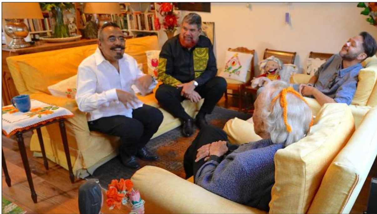
▲ "Queremos que la gente aprenda a narrar ante un público mediante nuestro foro internacional".

-Los cuentos de los argentinos Abelardo Castillo y Silvina Ocampo me encantan, porque