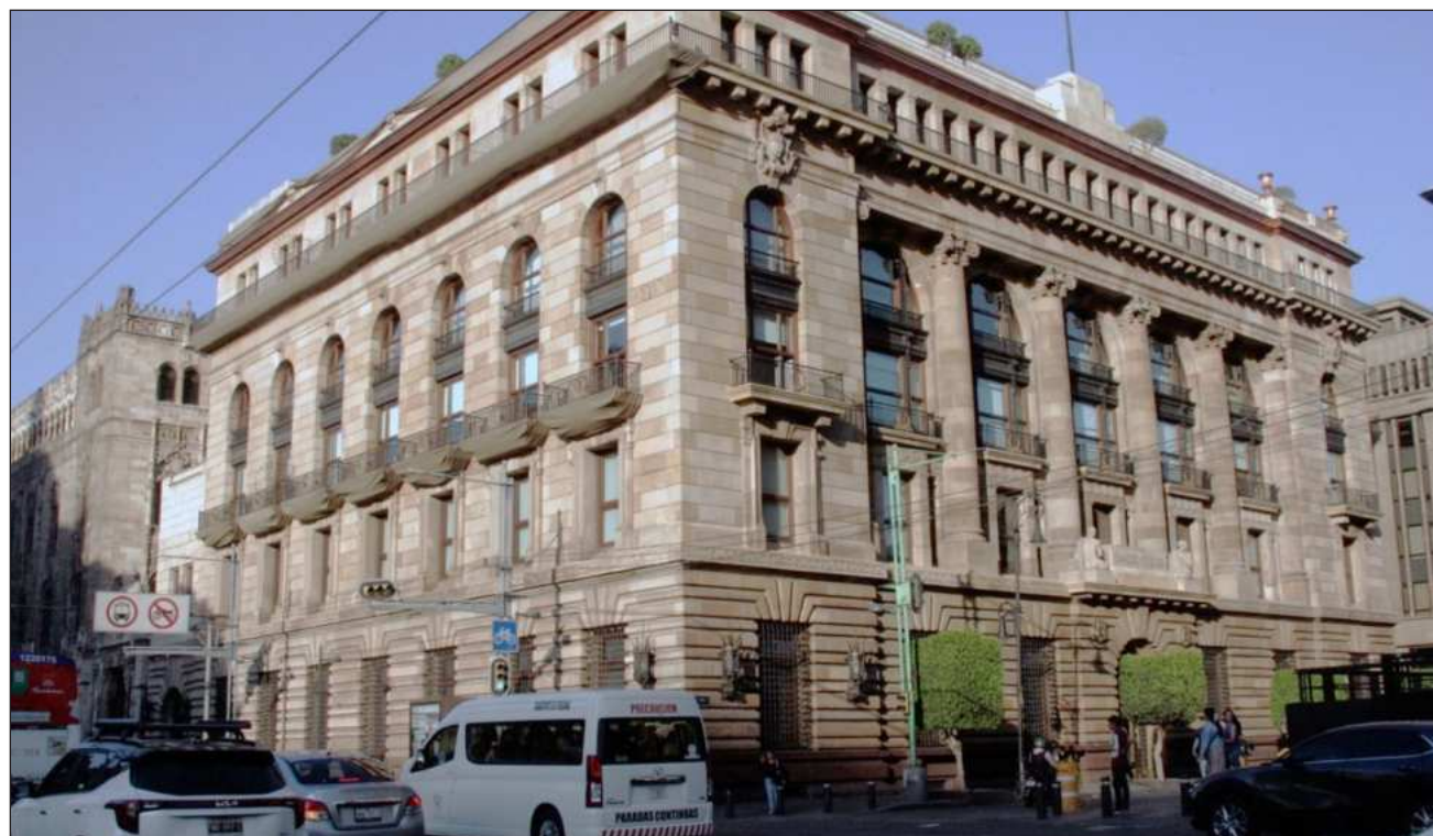
▲ En el análisis del banco -concentrado en productos afectados directamente- los ajustes de precios ocurrieron una sola vez.

Así lo documentó el banco central en su Informe Trimestral enero-marzo 2026, publicado el miércoles, en el que también señala que los incrementos en precios fueron congruentes