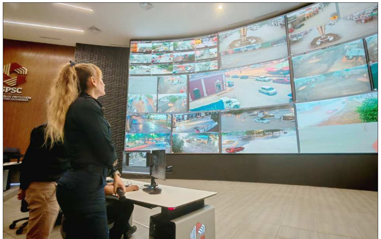
▲ Muñoz cuestionó que los procesos sean atendidos de manera virtual por jueces que no se encuentran en el estado.

Destacó que la captura implicó un riesgo considerable para los agentes de seguridad, quienes actuaron en circuns-