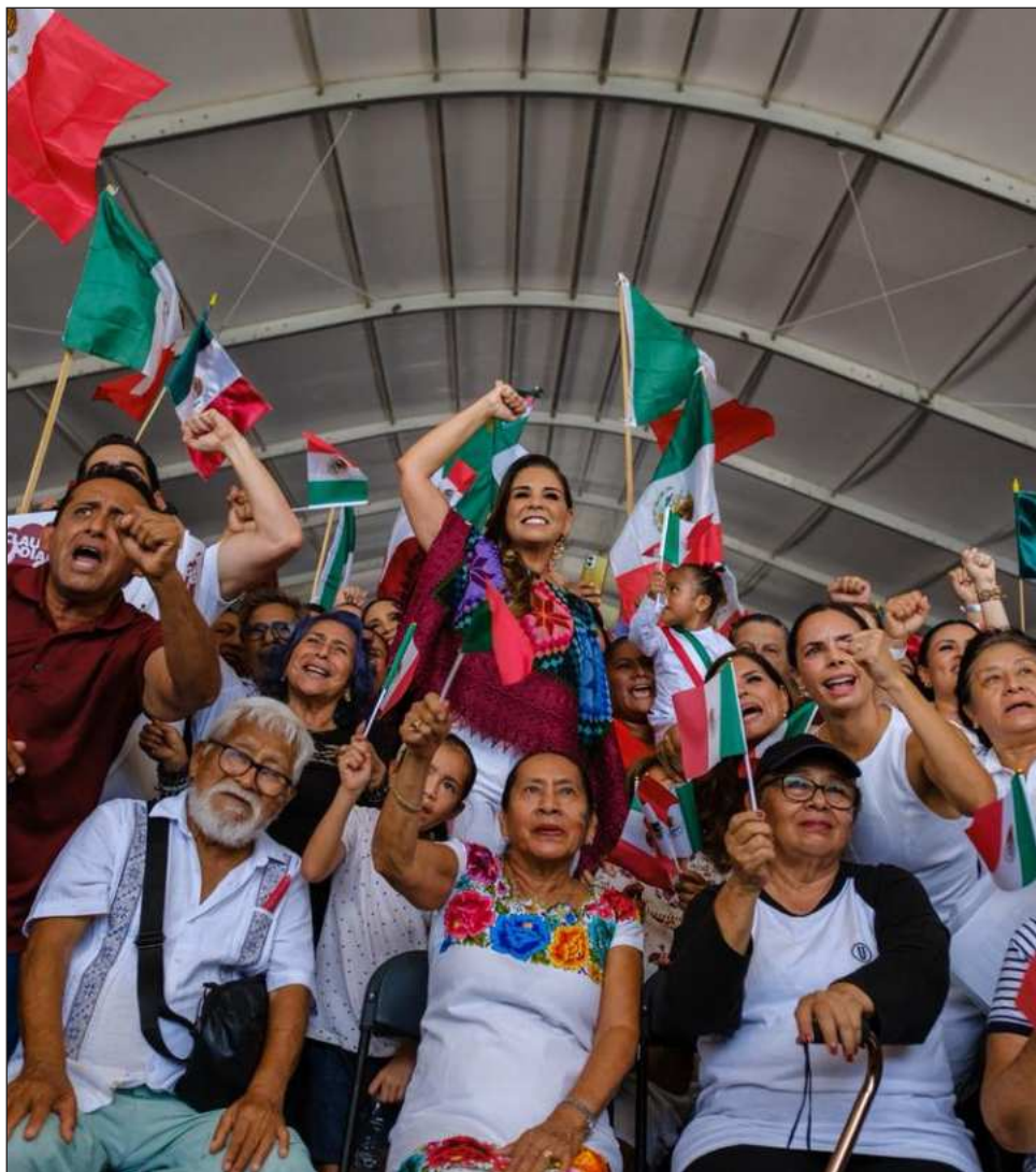
▲ El acto fue transmitido de manera simultánea en plazas públicas de las 32 entidades; la gobernadora Mara Lezama participó en un enlace desde Malecón Tajamar.

“Hace dos años, millones de mexicanas y mexicanos salieron a las urnas y protagonizaron una jornada histórica”, destacó la gobernadora.