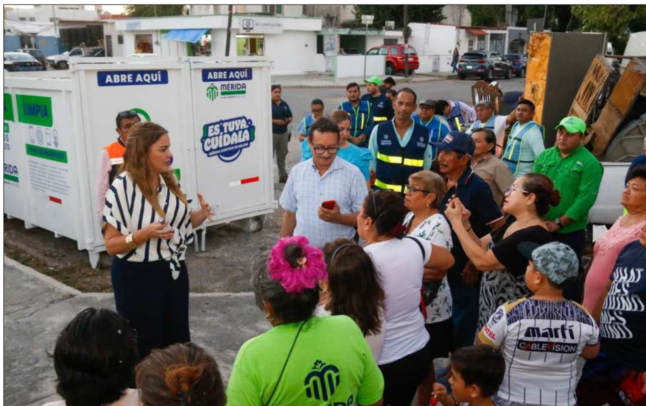
▲ En la actualidad, el programa opera con 23 contenedores, de los cuales 21 se encuentran en funcionamiento.

Esta ampliación permitirá atender mil 392 puntos distribuidos en 315 colonias, 174 fraccionamientos y las 47 comisarías del municipio.