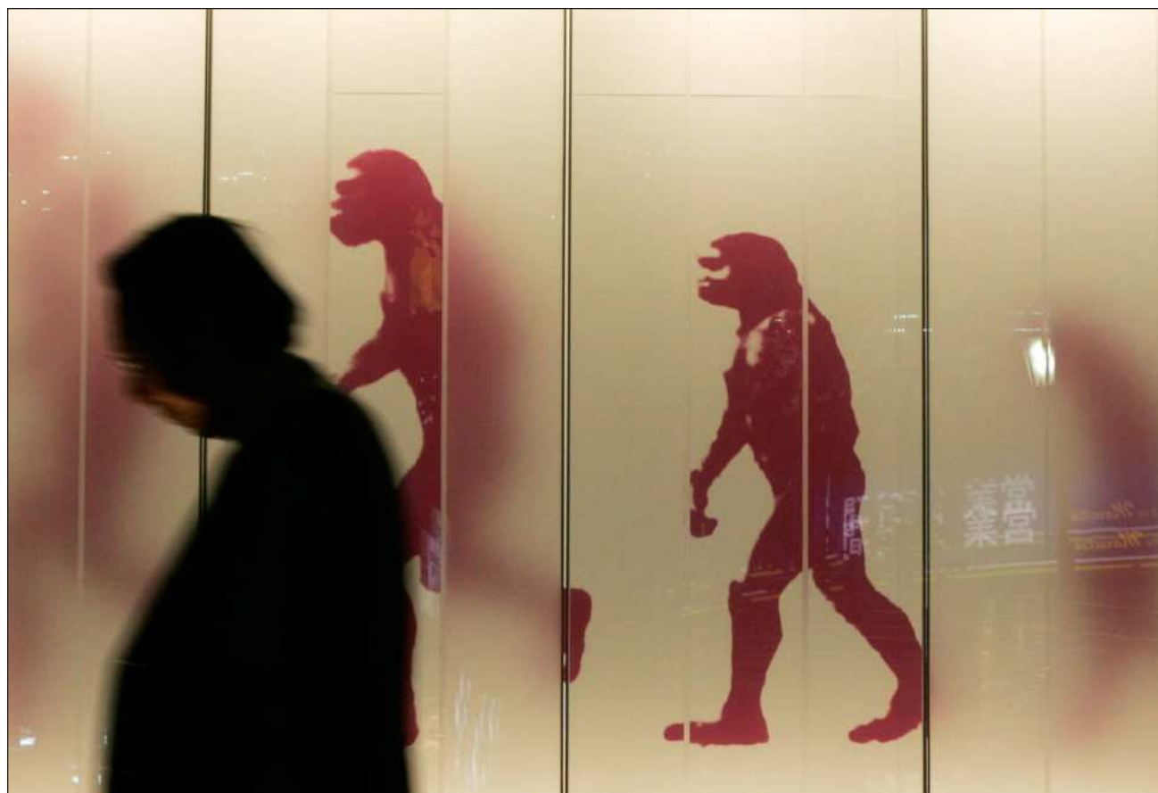
▲ La titular de la Secretaría de Ciencia, Humanidades, Tecnología e Innovación señala que México debe impulsar que en las escuelas “se enseñe no nada más que hay evolución y no creación de la vida en el planeta, sino cómo ocurre”.

Y hoy, a 165 años de su publicación, la teoría de la evolución es clave para entender el mundo que nos rodea, y de ahí la importancia, afirma Rosaura Ruiz Gutiérrez, de que niñas, niños y adolescentes la conozcan y entiendan el proceso de cómo se construye una de las teorías, “no sólo más importante de la biología, sino de toda la ciencia, porque nos explica de dónde venimos y cómo evolucionamos en el planeta”.