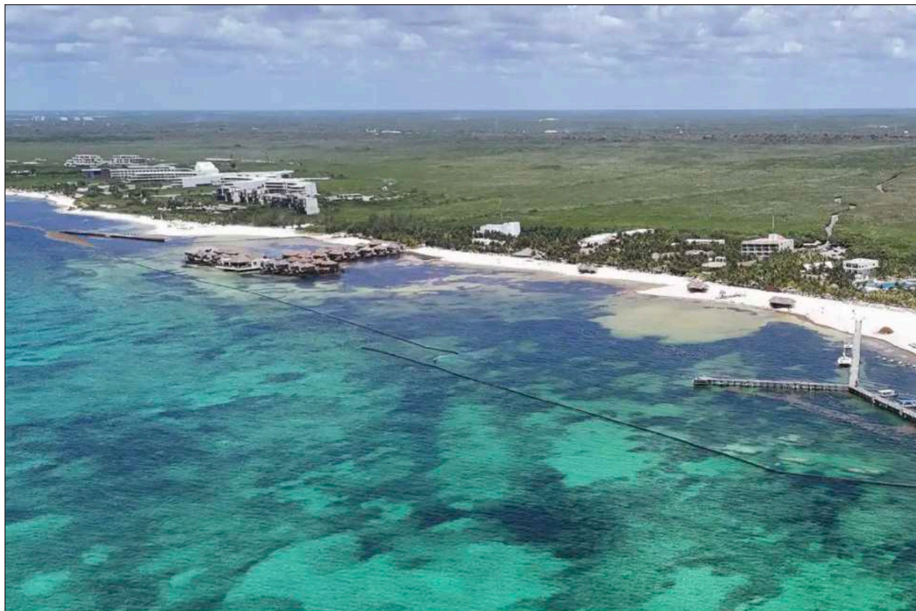
▲ El Grupo Lomas invirtió cinco millones de pesos en una barrera antisargazo, instalada a 40 metros de la costa.

mas Hospitality, reconoció que todos han tenido afectación por recales masivos, pero ya no lo consideran como un factor determinante para la reducción en ocupaciones hoteleras, porque el turista es más tolerante y disfruta de las actividades alternas que ofrecen los centros de hospedaje.