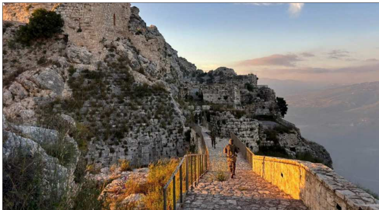
▲ Las tropas israelíes ya tomaron el lugar en 1982 y lo controlaron hasta que se retiraron de Líbano en 2000.

Israel ha emprendido una invasión terrestre en la que ha capturado decenas de aldeas y pueblos