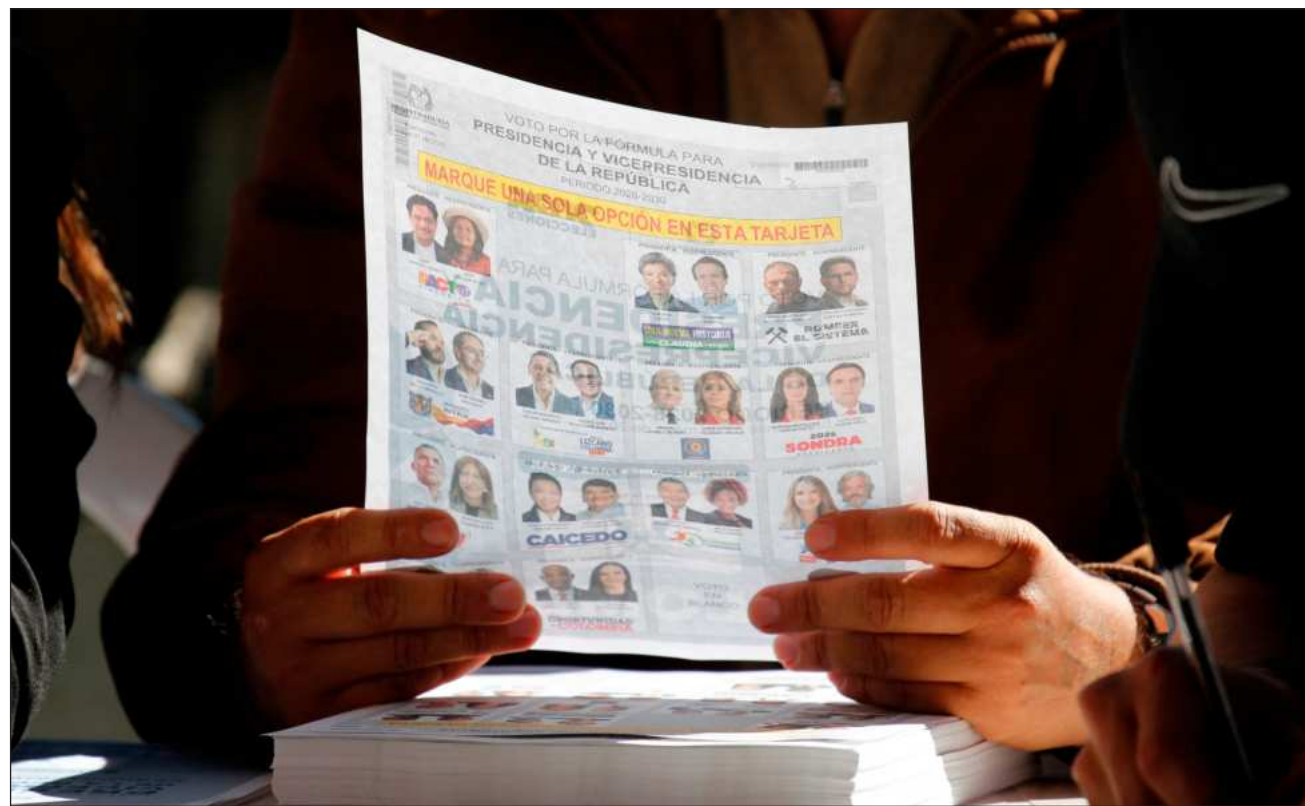
▲ El candidato del movimiento independiente respondió celebrando su resultado y llamando al oficialista un "aliado de narcoterroristas".

Cepeda, del oficialista Pacto Histórico, sembró dudas sobre el conteo previ-