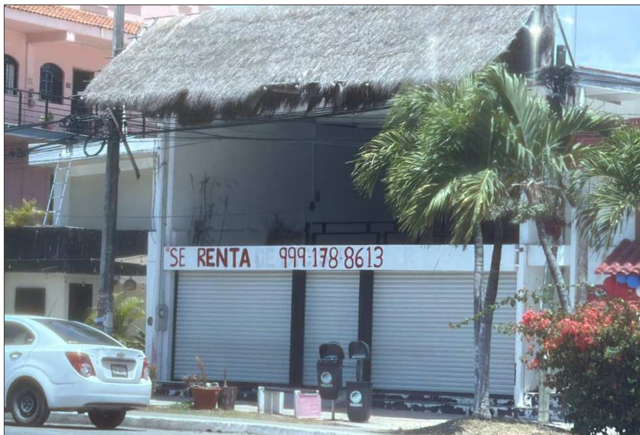
▲ La marcada desaceleración en proyectos y obras afecta notoriamente a tiendas de abarrotes, las cuales dependen en gran medida del consumo diario de trabajadores del ramo constructor, asegura la Canaco delegación Tulum.

El impacto ya alcanzó también al sector de la construcción, donde actualmente se percibe una marcada desaceleración en proyectos y