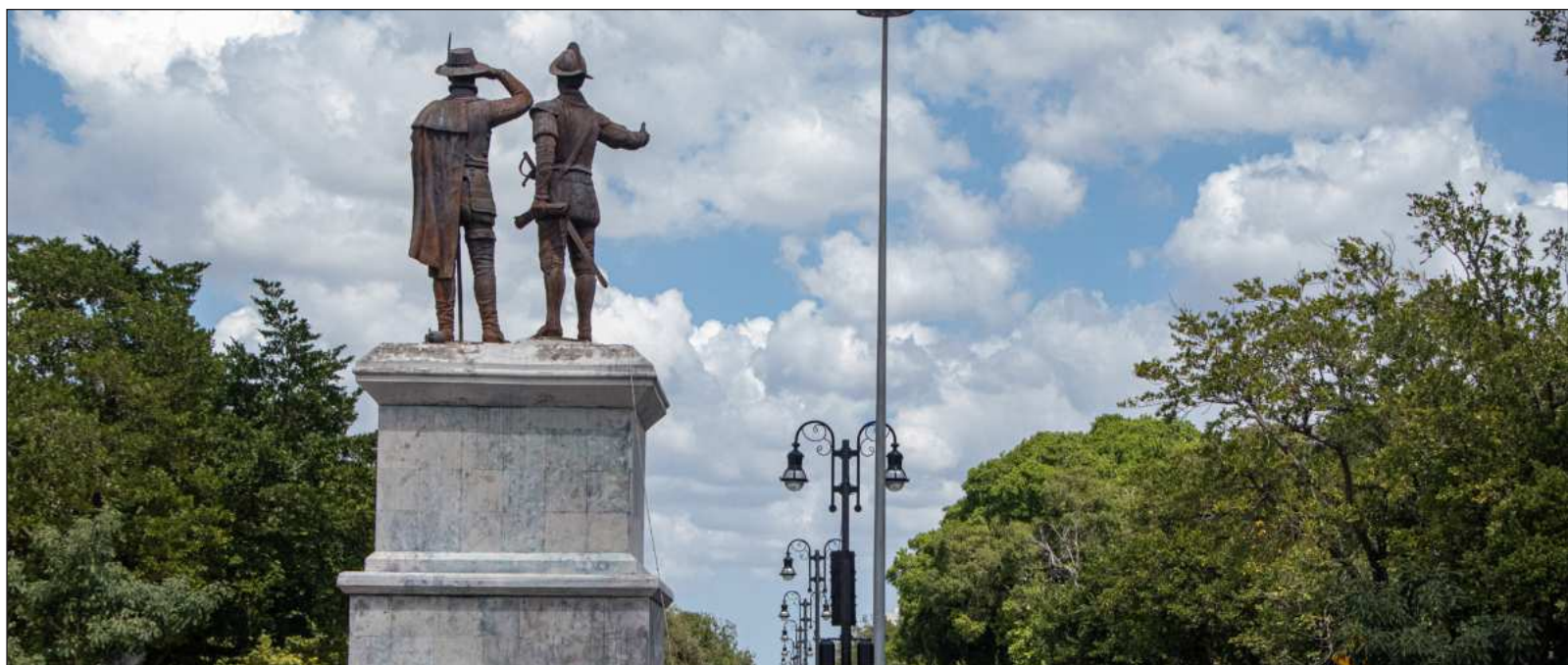
▲ "El monumento en sí no representa un elemento del patrimonio histórico, es una estructura impuesta que refleja la mirada clasista y racista que aún permanece en Yucatán, sobre todo en los sectores poblacionales vinculados con la que fuera llamada la Casta Divina".