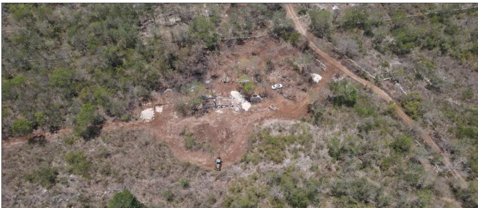
▲ "La reserva está amenazada por diversas causas; la primera y más visible es el crecimiento acelerado y sin control que experimenta Mérida".