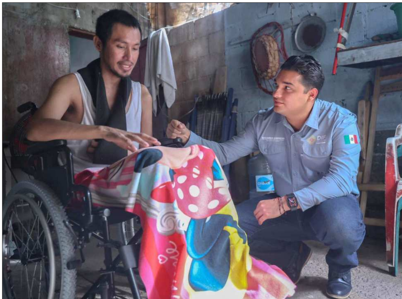
▲ En la jornada se recorrieron colonias como la Colosio, Misión del Carmen y Palmas II.

Esta iniciativa, realizada en coordinación con la Beneficencia Pública,