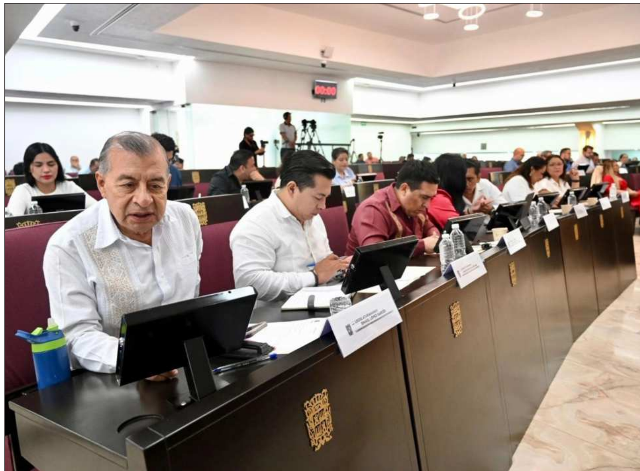
▲ Aún con el debate, la reforma tuvo mayoría relativa y se aprobó sin mayores inconvenientes.

Con estas modificaciones se busca que la ciudadanía cuente con mayores elementos para participar en la elección de quienes impartirán justicia y que el desempeño de dichos cargos esté sujeto a procesos continuos de evaluación y mejora institucional.