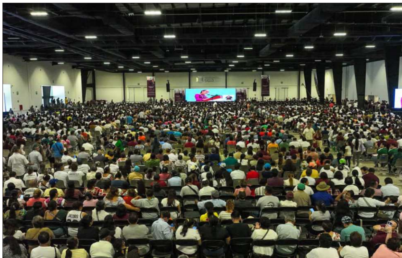
▲ El gobernador Joaquín Díaz Mena participó en un enlace transmitido en cadena nacional por la rendición de cuentas de la presidenta Claudia Sheinbaum, a dos años del triunfo en las urnas durante las elecciones del 2 de junio de 2024.

El mandatario reconoció el liderazgo de CSP ante los retos nacionales e internacionales