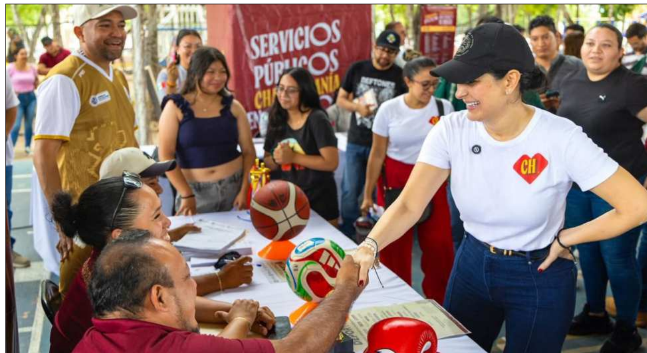
▲ Las familias de Villas del Sol recibieron consultas médicas, nutricionales y psicológicas gratuitas.

Durante la actividad, la alcaldesa recorrió los módulos instalados, entregó de