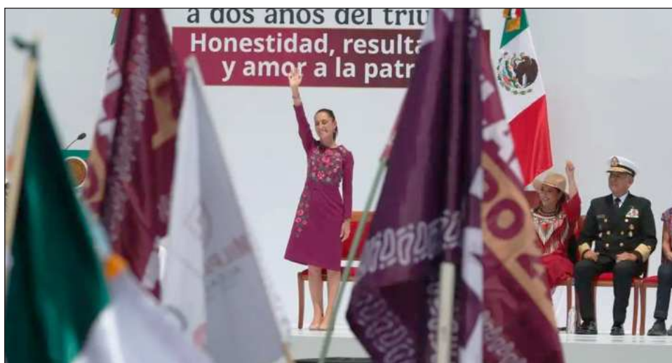
▲ Claudia Sheinbaum ofreció su informe de rendición de cuentas a dos años de administración.

“No olvidemos que durante el sexenio de Vicente Fox se vivió la cruel represión a los pobladores de San Salvador Atenco, o la brutal represión a los maestros de Oaxaca. Por si fuera poco, Fox encabezó el desafuero a Andrés Manuel López Obrador, y su obra cumbre, el fraude electoral de 2006 que llevó a la presidencia al espurio de Felipe Calderón, que llenó el país de muerte, de sangre con la fallida guerra contra el narco,