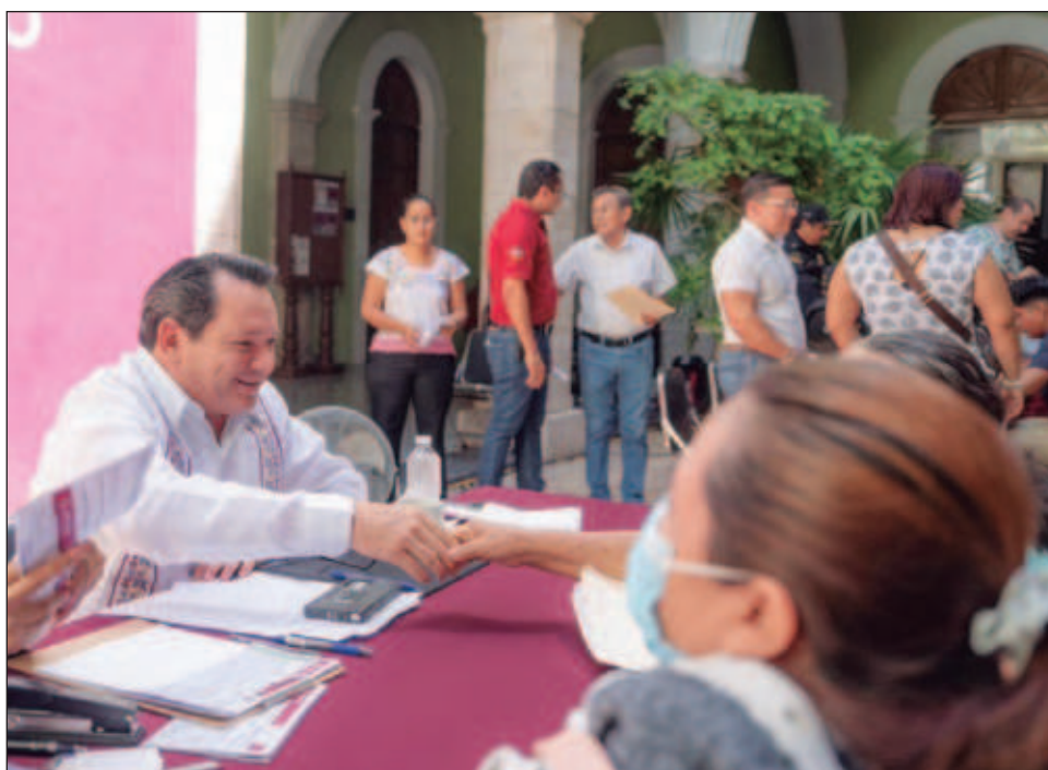
▲ Huacho afirmó que en el Renacimiento Maya no se dará la espalda al pueblo; por el contrario, se le escuchará y se construirá el Yucatán que las familias merecen.

El hombre, originario de Cepeda Peraza, comisaría de Tekax, explicó que en días pasados aprovechó la visita de Díaz Mena a su municipio para ponerse en contacto con él, pedir una cita, acudir este