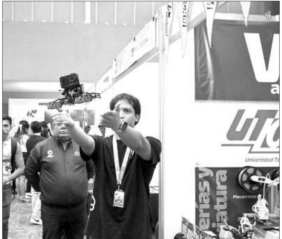
▲ Muchos estudiantes buscan oportunidades laborales, sin embargo, la situación económica que prevalece evita que puedan ser contratados.

Expuso que algunos alumnos en la busca de oportunidades, han tenido que emigrar a otras entidades, para lograr colocarse en empleos referentes a las carreras que estudiaron.