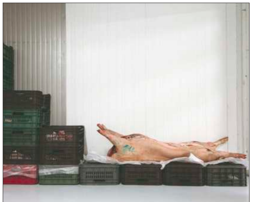
▲ La República del Cerdo es el resultado de un recorrido por todo México que duró cinco años. Según el prologuista Javier Risco, va “de las carnitas al zacahuil, del chicharrón a los tacos al pastor, el cerdo nos acompaña con generosidad infinita, envolviendo nuestra cultura en tortillas y memorias”.