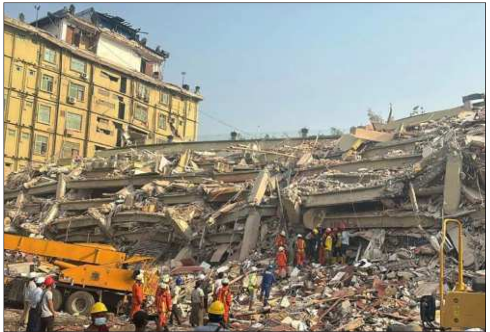
▲ Los expertos esperan que la cifra de decesos continúe creciendo en los próximos días.

Además de los 2 mil 56 fallecidos confirmados, hay más de 3 mil 900 heridos y 270 personas siguen manteniendo desaparecidas tras el sismo de 7.7 grados.