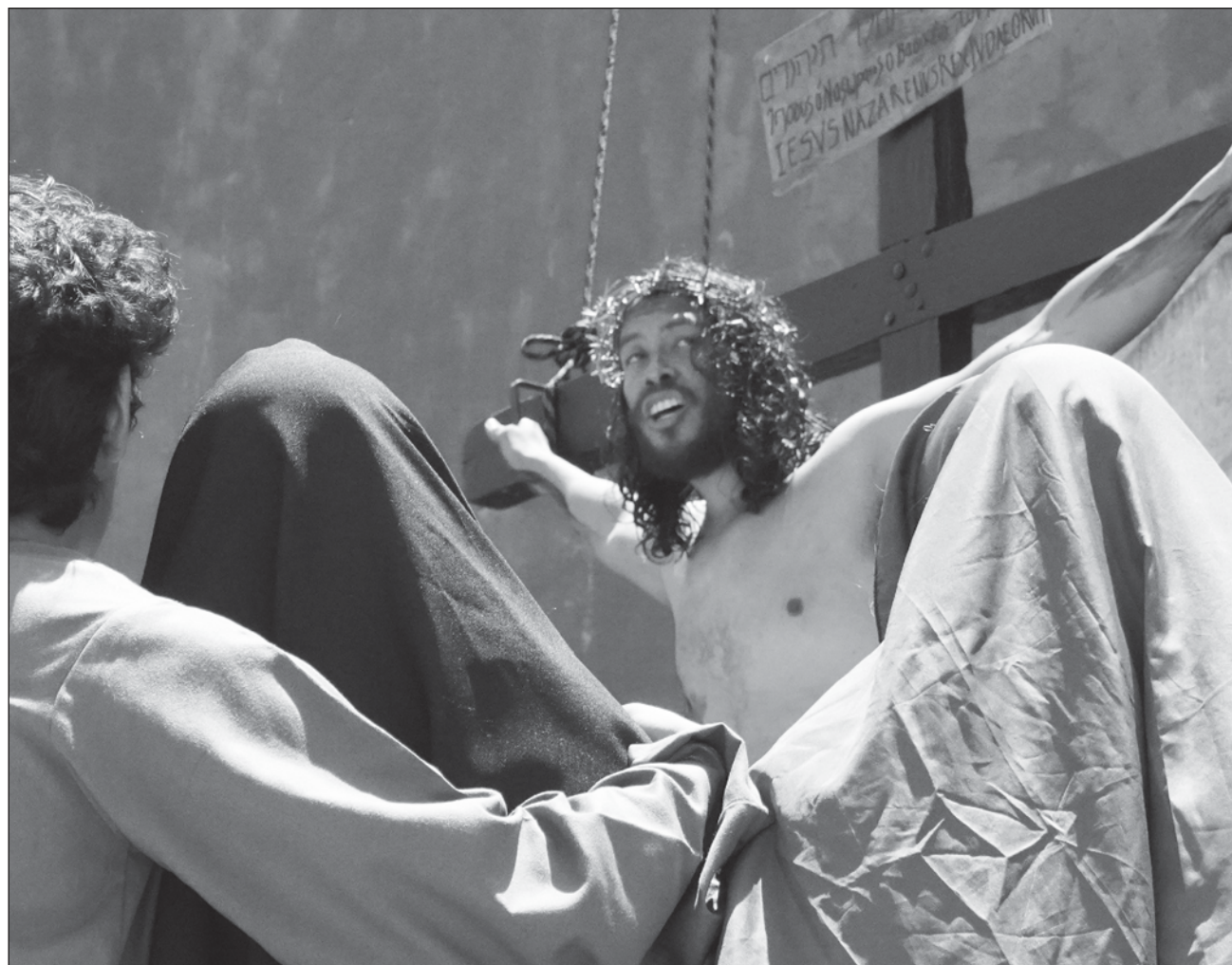
▲ La representación del Viacrucis del Barrio de Santa Ana es la más antigua de la capital campechana.

tipo de actividades en el Cereso refuerzan la fe de las personas privadas de su libertad y les recuerda que asumir los pecados es una forma de liberarse.