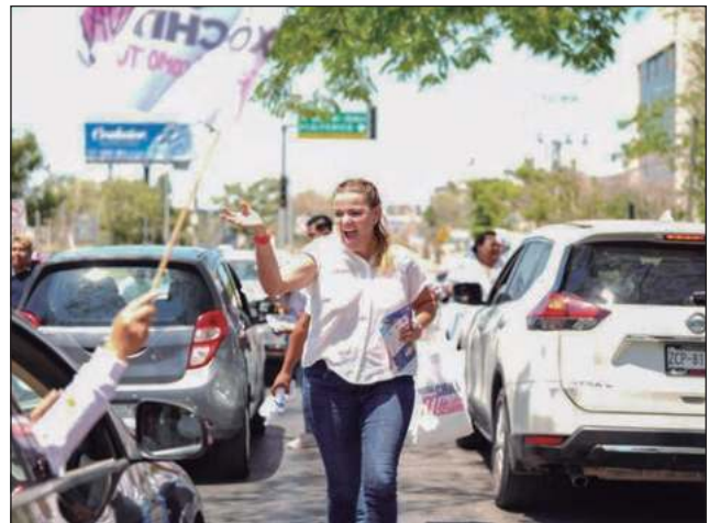
▲ La candidata inició su campaña en San Antonio Xluch III, concluyendo en la comisaría de Dzununcán.

Los candidatos también ingresaron a algunas viviendas para regalar camisas, y platicar con las familias, quienes escucharon con atención las propuestas de los políticos.