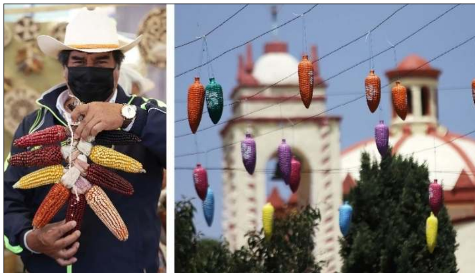
▲ La Feria del Maíz, que concluye hoy, tuvo su primera edición en 1995. Pasó por diversas etapas de ajuste y definición de prioridades.

El también activista en la lucha por la preservación de las semillas nativas, añadió