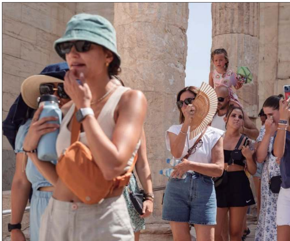
▲ Las olas de calor se ralentizaron principalmente en África, mientras que América del Norte y Australia mostraron los mayores incrementos en su magnitud global.

En estudios anteriores se ha mostrado que las olas de