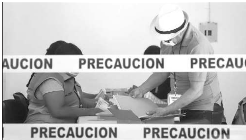
▲ En el último proceso electoral (celebrado en 2021) en el estado de Quintana Roo sumaron poco más de 70 denuncias, principalmente por temas de proselitismo.

"Todas las autoridades estamos para apoyar y conocer, para tener el conocimiento de los hechos de cualquier tipo de queja que quieran manifestar como hecho de delictivo y nosotros lo que ofrecemos por parte de la Fiscalía General de Justicia del Estado es que todas las agencias del Ministerio Público están prestas para colaborar y recibir todo lo que sea denuncia".