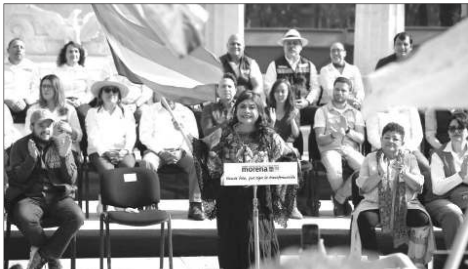
▲ La morenista sostuvo que los unen los principios y las convicciones, no las complicidades como en la oposición, a la que tildó como una “minoría rencorosa y corrupta”.

Apuntó que en este proceso nadie sobra y todos son necesarios, porque lo fundamental es el proyecto de transformación y el deber de llevar a Claudia Sheinbaum a