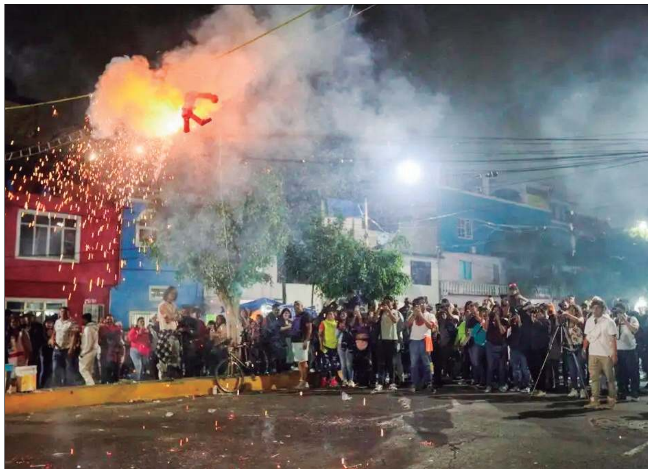
▲ Pese a sus orígenes, no se trata de un asunto religioso: se trata más de una celebración popular.

Un Mario y Luigui Bros, un Huggy Wuggy y un Toad (personajes de videojuegos), así como una Hello Kitty, una calavera azteca, una calavera demonio, un chupacabras, una princesa Masha (figura de animación) y alebrijes, fueron el resto de las piezas de cartón incineradas ante la muchedumbre, así como del tradicional Judas, cuya pecu-