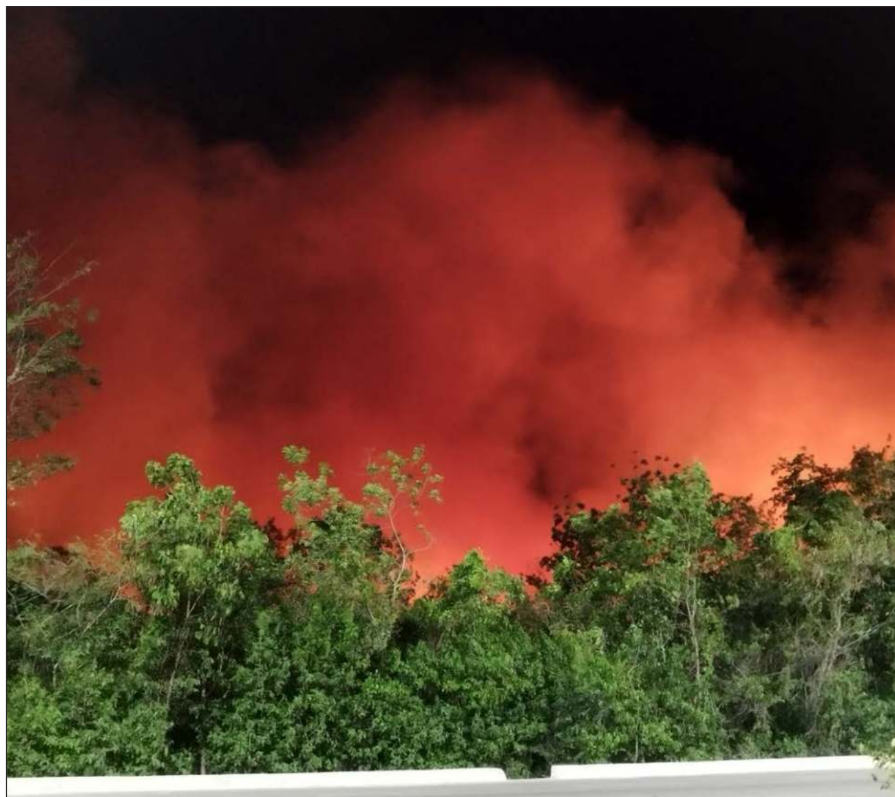
▲ Precisó que en el Estado de México hay once incendios activos, en Jalisco ocho, en Michoacán y Chiapas siete, en Oaxaca y en Chihuahua hay seis, y en Durango se registran cinco, entre otras entidades que reportan conflagraciones.

Indicó que hay 14 siniestros en 14 áreas naturales protegidas, entre ellas Nevado de Toluca, Sierra Gorda en Querétaro, La Sepultura en Chiapas y el Tepozteco en Morelos.