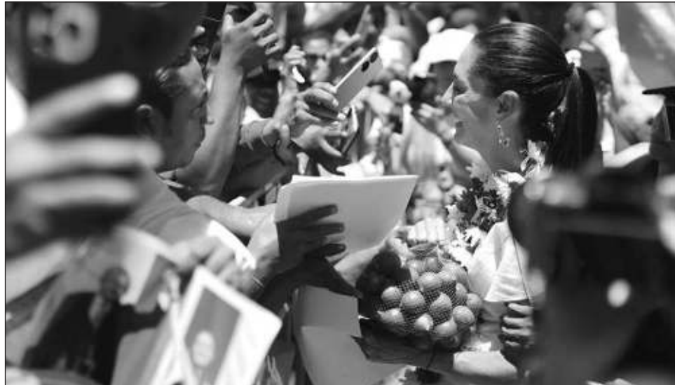
▲ La candidata de la coalición Sigamos Haciendo Historia estuvo presente en el arranque de campaña de Alejandro Armenta al gobierno de Puebla.

“¿No decían ellos que el INE no se toca? ¿Quién está usando ahora el logotipo del INE ilegalmente? La gente ya no les cree. Si ellos llegan, ¿creen que van a defender los programas sociales? No lo hacen por con-