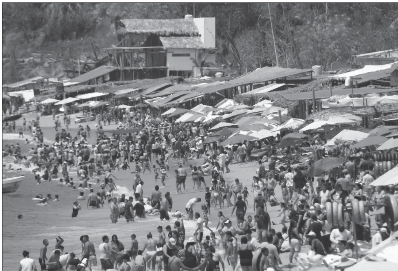
▲ Establecimientos de Puerto Marqués reportaron lleno total después de cinco meses de preocupación por baja de turismo después del huracán categoría 5 que golpeó Acapulco el 25 de octubre pasado.

El pescado frito con ensalada y papas a la francesa fue el plato más solicitado. También las pescadillas con rebanadas de tomates rojos brillantes con mayonesa. Bajo las enramadas los sonidos se mezclaban.