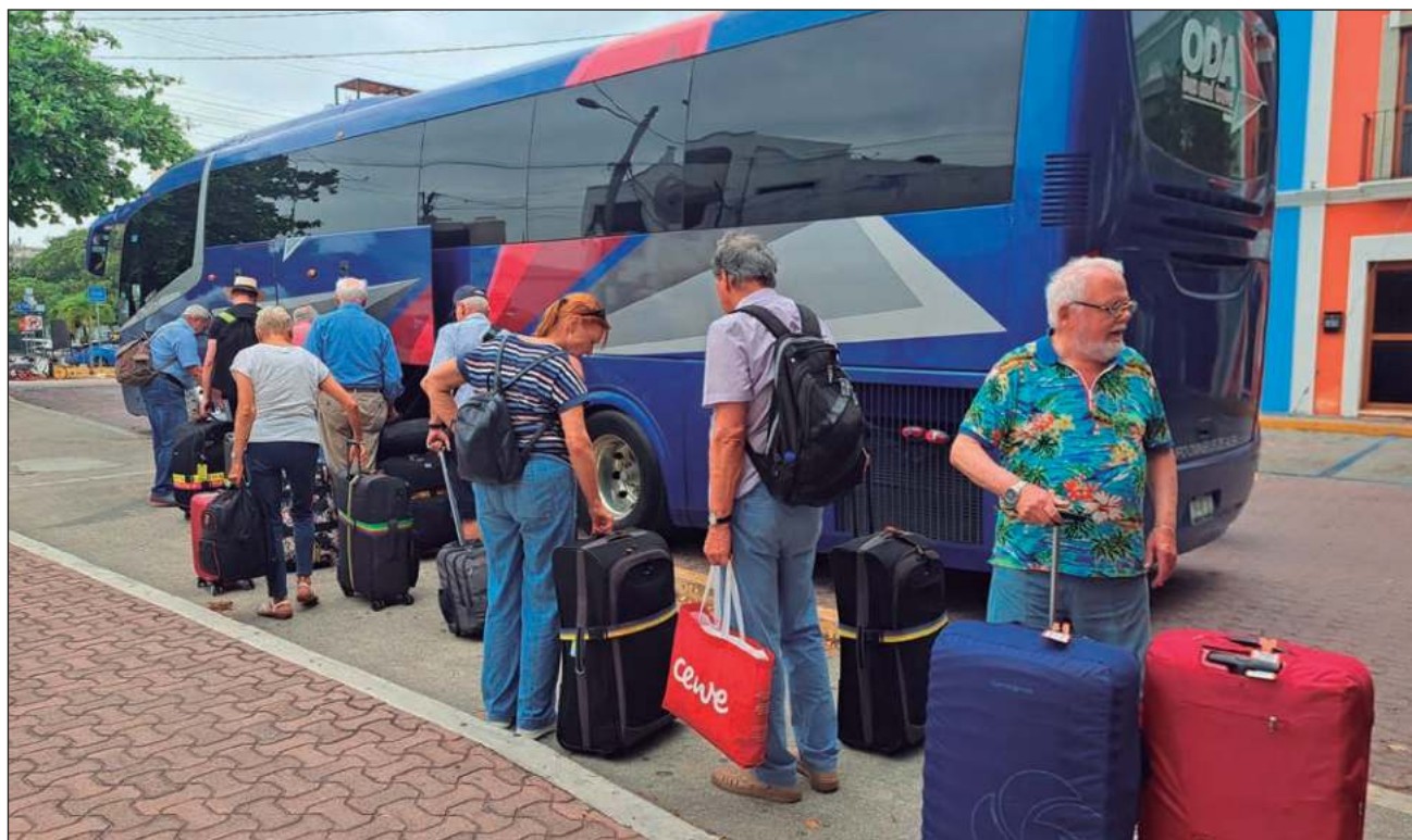
▲ La derrama económica estimada por las autoridades del ramo para este período es de más de mil millones de dólares, lo que constituye un incremento del 5.9 por ciento respecto a la Semana Santa del año anterior.

Para el periodo vacacional de Semana Santa, compren-