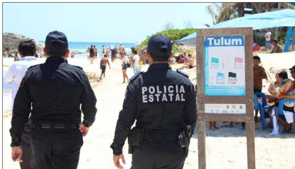
▲ Los elementos realizan recorridos en las playas donde invitan a los visitantes a seguir las indicaciones, señalamientos y otras recomendaciones.

“Recibimos en Quintana Roo a nuestros turistas con los brazos abiertos y tenemos desplegado todo un operativo en todo el estado como parte del trabajo coordinado con los tres niveles