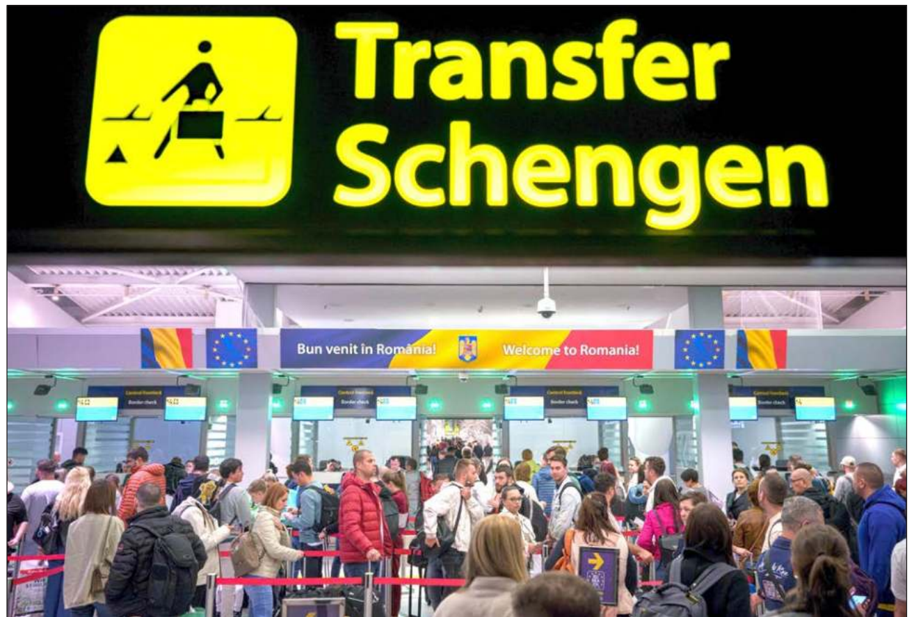
▲ El espacio Schengen es un área de libre circulación que se creó en 1985 y en la que más de 400 millones de personas pueden viajar sin someterse a controles fronterizos, y luego de 13 años de espera Rumania y Bulgaria fueron incluidos.

Era una "cuestión de dignidad", declaró Stefan Popescu, experto en relaciones internacionales radicado en Bucarest.