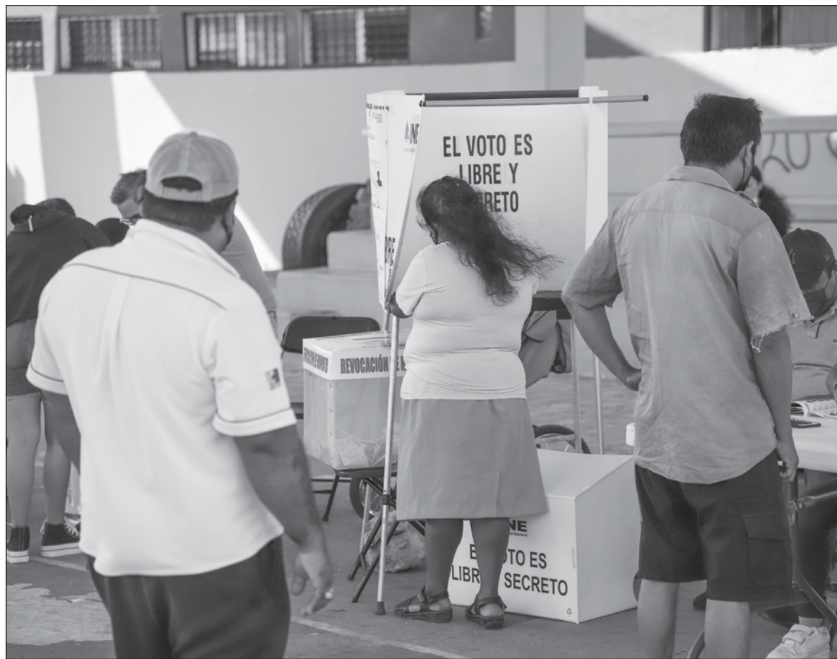
▲ "Es importante reflexionar e informarnos de los espacios en los que la ciudadanía podemos y debemos participar, en el que los institutos electorales (...) se ponen a su disposición para tener una elección más transparente".

EN ESTA PRIMERA Insaculación se seleccionó al 13 por ciento de la