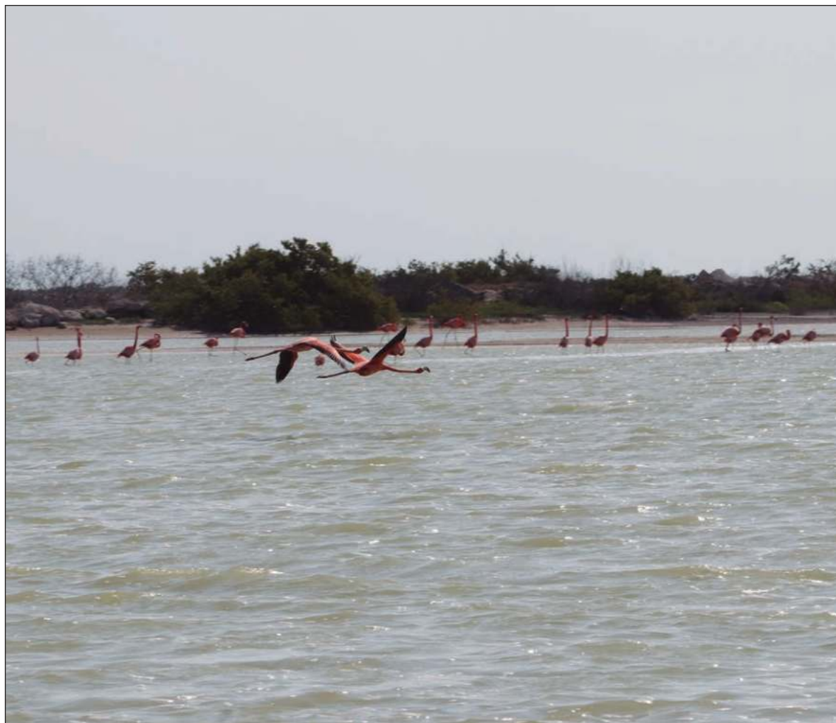
▲ "A través de uno de mis hijos, sé que en Río Lagartos y en San Felipe la gente tiene un alto sentido de solidaridad y de respeto no sólo por los demás, sino también por el entorno ecológico y la normatividad".

Pensar en términos de comunidad ha hecho de Río Lagartos y de San Felipe un enclave muy interesante; las temporadas de veda, por ejemplo, se palian a través de programas comunitarios para atraer