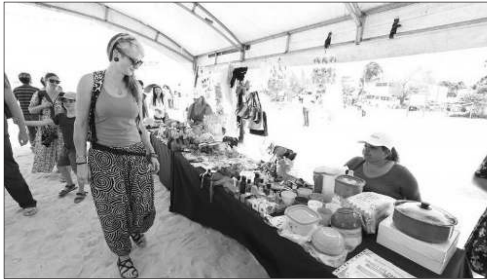
▲ El festival se realizó del 24 de febrero al 31 de marzo, periodo en el que las familias de municipios y comisarías pesqueras contarán con una opción para mejorar sus ingresos.

El Festival de la Veda se realizó del 24 de febrero al 31 de marzo, periodo en el que las familias de municipios y comisarías pesqueras contarán con una opción