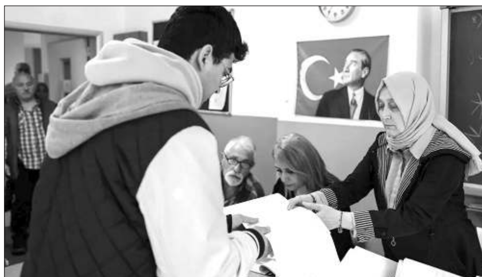
▲ Recep Tayyip Erdogan prometió “no faltar el respeto a la decisión de la nación bajo ninguna circunstancia”, explicando que durante este periodo legislativo “corregirán los errores”.

El principal partido de oposición de Turquía logró conservar su control sobre ciudades clave, según los resultados preliminares, en un gran revés para el presidente Recep Tayyip Erdogan, quien deseaba retomar el control de esas áreas urbanas.