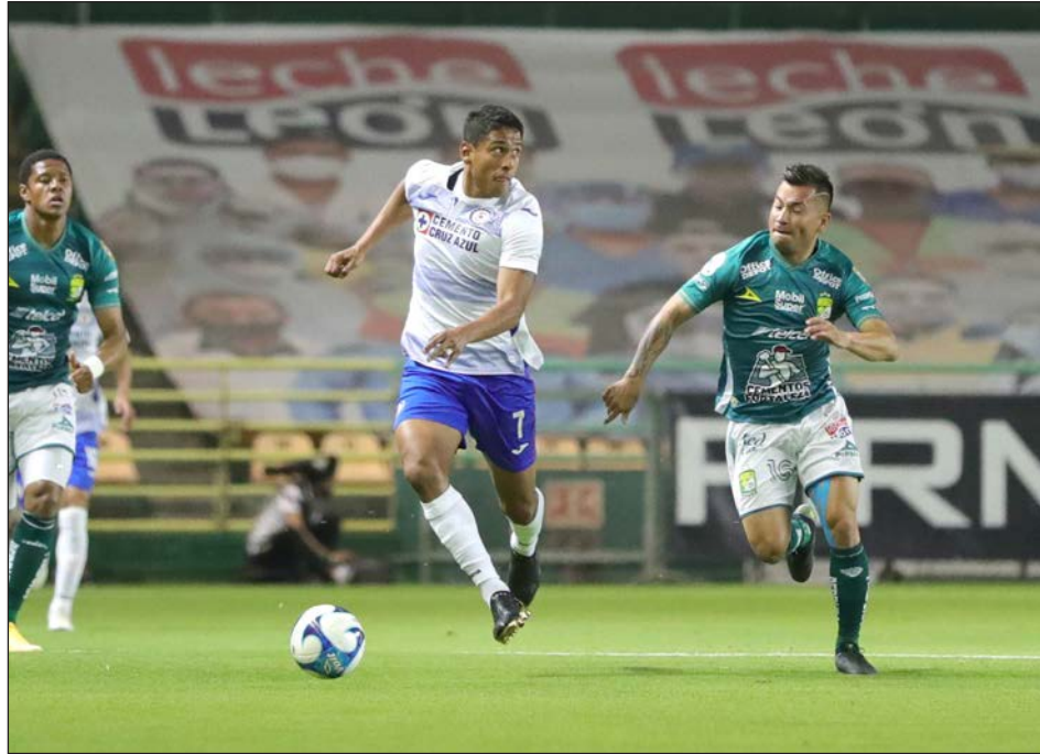
▲ Cruz Azul es líder de la Liga Mx con 18 puntos, seguido por el América (16). Toluca tiene 14 y Tijuana 13.

Cinco días antes, el conjunto americanista había perdido la posición de honor por la alineación indebida del uruguayo Federico Viñas ante el Atlas y cayó hasta el tercer sitio detrás de Cruz Azul y Toluca. "Hemos enfrentado el partido y la semana con mucha seriedad, pasando página pronto en una semana en la que el equipo y los jugadores se entrenaron muy bien, aunque fue difícil", afirmó Solari en conferencia de prensa posterior al partido. "Tienen mucho mérito los jugadores que no se desconcentraron, estuvimos maduros ante un rival que juega bien".