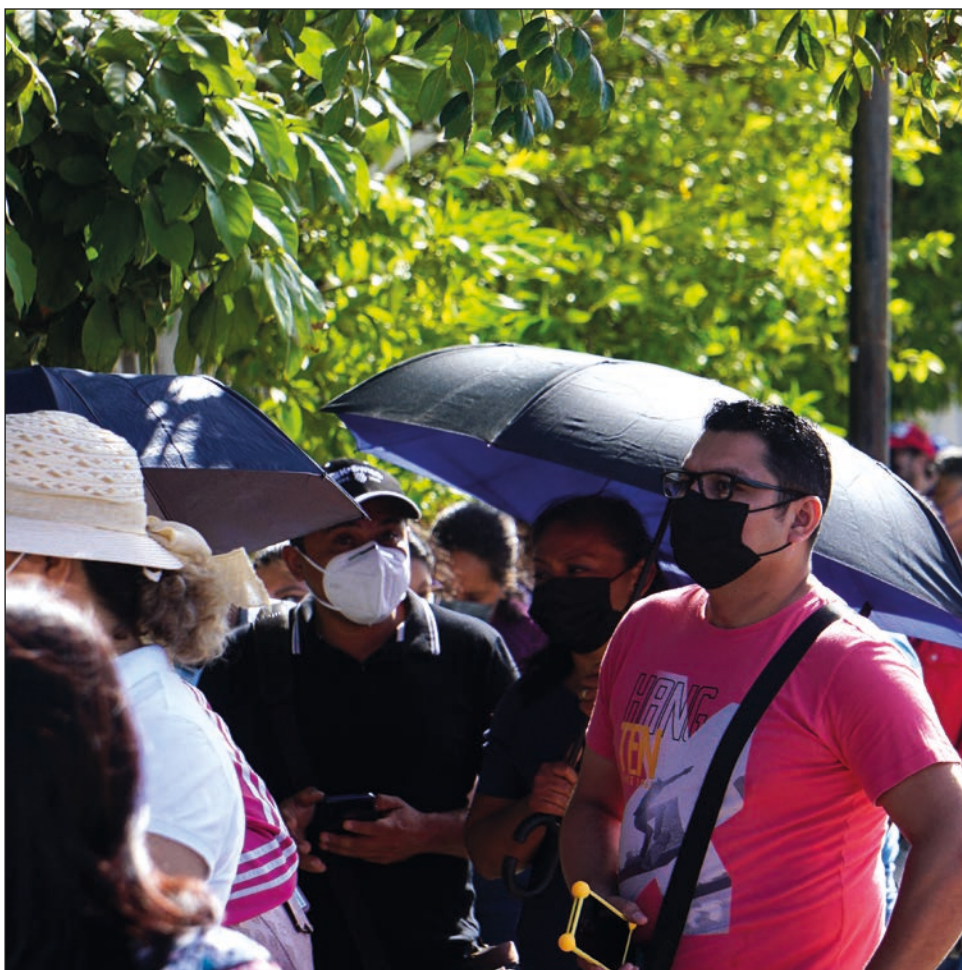
▲ En el Hospital de Zona 04 del IMSS, la fila alcanzó cuadra y media.

Siervos de la Nación estiman que esta aplicación se prolongue hasta mediados de semana, cuando se considera concluir la inmunización.