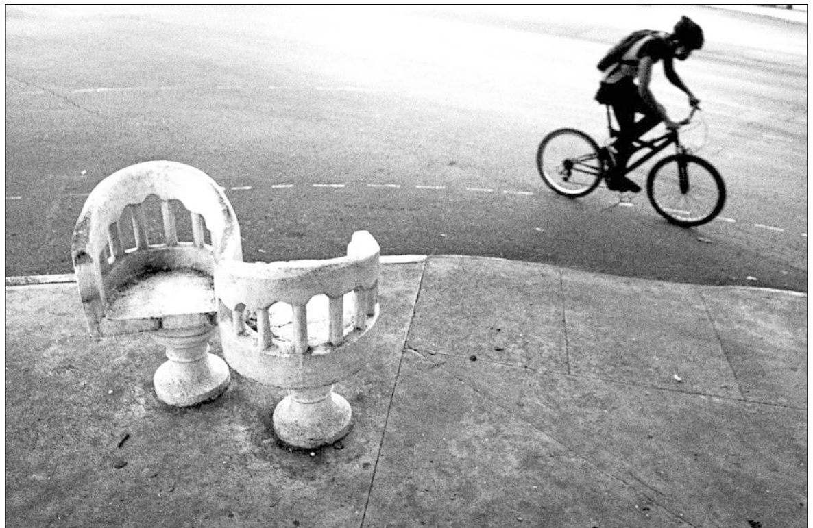
▲ La llamada biciruta que, previo a la pandemia el Ayuntamiento de Mérida impulsó cada fin de semana, contenía más un carácter social y turístico que de verdadera conciencia sobre la posibilidad de utilizar la bicicleta como medio de transporte.

EN DÍAS RECIENTES , el Inegi informó que Mérida era la ciudad donde más hogares reportaban tener al menos una bicicleta (57 de cada 100 hogares). El colectivo Cicloturixes celebró la noticia y la difundió mediante sus redes