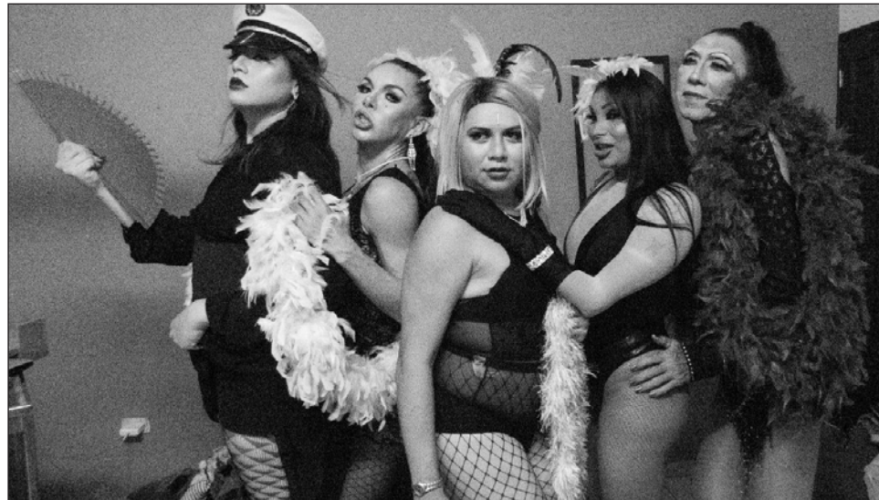
▲ Decidimos hacer un homenaje a La Reina del Trópico, a María Antonieta Pons, Rosa Carmina y Tongolele.

Para Muñeca no ha sido fácil el hecho de generar proyectos en favor de sus compañeras, puesto que reconoce que las mujeres trans en su mayoría viven con el estigma de no poder ser integradas al mundo laboral