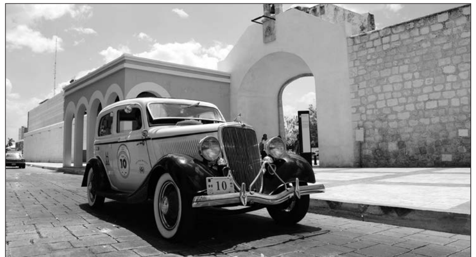
▲ El circuito reunirá a más de 100 vehículos clásicos que recorrerán los tres estados peninsulares.

En cuanto a la labor social, comentó que esta es el corazón del Rally Maya; y en esta ocasión consistirá