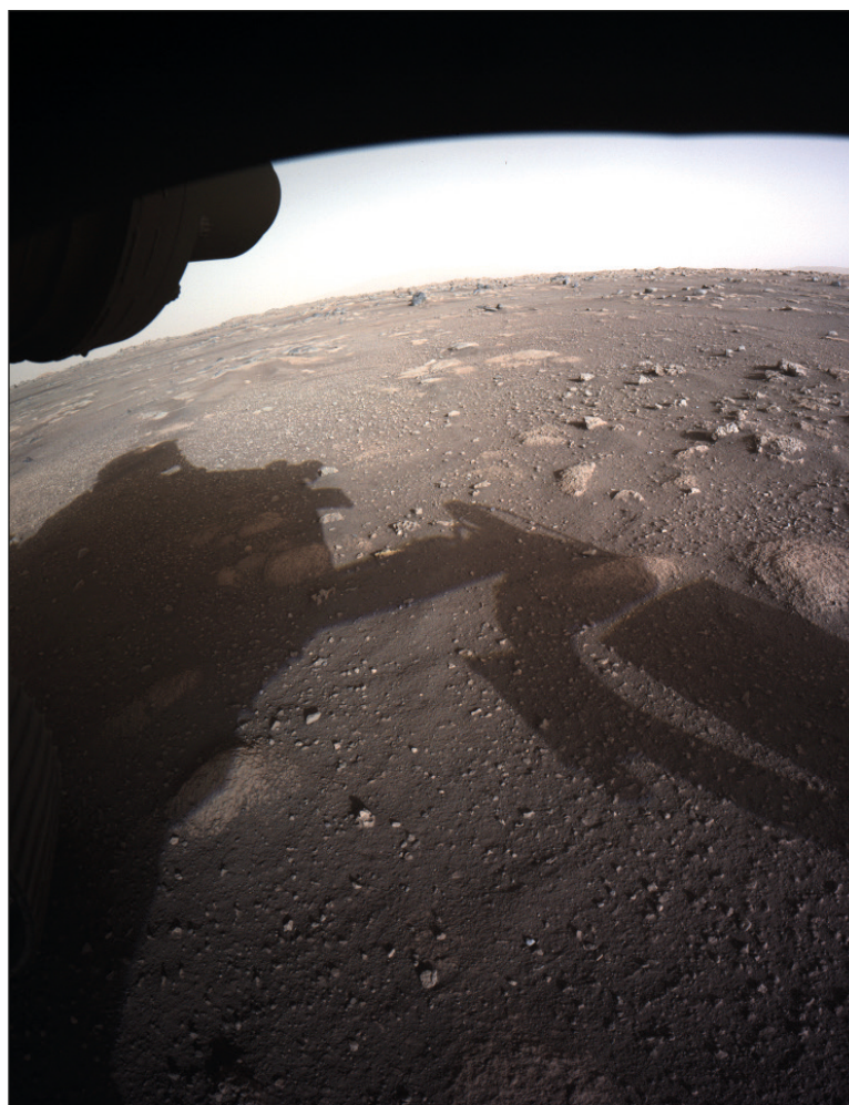
▲ Fueron años y años de investigación y esfuerzo para descubrir que cada dos años se produce una ventana en la que los dos planetas están en mejor posición para enviar las naves.

Animada por una revista sobre el papel de las mujeres en las