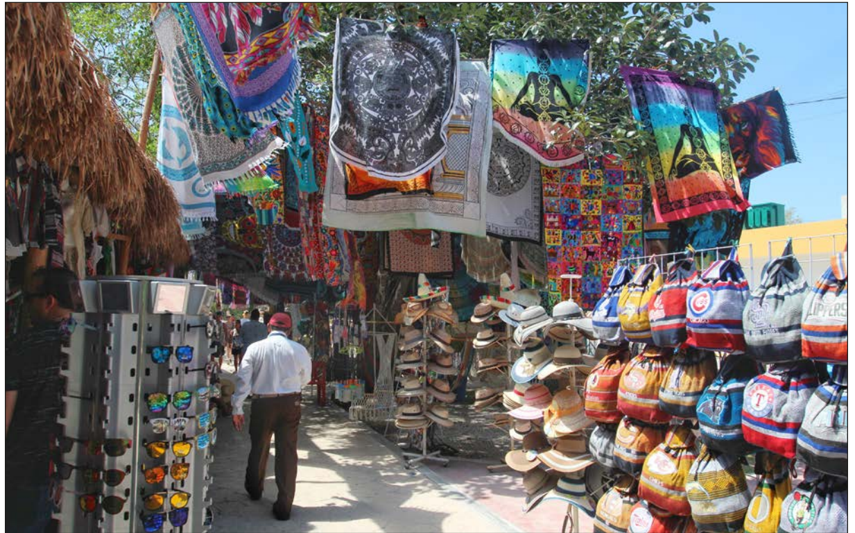
▲ Tulum fue incorporado al programa de Pueblos Mágicos en 2015 y cuenta con un gran patrimonio natural, cenotes, parques temáticos, y dos de las zonas arqueológicas más importantes de la región.

Recordó que Tulum fue incorporado al programa en 2015 y cuenta con un gran patrimonio natural, uno de los más hermosos litorales del país, un mar calmo, clima adecuado, cenotes, parques temáticos, una enorme riqueza del pasado con dos de las zonas arqueológicas más importantes de la región (Cobá y Tulum), “y no toda la cultura es cosa muerta, está la cultura viva de las comunidades mayas, ese es otro atractivo muy importante y hay varios poblados que ya están organizándose para fomentar la convivencia con quienes nos visitan”.