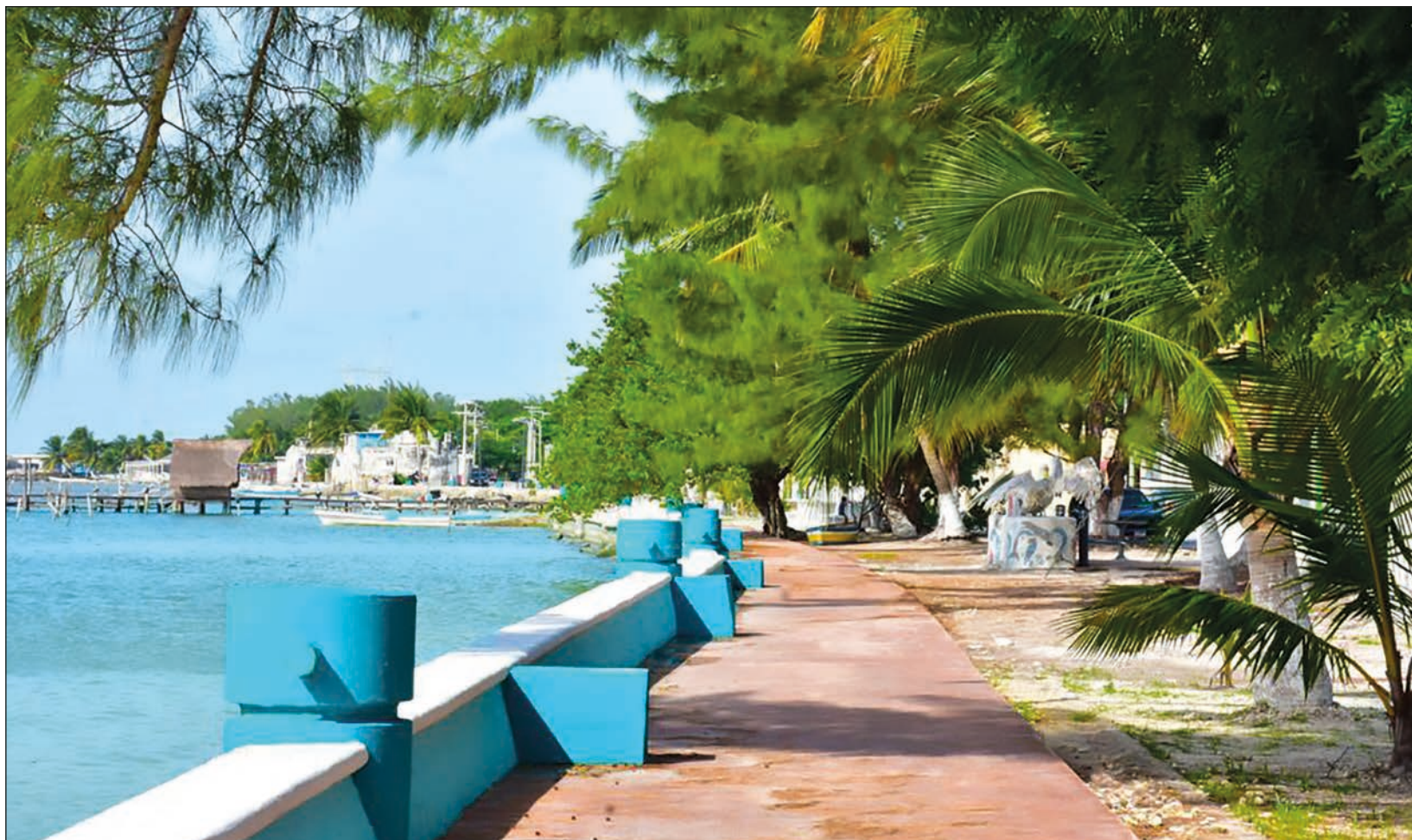
▲ Isla Aguada se convierte en uno más de los destinos que ofrece Campeche para disfrute de los turistas.