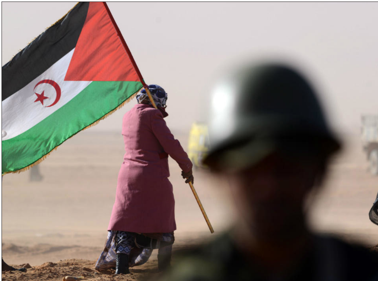
▲ Tras casi 30 años del alto el fuego, las tensiones resurgieron en noviembre cuando Marruecos desplegó sus tropas en el Guerguerat.

El sábado, las autoridades de Nigeria anunciaron que al menos 40 alumnos, docentes y familiares secuestrados el 17 de febrero en una escuela del norte de Nigeria ya habían sido puestos en libertad.