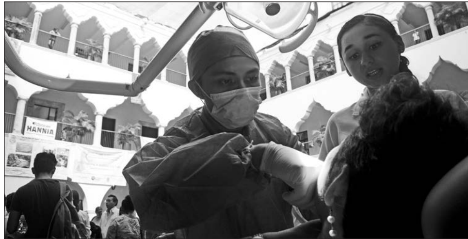
▲ En general, los odontólogos trabajan a 40 centímetros de la boca de sus pacientes, donde hay mayor carga viral.

que están trabajando en instituciones públicas sean contemplados primero para la vacunación, pero quienes trabajan en consultorios privados no tienen fecha para ser vacunados”, expuso.