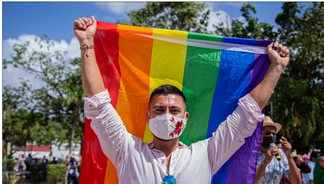
▲ Durante la marcha Besos y abrazos , los manifestantes portaron banderas con los colores del arcoiris y gritaron consignas a favor del respeto a la diversidad sexual.

"Es de nuestro interés que Tulum, que es un destino turístico internacional sea mucho más abierto de lo que ya es, o de lo que yo pensaba que era. Todavía hace falta mucho trabajo por hacer y