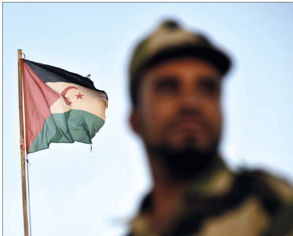
▲ El Frente Polisario pugna por el fin de la ocupación colonial marroquí.

El Frente Polisario denunció que la complicidad de la Organización de Naciones Unidas (ONU) ha facilitado a Marruecos escalar sus agresiones contra la República Árabe Saharaui Democrática (RASD), que conmemoró el 45 aniversario de su proclamación.