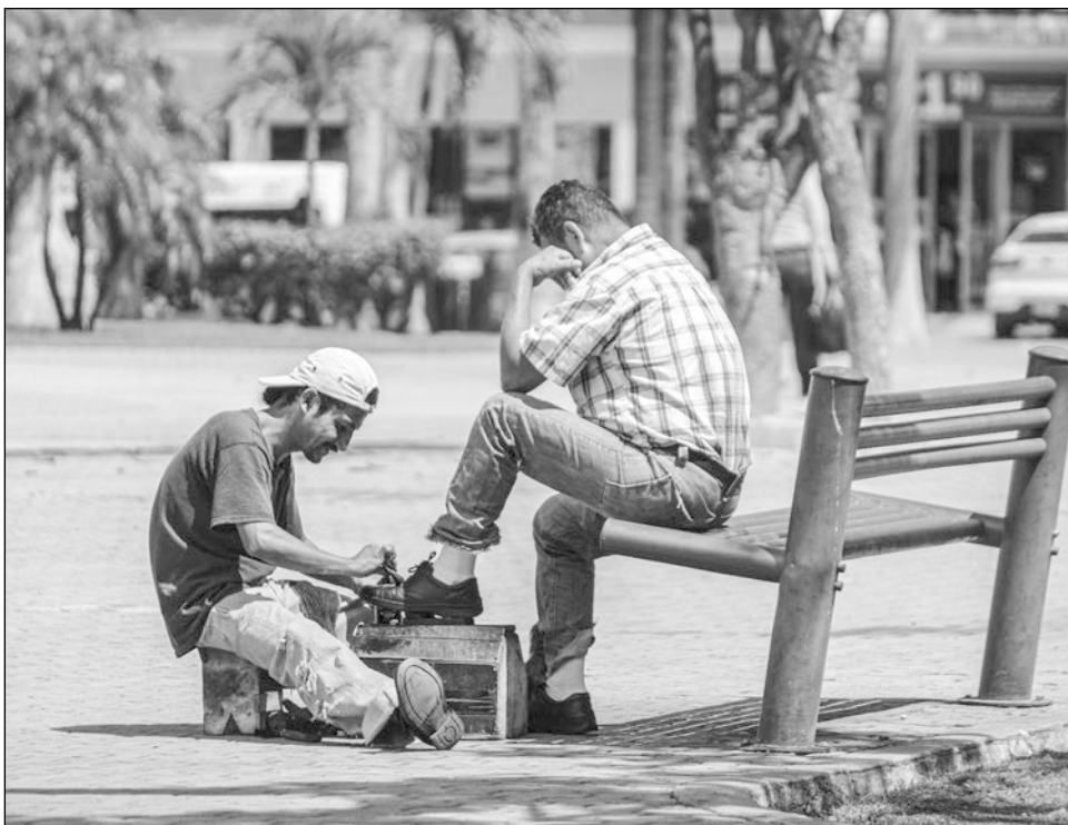
▲ La caída en el movimiento económico también llega a los boleadores, que solían tener clientela entre docentes y obreros de Pemex.