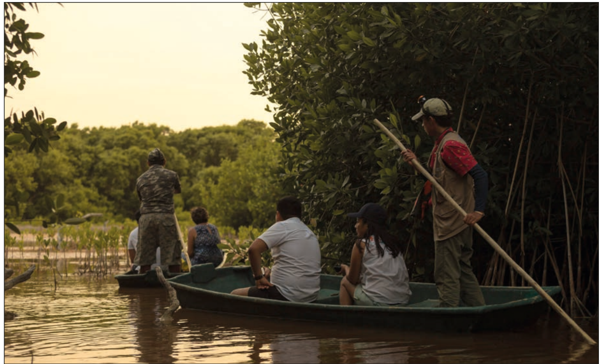
▲ El municipio de Hunucmá ofrece varios atractivos para los visitantes, como los recorridos por el manglar.

Indicó que esta es la oportunidad de desarrollo para Isla Aguada, de darse a conocer a nivel mundial y que ello genere empleos y economía, por lo que todos, cada uno desde su ámbito de responsabilidad, están sumados a trabajar para este gran reto.