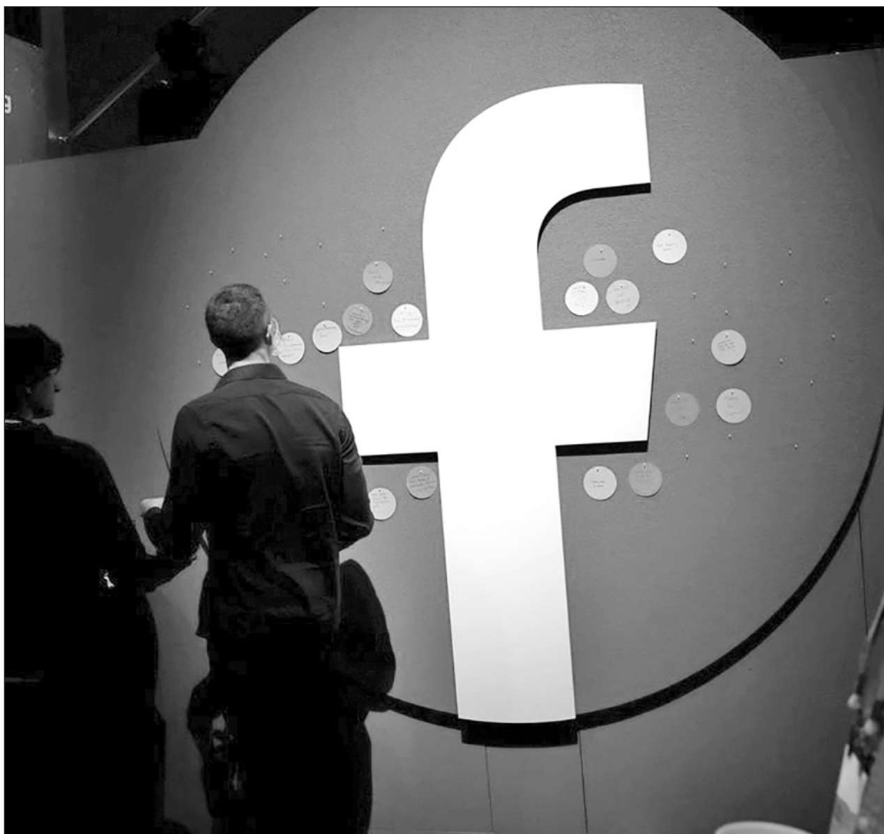
▲ Los demandantes recibirán al menos 345 dólares cada uno en concepto de indemnización.