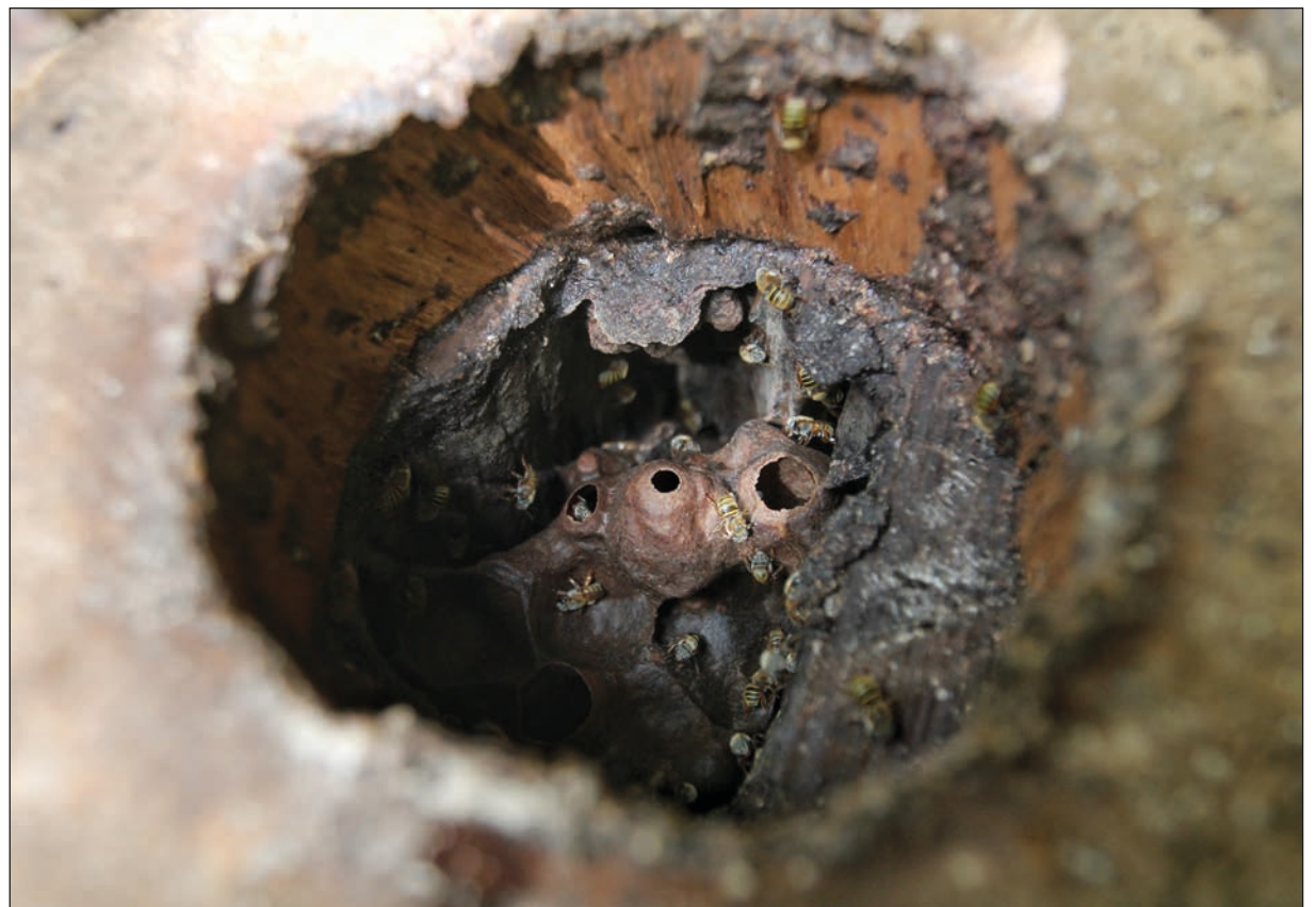
▲ La Ruta del meliponario, el Solar maya, las Cocineras tradicionales forman parte de los atractivos que podrán disfrutar los visitantes en Maní.

Finalmente, el funcionario municipal adelantó que, a iniciativa del gobierno del estado, se está construyendo un anfiteatro en la parte central del municipio, el cual está próximo a terminarse y será a finales de este mes cuando se convierta en el nuevo atractivo turístico en Maní.