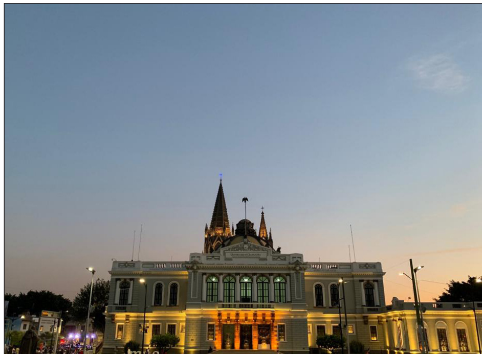
▲ En la Universidad de Guadalajara hay 6 mil 147.2 millones de pesos por aclarar.

Luego de practicar auditorías a 34 universidades y a la Secretaría de Educación Pública para revisar el ejercicio del programa de Subsidios para Organismos Descentralizados Estatales –por el que el gobierno federal transfirió 61 mil 742.2 millones de pesos a las universidades–, la Auditoría Superior de la Federación (ASF) identificó una serie de anomalías, como que tres uni-