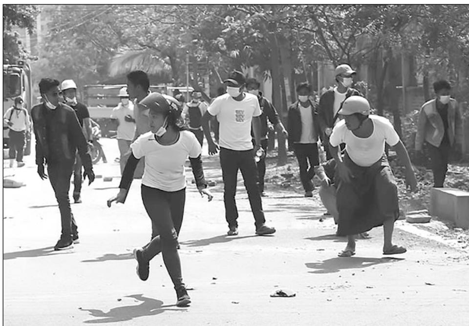
▲ La Oficina del Alto Comisionado de la ONU pidió a las fuerzas militares cesar la violencia en contra de los manifestantes birmanos.

Aún así, la AFP no pudo confirmar el balance de la ONU con una fuente independiente.