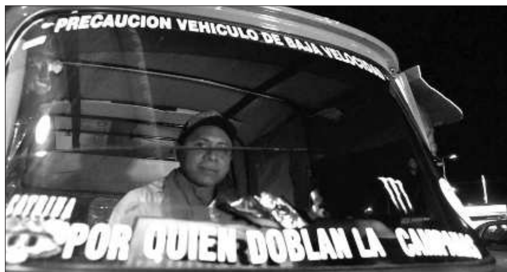
▲ "A la demografía difícilmente se le engañará: si menos jóvenes ingresan al mercado laboral formal, y la población en edad de retiro aumenta, la catástrofe financiera estará a la vuelta de pocos años".

La discusión de la reforma requiere un ejercicio de comunicación responsable, tanto del Ejecutivo, que deberá enviar una iniciativa integral y acompañarla de información detallada, como del Legislativo, donde no pueden imperar ni el mayoritismo ni la mezquindad política. Un retiro justo para quienes ya contribuyeron con su trabajo a las finanzas del Estado es una obligación moral de cualquier sociedad, y no botín de los partidos.