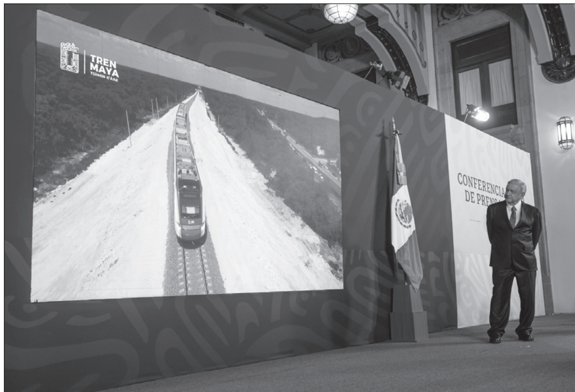
▲ “La verdad es que las mañaneras contribuyen bien poco a que sepamos lo que pasa en nuestro país. Sirven más bien para que nos enteremos de qué es lo que le disgusta al presidente, para que recordemos que ‘todo tiempo pasado fue peor’”.

Ahora se añade a este ejercicio cotidiano de post verdad una imagen espejo: Xóchitl amaga con retarnos su propia versión de la mañanera , dizque “de verdad”. No creo que por esta vía nos enteremos demasiado acerca de lo que es realmente importante entre lo que sucede en México. Más bien creo que entre las dos mañaneras veremos una suerte duelo de narrativas, al estilo de lo que nos deleitaba hace algunas décadas cuando cantaban a dúo Pedro Infante y Jorge Negrete, en Dos Tipos de Cuidado . Nada más que eso sí era divertido, y no ponía nada en juego más que las sonrisas. Lo que nos comunican hoy desde Palacio Nacional, y lo que responden