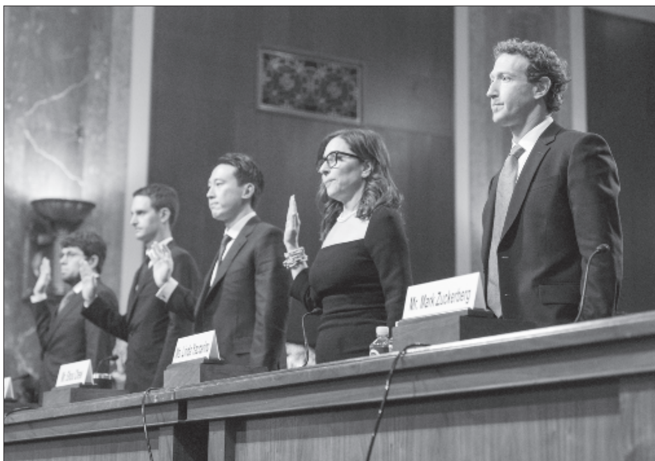
▲ Los senadores contaron historias de jóvenes que se quitaron la vida tras ser extorsionados por dinero tras compartir fotografías con depredadores sexuales; asimismo, reprodujeron videos de víctimas relatando su situación.

Bajo la presión del senador republicano Josh Hawley, Zuckerberg se puso de pie y se dirigió a las familias que sostenían fotografías de sus hijos que, decían, habían sido perjudicados por las redes sociales.