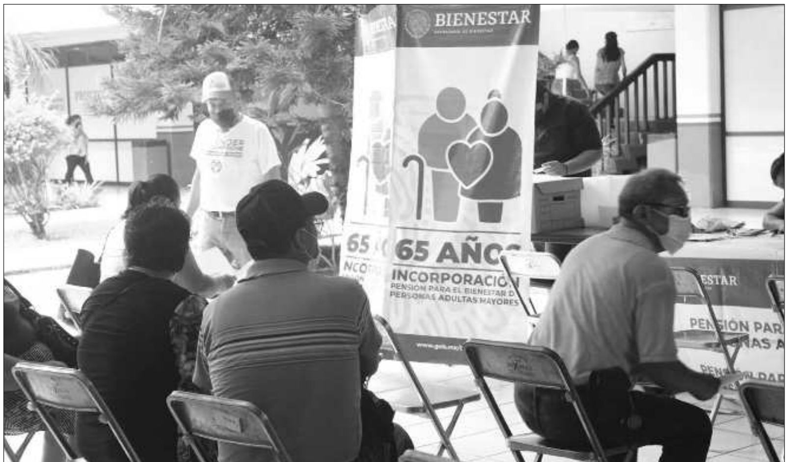
▲ “Andrés Manuel López Obrador ha dado al partido que fundó, Morena, una gran ventaja con los programas sociales y los millones de beneficiados”.