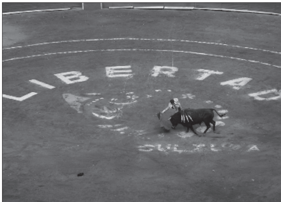
▲ Aunque en buena parte del país se permiten los espectáculos taurinos, en Sinaloa, Guerrero, Coahuila, Quintana Roo y Guadalajara están limitados por medidas judiciales.

Mientras tanto, dentro de la plaza miles de aficionados celebraban el regreso de las corridas, animados por una banda que interpretaba pasodobles.