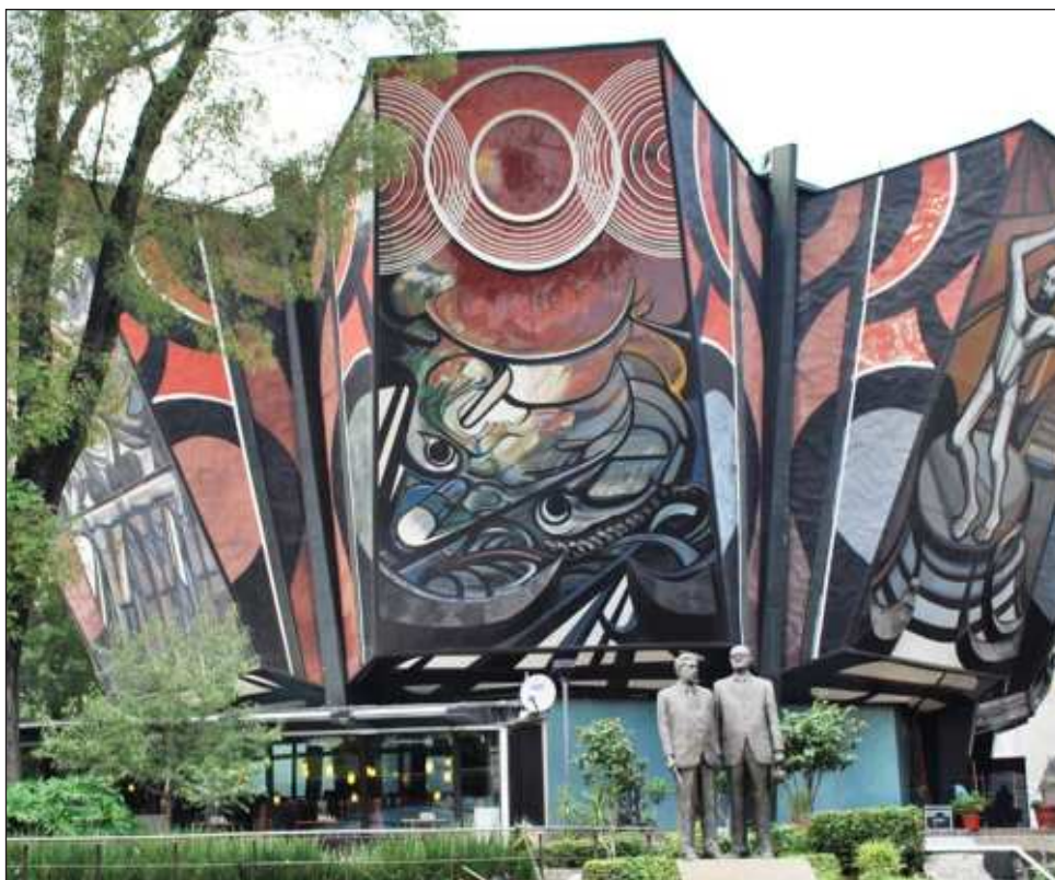
▲ “Hay un acuerdo muy comprometido” para proteger el Polyforum Cultural Siqueiros en términos estructurales y en todos los sentidos, aseveró la directora del Inbal.

Al principio, su libro Patricia... fue un mero encargo editorial. “Luego empecé a masticar la certeza de que