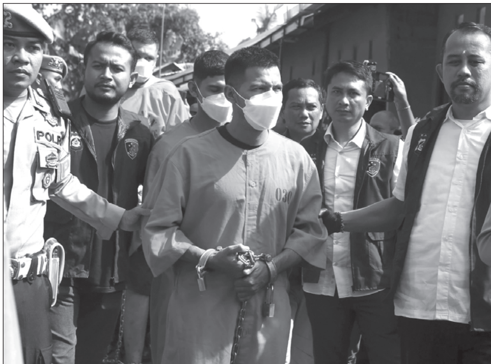
▲ Hombres disparan contra extranjeros que vacacionaban en una villa; uno resultó herido.

Bali, la isla turística de Indonesia por excelencia, ha denunciado desde el pasado año varios incidentes con ciudadanos extranjeros, de menor importancia que el