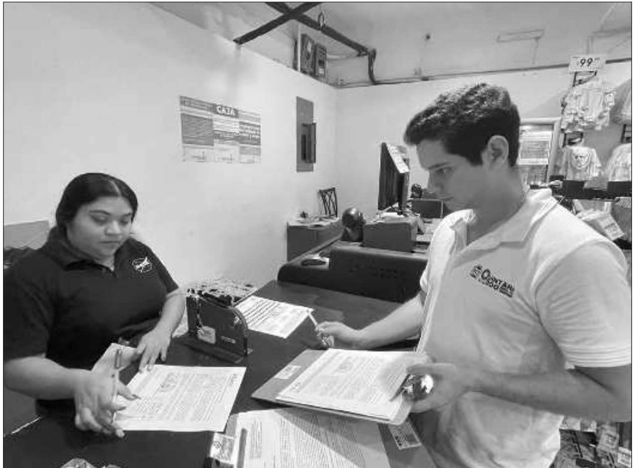
▲ Todos los patrones debieron implementar el aumento de 20% desde la primera quincena de enero.

La carrera se realizará desde el Malecón Tajamar a partir de las 8 horas en las modalidades de 3 y 5 kilómetros y luego se realizará el macro evento AMAS Awards, donde reconocerán el apoyo brindado por las autoridades; habrá adopciones de animales, demostración de perros de servicio, subasta de tres obras de arte del pintor y escultor Jorge Picazo, entre otras sorpresas.