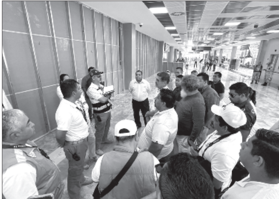
▲ El cobro que realiza la administración del aeropuerto Felipe Carrillo Puerto es por concepto de "transportación terrestre esporádica", que entró en vigor el 28 de enero

Sobre la comparación de esta tarifa con otras terminales aeroportuarias, precisó que por ejemplo en el de Cancún