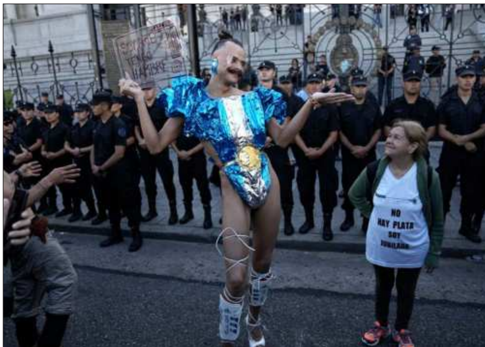
▲ La Ley de Bases y Puntos de Partida para la Libertad de los Argentinos está a debate porque es la espina dorsal de las políticas que busca implementar en el país sudamericano, para sacarlo -como suele denominarla el Ejecutivo-, de la "decadencia" actual.

En principio, La Libertad Avanza, fuerza de ultraderecha de Milei y con un ínfimo peso parlamentario,