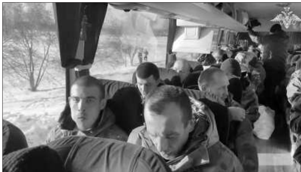
▲ “Los nuestros están en casa”, escribió Volodimir Zelensky en redes sociales, prometiendo traer de vuelta a todos los prisioneros, “combatientes o civiles”.

El Ministerio de Defensa ruso dijo que 195 soldados rusos fueron canjea-