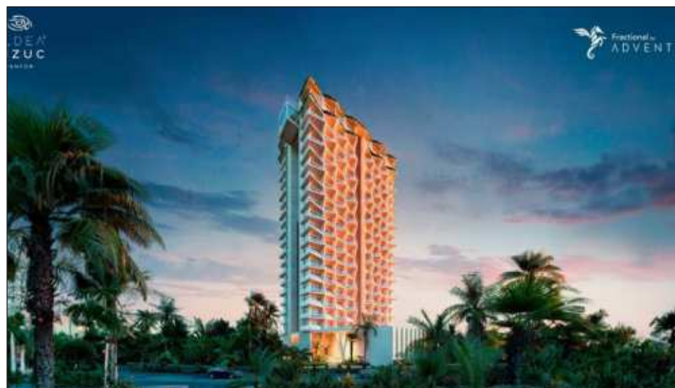
▲ El desarrollo Aldea Nizuc Cancún consta de un hotel, un wellness center, concert hall y área comercial, todo con una inversión de 150 millones de dólares.