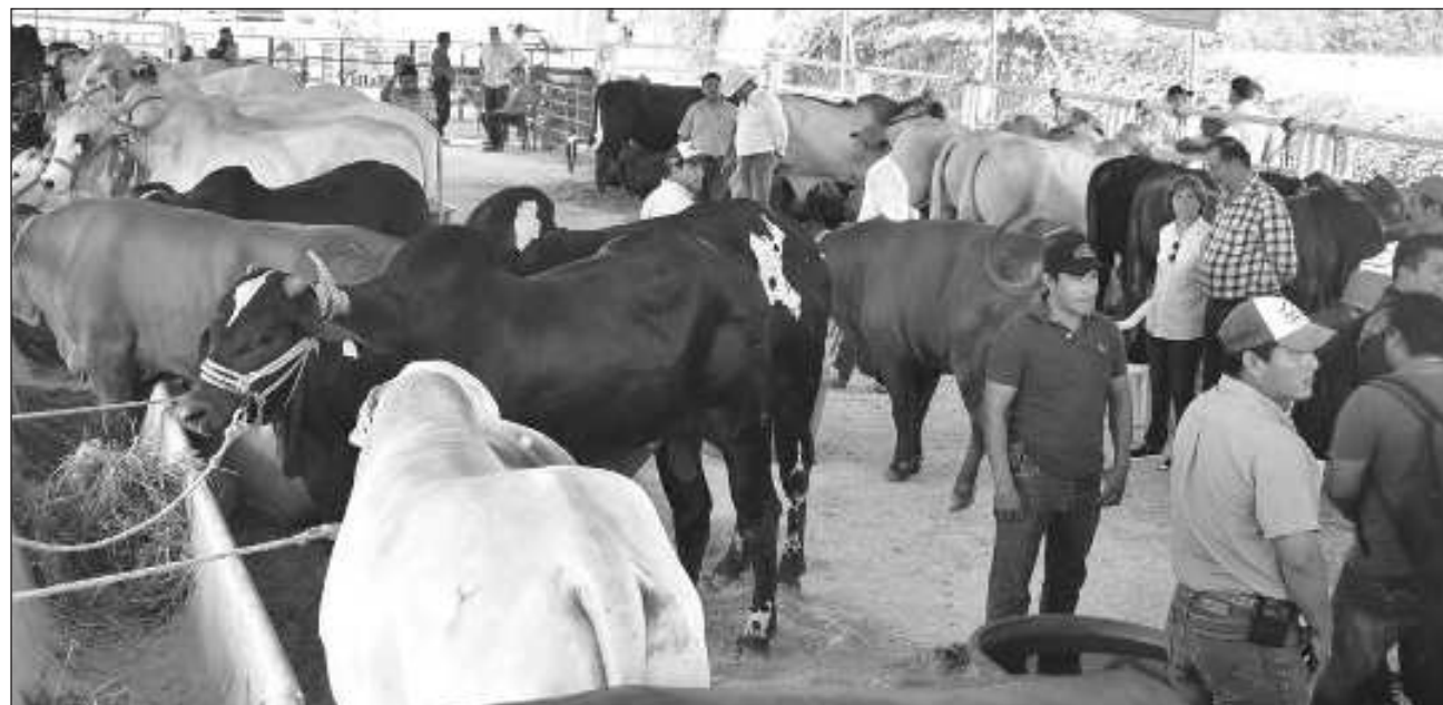
▲ Dentro de las exigencias más importantes de los ganaderos está una mayor presencia de la Guardia Nacional y de la Secretaría de Defensa Nacional, pues la incertidumbre, el miedo, y la preocupación por sus familias crece cada día.