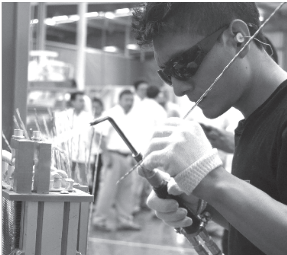
▲ De acuerdo con las cifras presentadas por la Feyac, se estima que al menos 26 empresas, es decir, el 20 por ciento aproximadamente, no renovaron sus distintivos en Campeche.