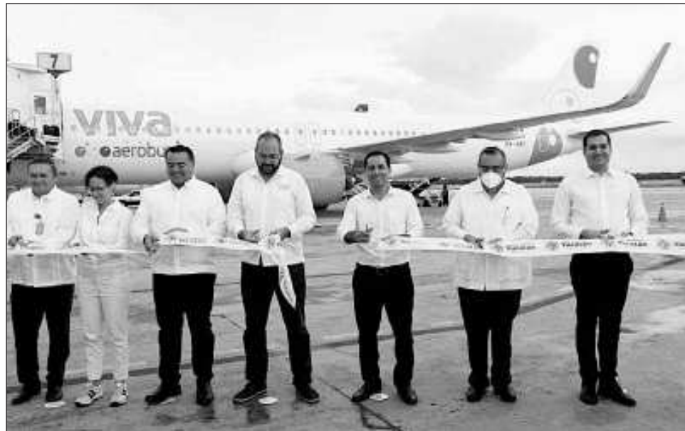
▲ Yucatán se colocó dentro de los primeros cuatro lugares del ranking de crecimiento acumulado de aeropuertos con mayor flujo de viajeros.

Esta cantidad máxima histórica se emite con base en las cifras de la Estadística Operacional de Aeropuertos, presentada por la Secretaría de Infraestructura, Comunicaciones y Transporte (SICT), correspondiente a diciembre de 2023, en la cual, la terminal aérea de Yucatán se posicionó entre las ocho primeras entidades de todo el país en cuanto a pasajeros, lo cual representó