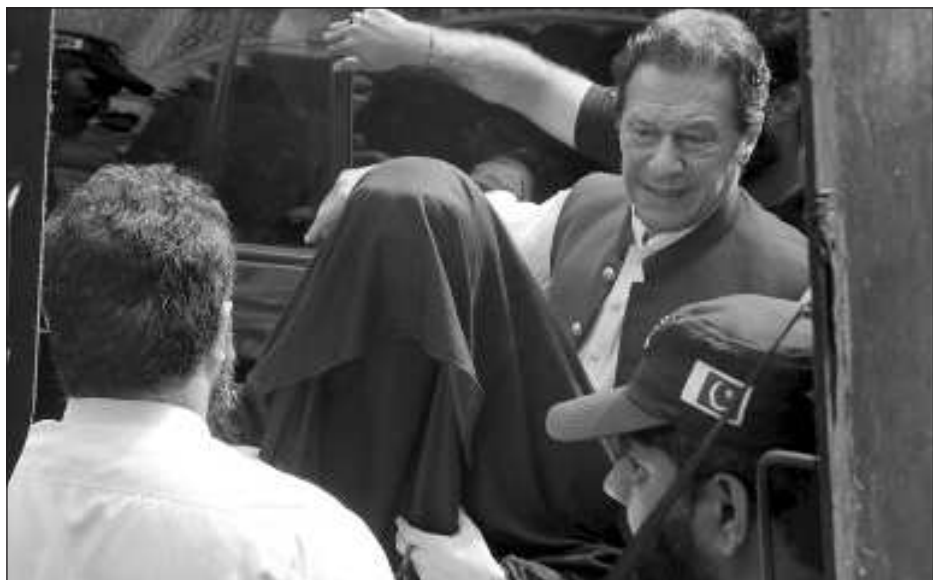
▲ Khan y su esposa, Bushra Bibi, fueron acusados de corrupción hace tres semanas por quedarse regalos oficiales del gobierno de Arabia Saudí, como joyas y relojes.

“Parece que el juez tenía prisa por anunciar el veredicto”, comentó.