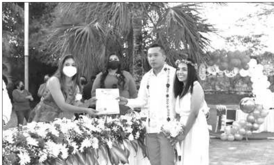
▲ La convocatoria inició el pasado 15 de enero y finalizará el día viernes 9 de febrero, de manera que todavía los ciudadanos están a tiempo para llevar a cabo el registro.

Recalcó que las bodas colectivas se van a realizar el día 14 de febrero, en un horario por definir, las cuales se llevarán a cabo en la playa nacional del DIF que se encuentra a un costado del hotel Bahía Príncipe.