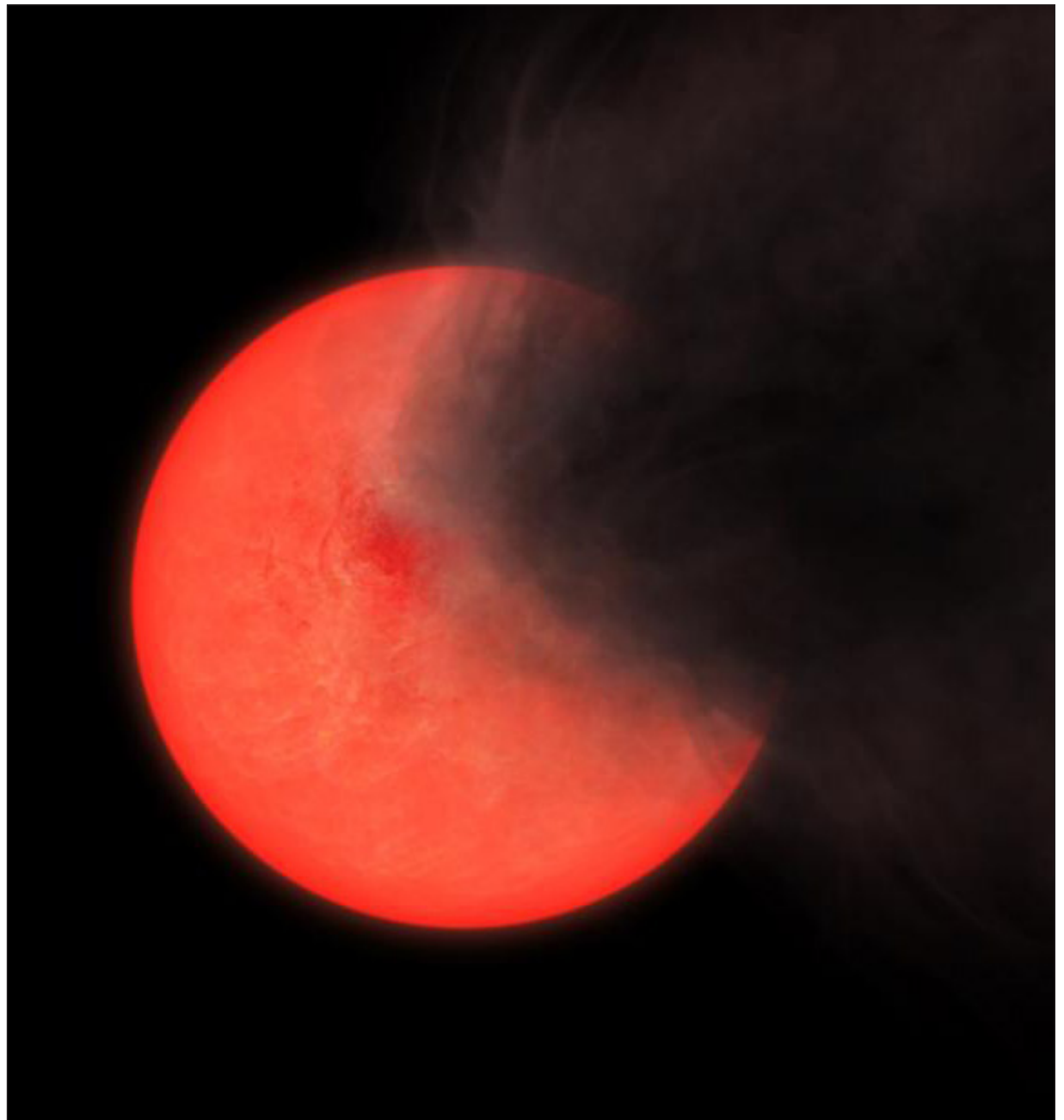
▲ Eek'o'ob ku jóok'siko'ob buuts'e' ti' yano'ob jump'éel baanta óol chuup yéetel jejeláas ba'alo'ob ku k'aaba'tik Disco Estelar Nuclear.

Kaxta'ab 32 protoestrellas, "leti'e' asab ya'ab kaxta'an chéen ichil junmúuch' tak walkila'". Ba'ax péeksik k-óole' yéetel ba'ax táant k-ojéeltike', tumen táan k-ilik eek'o'obe' chéen ti' yano'ob kex mix ba'al ku beetiko'obi', tu ya'alaj Lucas, máax ku meyaj tu noj najil xook Universidad de Hertfordshire del Reino Unido yéetel máax jo'olbes le túumben xaak'ala'.