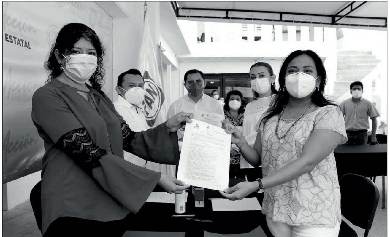
▲ El PAN indica que sus candidatas "son mujeres que trabajarán fuertemente para ser legisladoras y representarán el estado en el Congreso de la Unión".