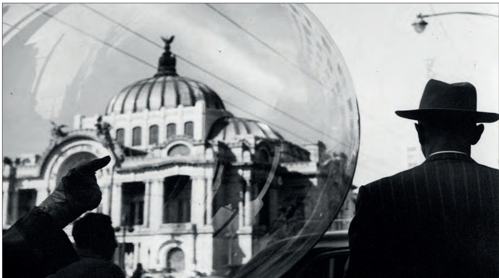
▲ La labor de Nacho López en el periodismo gráfico fue paradigmática; así lo demuestran sus tomas reproducidas en diversas revistas entre los años cuarenta y sesenta.