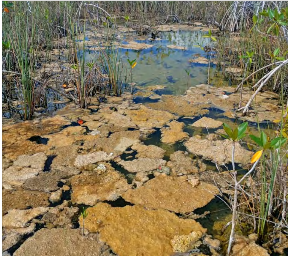
▲ Desde julio de 2020 la laguna perdió sus tonos azules y turquesas tras el paso de la tormenta tropical Cristóbal.

“Andábamos en el paddle por el Estero de Chac (parte de la laguna en Othón P. Blanco), teníamos como un