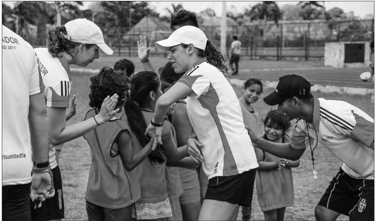
▲ A través del proyecto Pioneras , la organización entrena presencialmente a unas 10 menores, las cuales tienen un seguimiento personalizado de metas.

En entrevista con La Jornada Maya, Calatayud Martínez recalca cómo las ac-