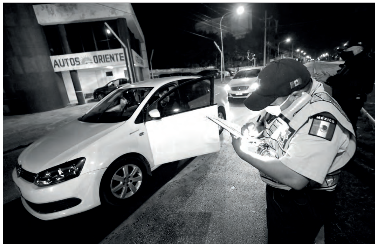
▲ El horario de restricción a la circulación vehicular va de las 11:30 de la noche hasta las 5:00 de la mañana, y opera desde el mes de septiembre de 2020.

La dependencia estatal hace un nuevo llamado a la cooperación de toda la población para acatar esta medida, a fin de reducir los riesgos de contagio y proteger la salud de todas las personas que habitan en Yucatán.