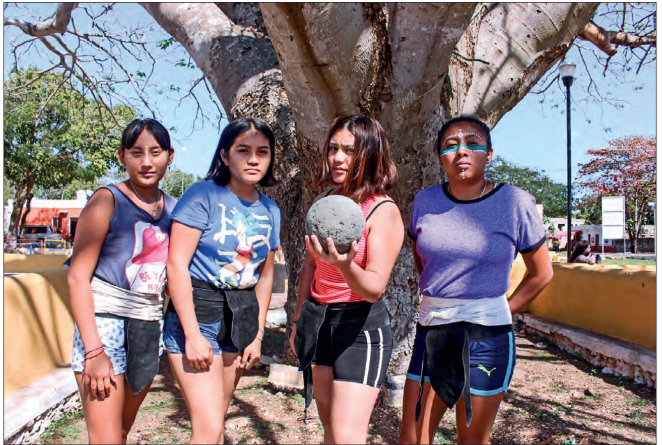
▲ El primer equipo femenino de juego de pelota maya consta de seis mujeres de entre 14 y 21 años, y aunque hay quienes las critican, esto no las detiene.

Rompen los estereotipos de género, demuestran que también tienen fuerza y habilidades para practicar este deporte, al igual que los hombres; incluso hasta mejor, poco a poco van ganando terreno en esta práctica. Los hombres no las excluyen, al contrario, las integran.