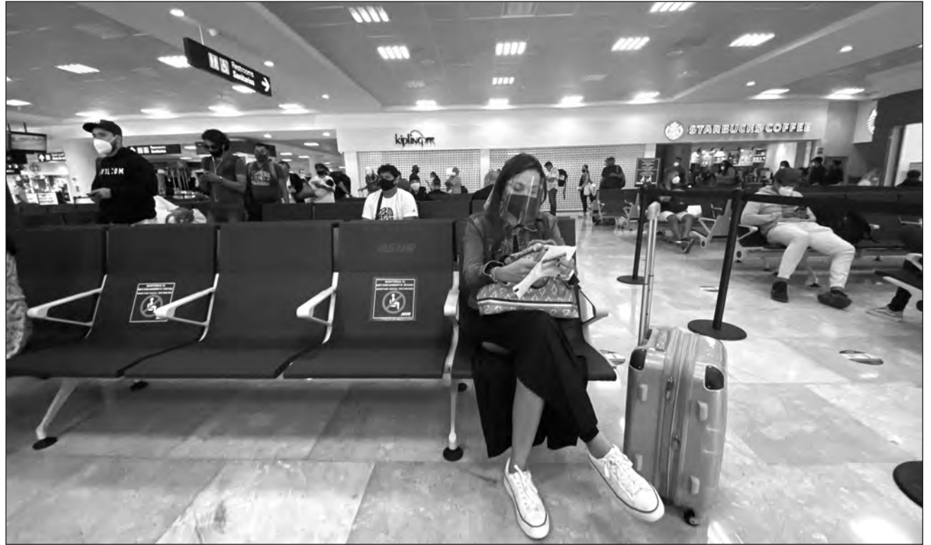
▲ Al anuncio de Canadá se unieron otros países que figuran en el top 10 de emisión de turismo hacia Quintana Roo: Francia y Cuba.

El gobierno de Canadá informó el viernes pasado que