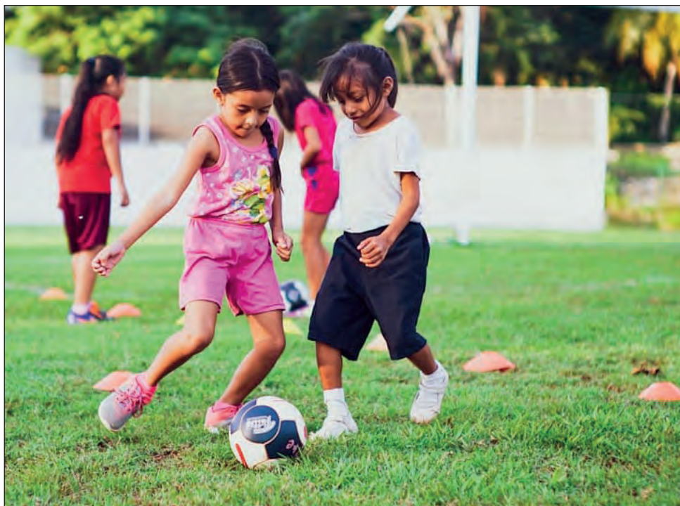
▲ Yéetel u nu'ukbesajil Pioneras, u múuch'kabil Chicas Unidas-Girls United FA México ku meyaj yéetel lajuntúul xch'úupalal, ikil u ts'áak u muuk'il u yóolo'ob. Oochel @girlsunitedfamex

Múuch'kabile' ku meyaj yéetel xch'úupalal yéetel xlo'obayen paalal ichil 5 tak 18 u ja'abil.