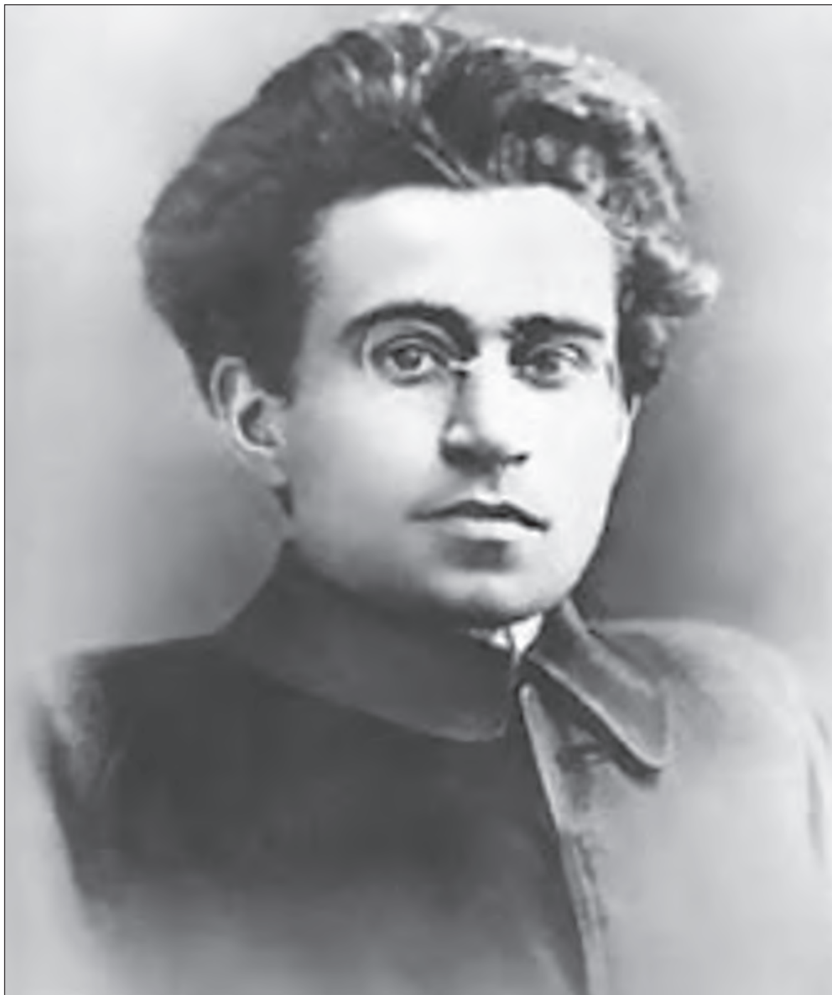
▲ Antonio Gramsci menciona que todo grupo en el poder necesita producir y reproducir su hegemonía, y para ello se vale de los intelectuales.

Gramsci habla de dos tipos de intelectuales: el orgánico y el tra-