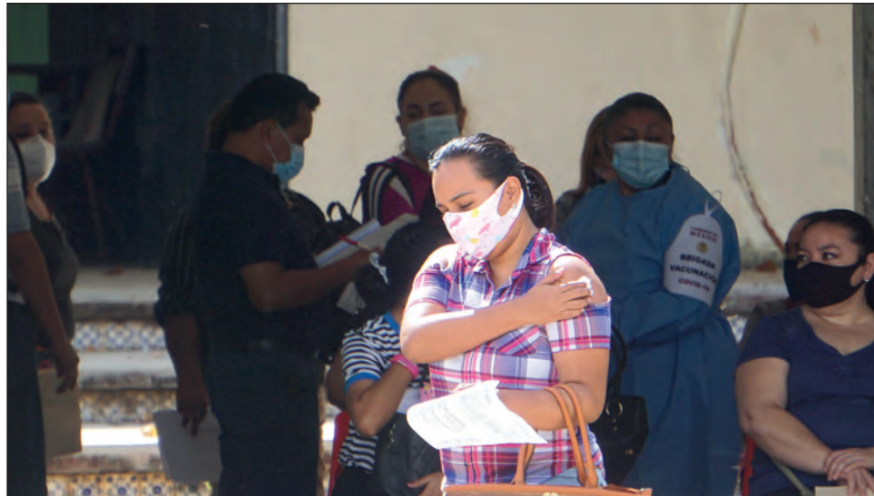
▲ Para el gobierno de Campeche, primero se debió concluir la inmunización del personal médico y de enfermería para luego avanzar hacia otros sectores, pero la agenda federal es distinta.

Cuestionado sobre las protestas que se han presentado en diferentes nosocomios de la entidad por la falta de vacunación a personal médico y de enfermería, el funcionario dijo que se confía en la vacunación a nivel nacional, de acuerdo con lo que dicta el Centro Nacional de Epidemiología: "Obviamente nosotros estamos trabajando con el gobierno federal para que se vacune de manera pronta y expedita, sobre los listados y los patrones que ellos tienen".