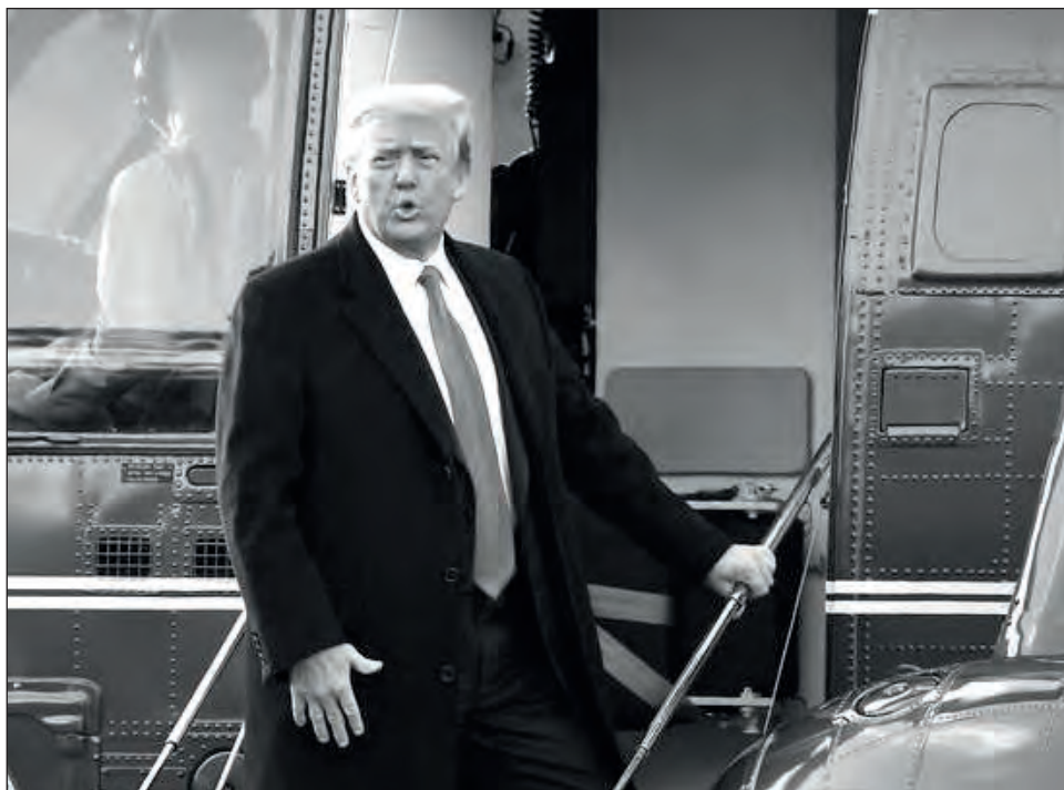
▲ Trump ha tenido problemas para encontrar abogados dispuestos a defenderle.

Después de que numerosos abogados que le habían defendido antes declinaran asumir el caso, uno de los aliados más cercanos de Trump en el senado, el se-