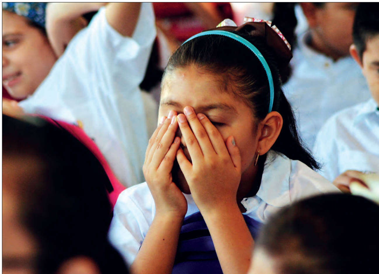
▲ La fatiga pandémica resulta de la hipervigilancia de medidas de prevención de contagios de COVID-19 o de la incertidumbre económica.

Incluso, dijo que por parte del Colegio hay 25 especialistas que atienden vía telefónica a quienes necesitan auxilio psicológico urgentemente, desde que inició la contingencia sanitaria y a pesar de que