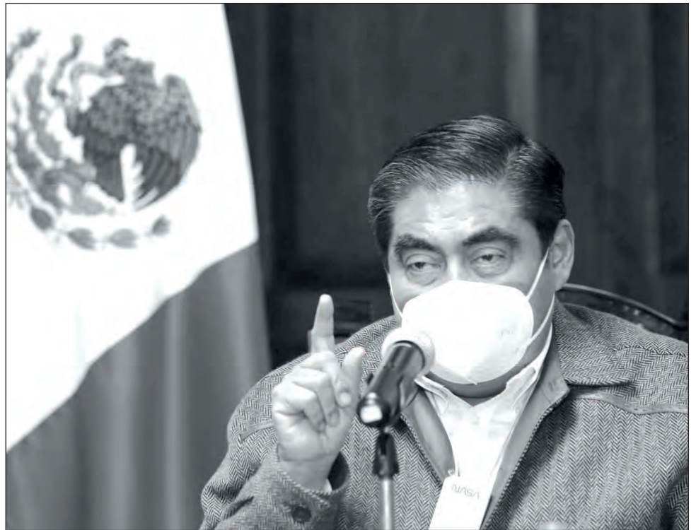
▲ El gobernador poblano, Miguel Ángel Barbosa, minimizó desde hace meses los efectos del virus y sostuvo que sólo afectaba a los ricos.

En la mayoría de los estados que se clasificaron nuevamente en rojo del primero al 14 de febrero, el mayor incremento en los decesos confirmados a COVID-19 se presentó entre el 8 y 22 de enero. En el caso de Puebla, pasó de 5 mil 939 a 6 mil 635 fallecimientos acumulados, es decir, 53.3 por ciento del total de defunciones confirmadas en el primer mes del año en esa entidad.