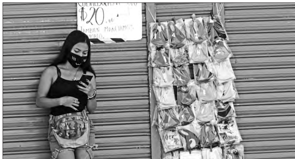
▲ Por la alta demanda, varios artículos de salud como los oxímetros y caretas han encarecido desproporcionadamente.

La caja de cubrebocas con 10 piezas, según el or-