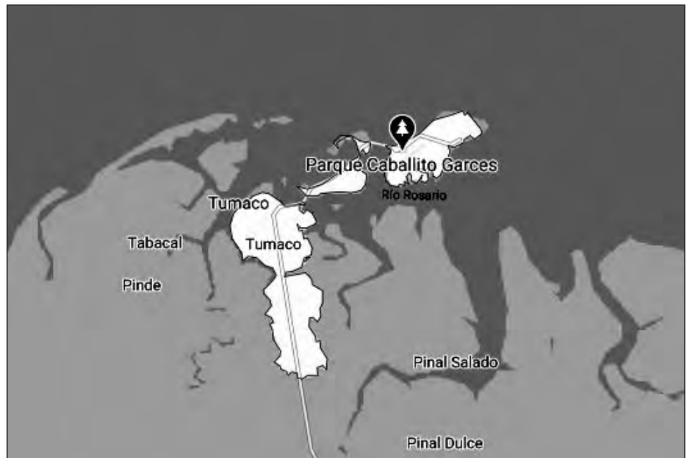
▲ Las dos embarcaciones se hundieron cuando se dirigían desde el puerto de Tumaco a la población de San José del Guayabo.

“No tenemos en este momento certeza de las causas del siniestro. Pero ninguna de las personas fallecidas tenía chalecos salvavidas”, afirmó Espitia al revelar que otros 36 pasajeros de las embarcaciones fueron rescatados con vida por pescadores y habitantes de la zona.