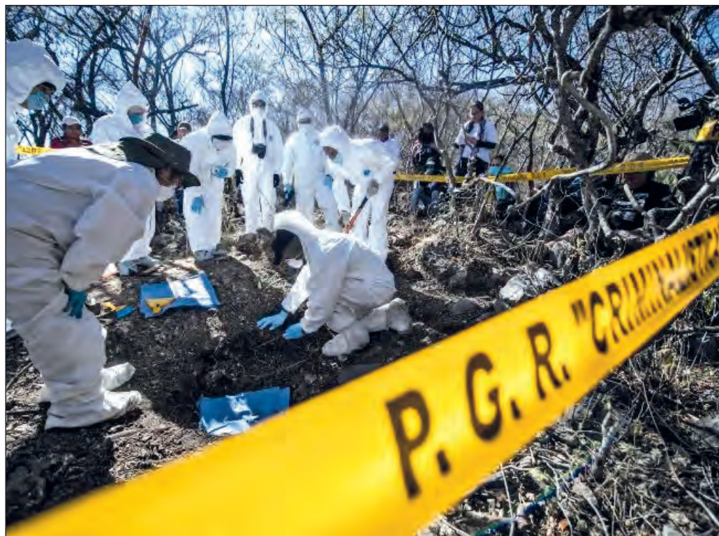
▲ Jalisco, Guanajuato, Colima, Michoacán y Zacatecas concentran 79.5 por ciento de las exhumaciones en fosas clandestinas de los últimos dos años.

De acuerdo con datos proporcionados el viernes por la Secretaría de Gobernación, sólo entre diciembre de 2018 y el mismo mes de 2020, más de mil cadáveres fueron encontrados en fosas clandestinas en la nación. Aunque este lacerante fenómeno se extiende por el territorio nacional, 79.5 por ciento de los cuerpos fueron exhumados en cinco entidades -Jalisco, Guanajuato, Colima, Michoacán y Zacatecas-, y más de la mitad se encontraban en apenas seis municipios de Jalisco y Guanajuato. En el mismo periodo, las autoridades abrieron 37 mil 800 carpetas de investigación por personas desaparecidas, 44 por ciento de las cuales no han sido localizadas.