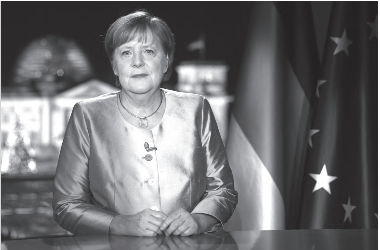
▲ La clave del éxito para la canciller alemana fue una combinación de férrea determinación, pragmatismo y capacidad analítica