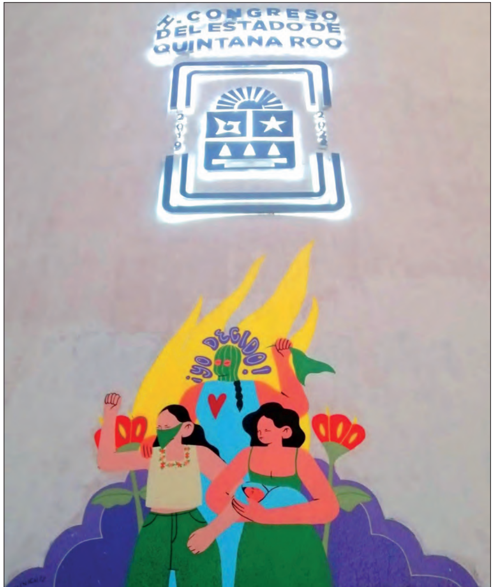
▲ Las feministas advirtieron que seguirán "firmes y resistiendo" para que el Poder Legislativo tome acciones concretas sobre los puntos de su pliego petitorio.

Este martes, diputadas y diputados de la XVI Legislatura se reunirán para acordar una nueva estrategia para abordar el tema.