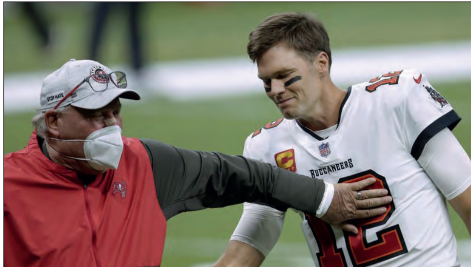
▲ Tom Brady y su entrenador con Tampa Bay, Bruce Arians.

Brady será uno de los jugadores de los que más se hablará al comenzar una “Semana del Super Bowl” que será diferente, rumbo a una final que será histórica por varias razones, entre ellas que Tampa será el primer equipo en jugar el gran partido en su estadio y que se disputará el primer duelo entre los últimos dos mariscales de campo campeones. El analista Tony Romo comentó que el Brady-Mahomes será uno de los más grandes choques deportivos en